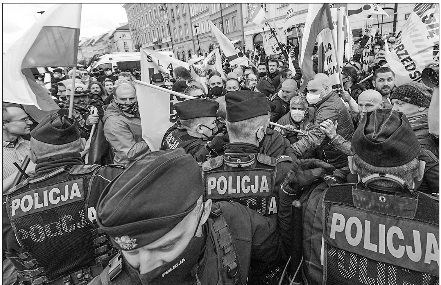
□ Нация расколота почти пополам.

6. Kd6X Забудно, что в эту ловушку частенько попадают и в сегодняшние дни.