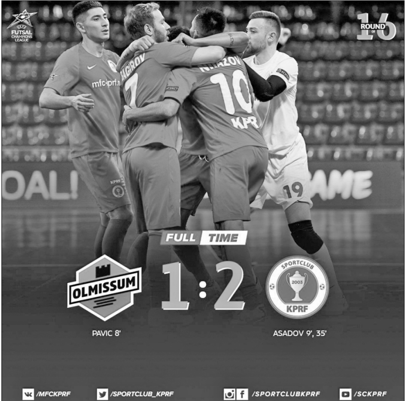
Футболисты МФК КПРФ поздравляют друг друга с победой и выходом в финальную часть Лиги чемпионов.

Кстати, о «Финале восьми»: на днях УЕФА принял решение перенести его из белорусского Минска в хорватский Загреб. Решение явно политизированное, но европейские спортивные чиновники объяснили его по-своему: дескать, непростая после президентских выборов обстановка в Республике Беларусь сейчас не позволяет проводить там крупные международные турниры. Таким образом, с 28 апреля по 3 мая решающая финальная стадия Лиги чемпионов пройдёт в Хорватии. По её расписанию МФК КПРФ встретится в