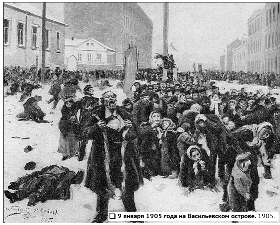
9 января 1905 года на Васильевском острове. 1905.

Именно такой, «подмосковной», предстаёт перед нами молодая крестьянка, приехавшая навещать подвизавшегося в город на заработки мужа — с грудным малышом ведь не отправиться в путь издалека. Картина с непритязательным названием «На бульваре», пожалуй, одна из вершин в творчестве «великого бытописателя» В.Е. Маковского. У народного художника СССР Бориса Иогансона есть статья, целиком посвящённая Маков-