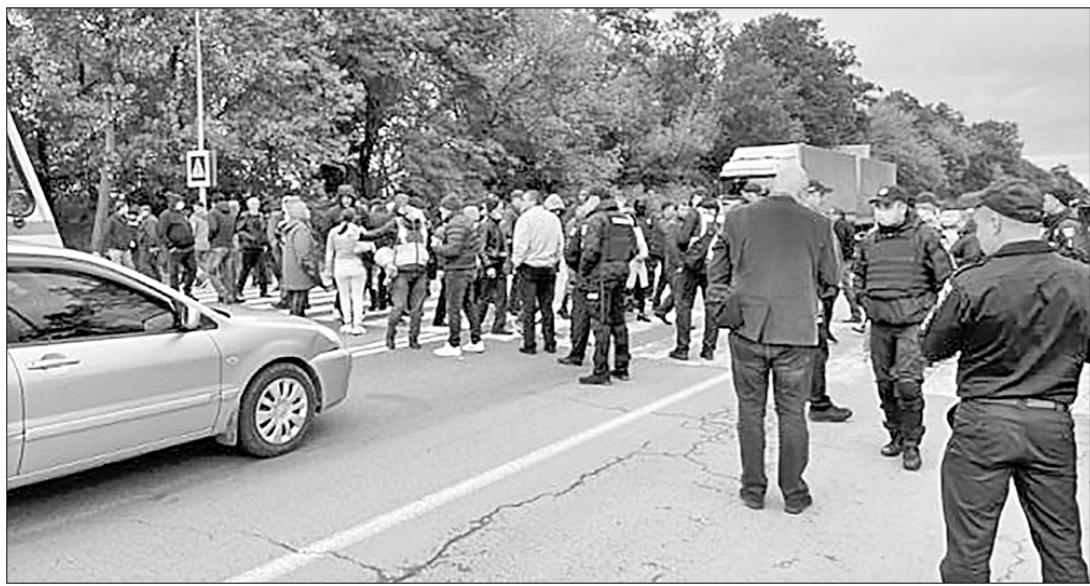
20 сентября жители села Дубовцы Черновицкой области, которые отключили от газоснабжения, перекрыли трассу международного значения (на снимке). То же сделали и люди из села Корытне на Буковине, они остаются без газа уже более трёх месяцев.