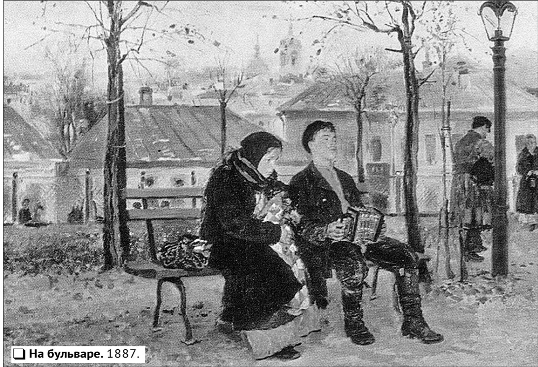
На бульваре. 1887.

даже стекло в фонаре тоскливо склонилось в сторону». Есть ли выход из всей этой безнадеги? Наверное, есть. Но его ещё нужно найти. И вообще, как России жить дальше? Что зависит в её грядущей судьбе именно от тебя? На эти жгучие вопросы пытаются ответить герои картины «Вечеринка». Видно сразу, что не попить чайку из самовара, не потанцевать с барышнями и попеть хором собрались они в тесной комнате под тусклой керосиновой лампой. Впрочем, они обязательно спонут все вместе. «Марсельезу». Но это будет чуть позже. А пока ораторствует о чём-то пе-