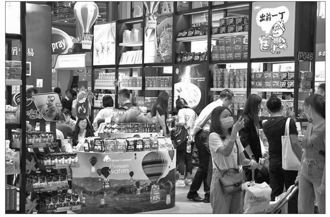
● 21-я Китайская международная выставка продуктов питания и напитков открылась в Национальном выставочном конференц-центре в Шанхае. Жители и гости мегаполиса проявляют к ней большой интерес.