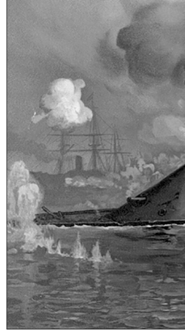
• Бой броненосцев южан и северян во время Гражданской войны в США. Литография.

Высоко оценивая роль броненосцев, Энгельс делал немало и других замечаний на этот счёт. Он отметил, что вскоре после появления первых броненосцев «прогресс артиллерии скоро перешёл в броню; для любой... толшины брони находили новое, более тяжёлое орудие, которое легче пробивало её». Из этого Энгельс делает вывод: «Соперничество между броневой защитой и пробивной силой орудий ещё так далеко от завершения, что в настоящее время военный