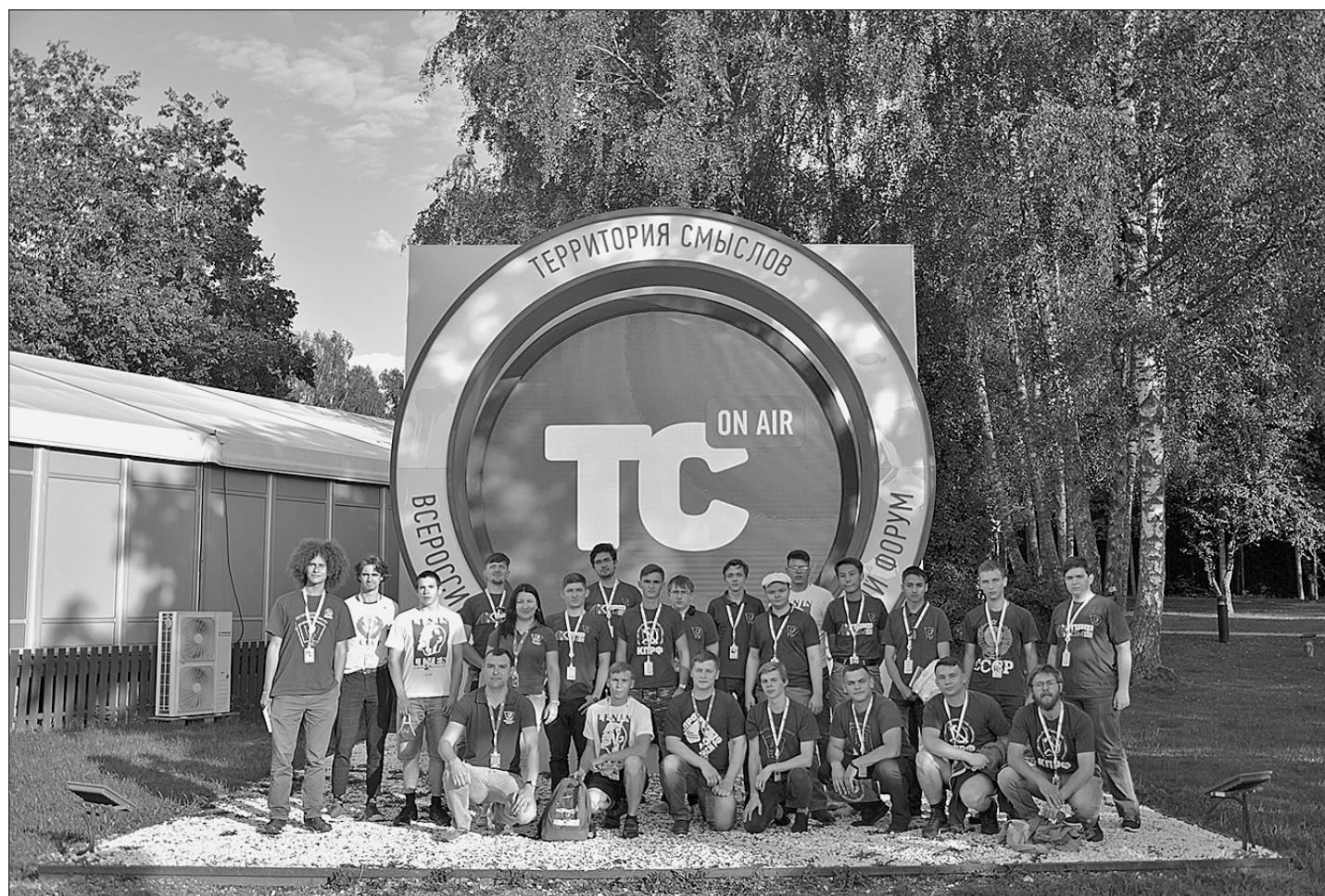
Делегация Ленинского комсомола на «Территории смыслов».

А главная проблема России в том, что 30 лет назад мы спустились на капиталистический путь и стали в мировой капитали-