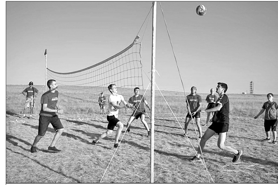
В здоровом теле — здоровый дух.

Учредители — журналистская организация АНО «Редакция газеты «Правда», Коммунистическая партия Российской Федерации