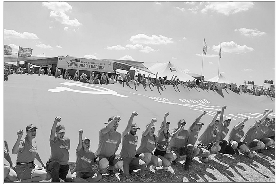
Грандиозное полотнище копия Знамени Победы.