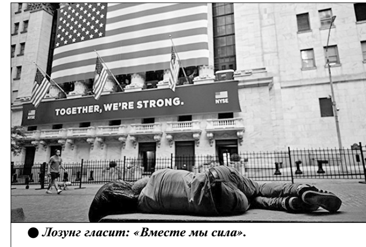
● Лозунг гласит: «Вместе мы сила».

Разрыв между богатыми и бедными в США увеличивается