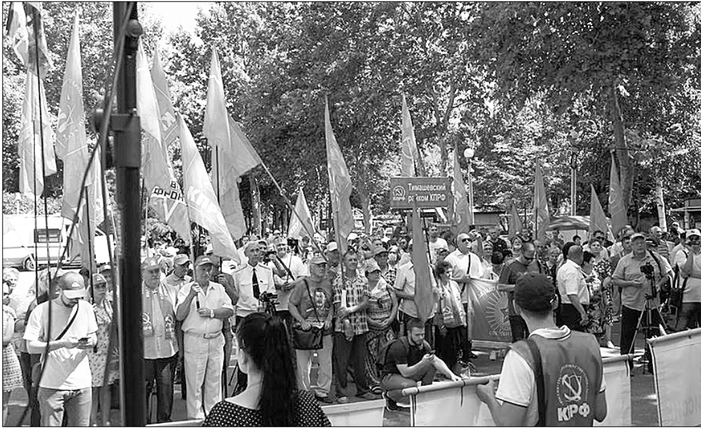
В Краснодаре 8 августа состоялся митинг, организованный коммунистами в поддержку кандидата, выдвинутого КПРФ на выборы главы администрации края, Александра Сафронова. Собравшиеся также протестовали против дискредитации избирательной системы трёхдневным голосованием.