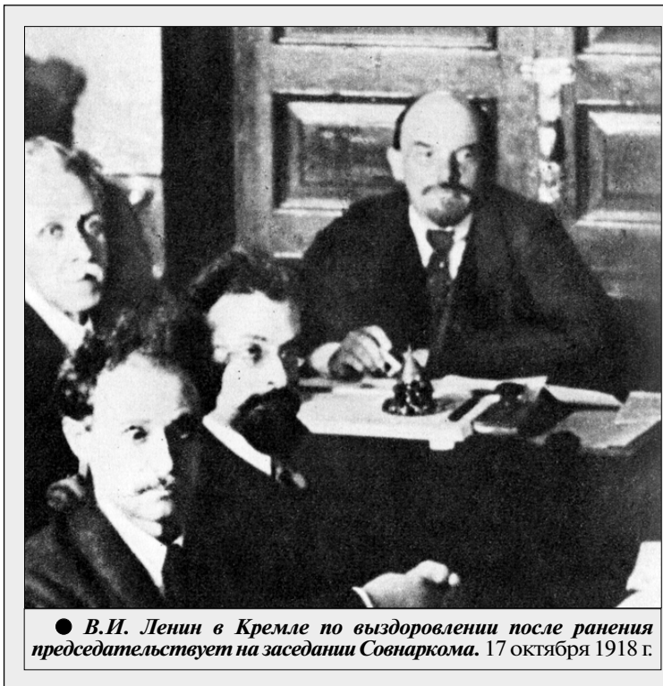
В.И. Ленин в Кремле по выздоровлении после ранения председательствует на заседании Совнаркома. 17 октября 1918 г.