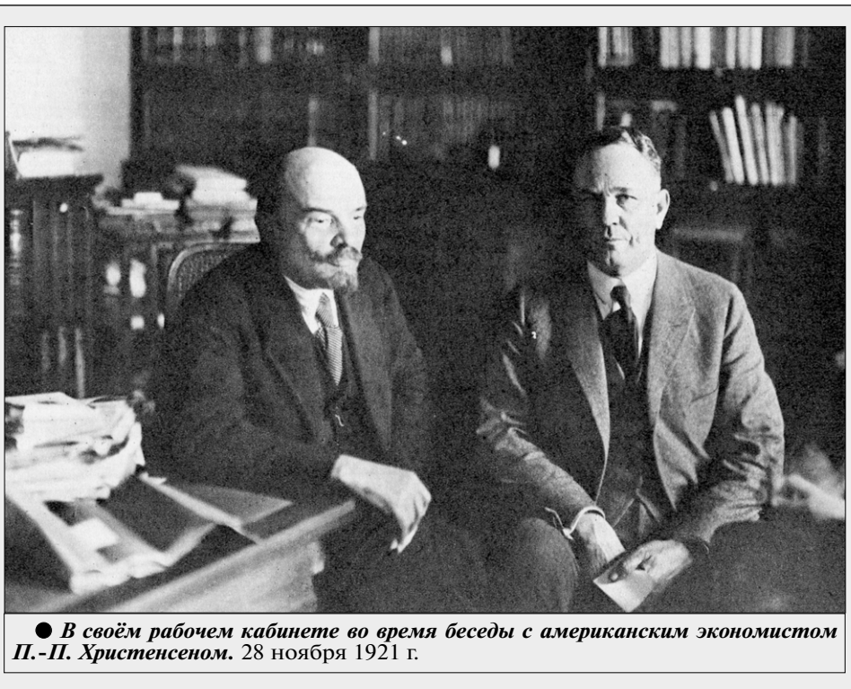
В своём рабочем кабинете во время беседы с американским экономистом П.-П. Христиансеном. 28 ноября 1921 г.

дим в новый союз, новую федерацию, «Союз Советских Республик Европы и Азии». — Но каким же сложным, тонким, потребовавшим колоссальных усилий и пристального внимания всей партии, всех советских органов, оказался тот процесс становления Союза Советских Социалистических Республик?