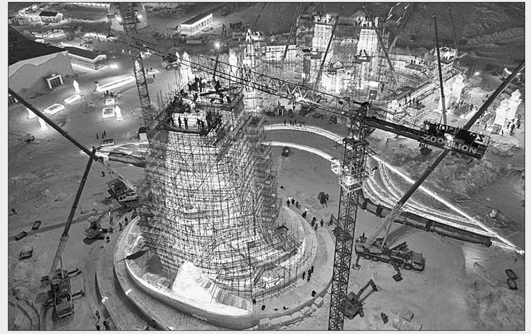
● В Харбине, административном центре провинции Хэйлуцзян (Северо-Восточный Китай), стартовало строительство 21-й парковой зоны «Мир льда и снега». Общая площадь парковой зоны на сей раз составляет 600 тысяч квадратных метров; на сооружение «ледово-снежной фабрики мечты» уйдёт свыше 200 тысяч кубометров снега и льда.