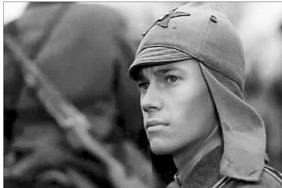
Кадр из шестисерийного фильма «Как закалялась сталь», который был снят в 1973 году на Киевской киностудии имени Довженко режиссёром Николаем Мащенко. В роли Павки Корчагина — Владимир Конкин, заслуженный артист Украинской ССР и РСФСР, лауреат премии Ленинского комсомола.

У нас в Белгороде есть библиотека имени Николая Островского. Обком и горком комсомола проводят здесь (не скажу, что часто, но периодически) интересные мероприятия, посвящённые выпадению советскому писателю. Об одном из них рассказывала областная газета КПРФ «Слово коммуниста»: «26 сентября в Белгородской библиотеке имени Николая Островского состоялась встреча, посвящённая 115-й годовщине со дня рождения писателя. В конференц-зале библиотеки собрались представители нескольких поколений. Сотрудники библиотеки подготовили выставку и лекцию о жизни Островского. А биография его была действительно удивительной: уже будучи прикованным