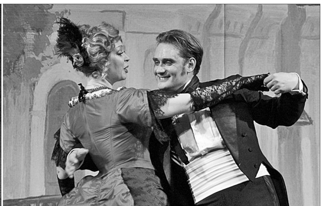
Среди них — чеховский «Вишнёвый сад» (фото слева) и «На всякого мудреца довольно простоты» по пьесе А.Н. Островского.