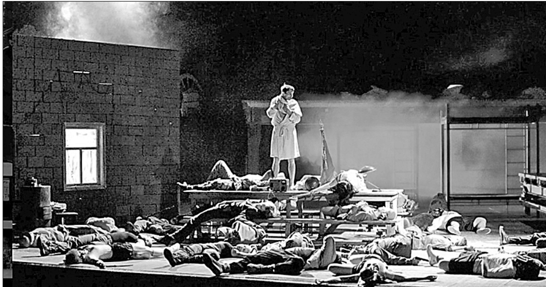
Этот спектакль под названием «Последний герой», заявленный Э. Бояковым как программный для «нового» МХАТ, многие зрители и театральные критики считают бездарной вакханалией абсурда.