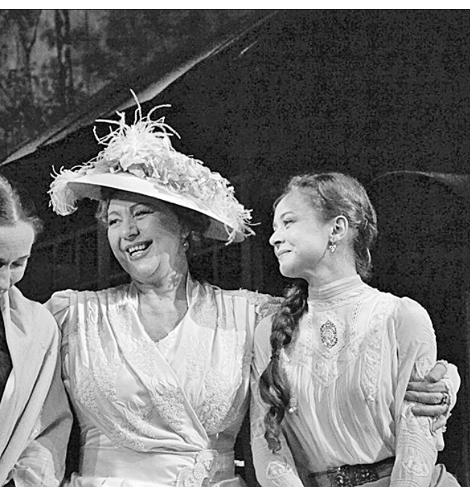
А тем временем лучшие спектакли, поставленные под дорониным руководством и с ведущими актёрами, которые оказались вдруг неудобными новому худруку, изымаются из репертуара МХАТ.