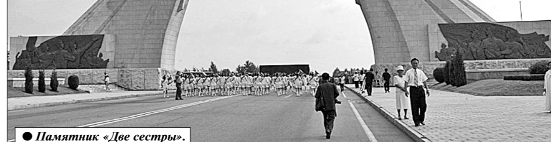
Памятник «Две сестры».

друже с народами СССР, и особенно с русскими, как близкими корейцам по духу, по стремлению к справедливости.