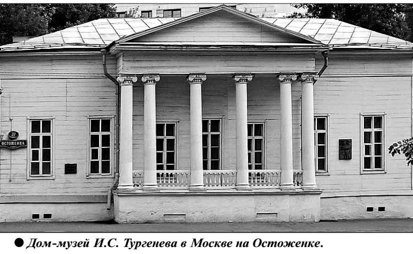
● Дом-музей И.С. Тургенева в Москве на Остоженке.

названная «Лики России». Здесь и просветители, и полководцы, и учёные, и художники — от княгини Дашковой до актёра Щепкина. Понятна мысль устроителей: не на пустое место пришёл всемирно известный Тургенев; было кому поддержать русскую славу и до него. А всё-таки лучше было бы выбрать из этих лиц тех, кто непосредственно связан с писателем. Вот, например, Щепкин — он почувствовал в Тургеневе талант драматурга и поддержал его первые опыты. С лёгкой руки Щепкина состоялся дебют молодого драматурга на сцене Малого театра. Разве это не важно для «Времени московского»? К сожалению, о дружбе с Щепкиным, о совместной с ним работе нет полного представления. А ведь Театральный музей имени А. Бахрушина мог бы представить для выставки обширный материал.