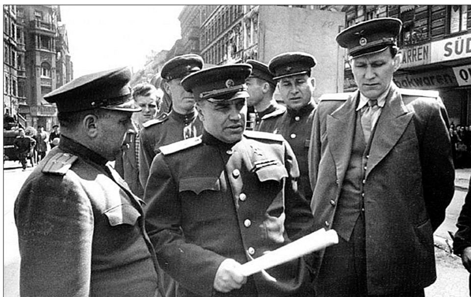
Ветераны войны отметили 19 марта в Риге день рождения Николая Эрастовича Берзарина, советского генерал-полковника, участника боёв на озере Хасан, под Ленинградом и Яссами, на Висле и Одере и за Берлин, первого команданта послевоенного Берлина, Героя Советского Союза. Погиб он в автокатастрофе 16 июня 1945 года.

АТЕМ ВРЕМЕНЕМ в польском городе Гожуве открыли мемориальную доску «В память о жертвах преступлений на Вольни». Мемориальная доска была вмурована в том самом месте, которое ранее увековечивало па-