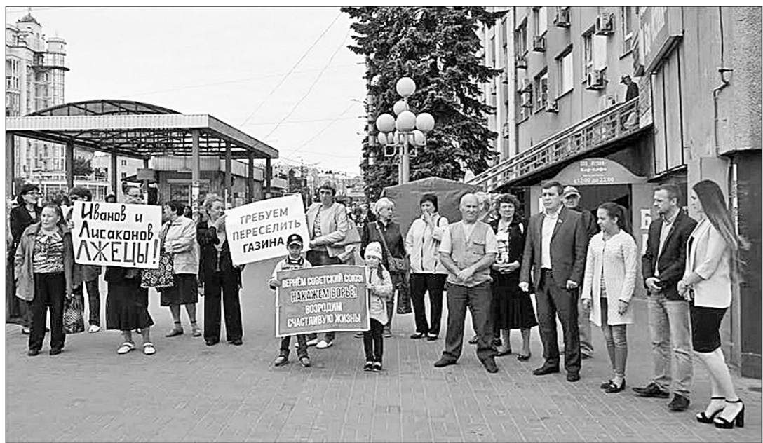
Третий год жители аварийного дома №5 на улице Газина в Липецке добиваются переселения.

Вот так!.. Куда деваться жильцам после этого — чиновники даже не думают.