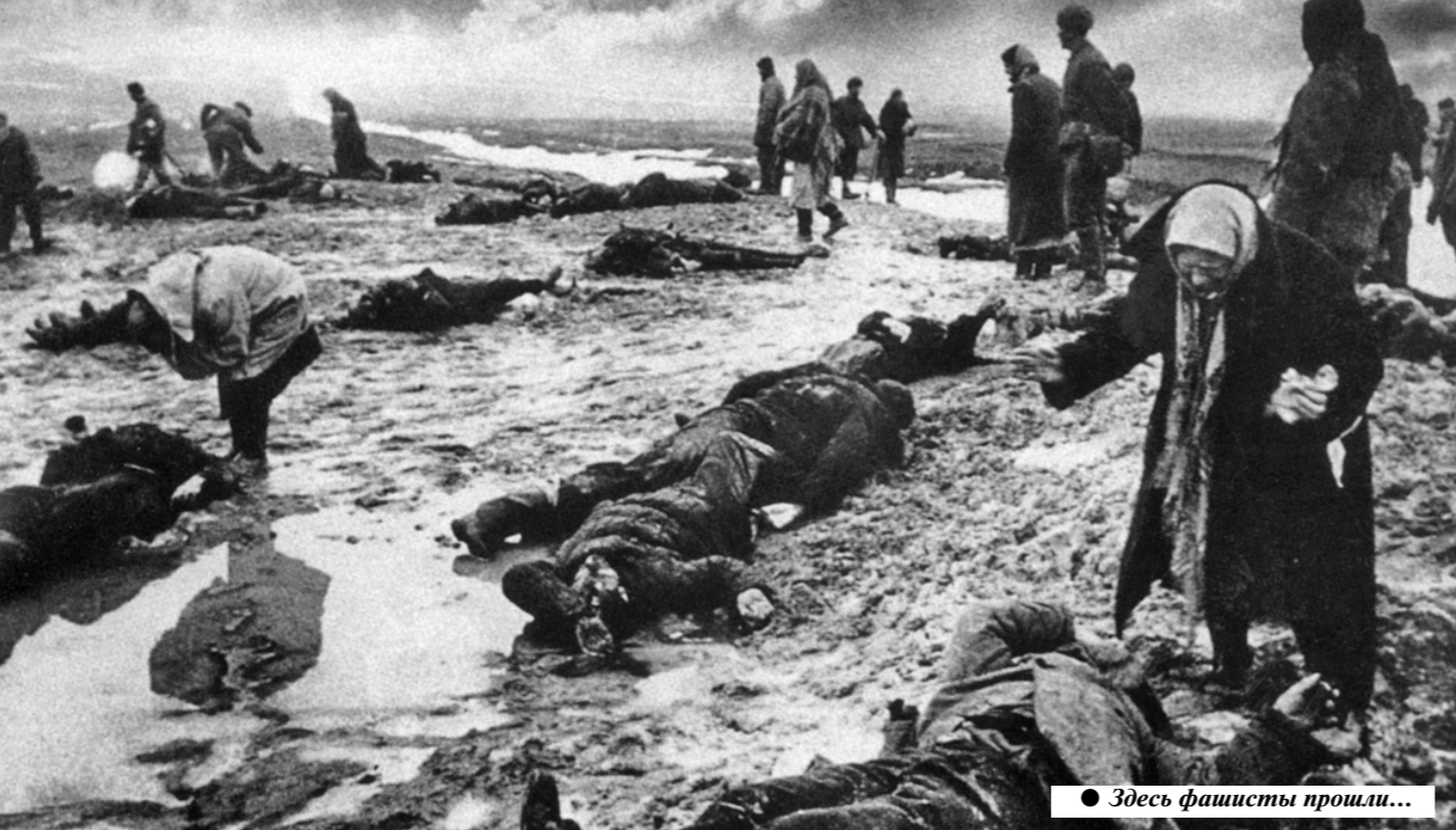
Здесь фашисты прошли...