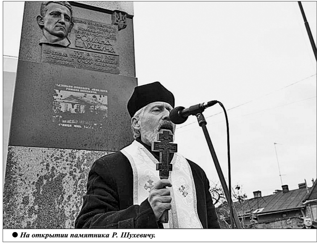
На открытии памятника Р. Шухевичу.