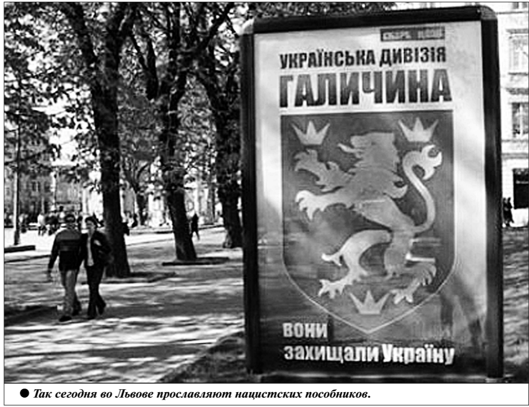
Так сегодня во Львове прославляют нацистских пособников.