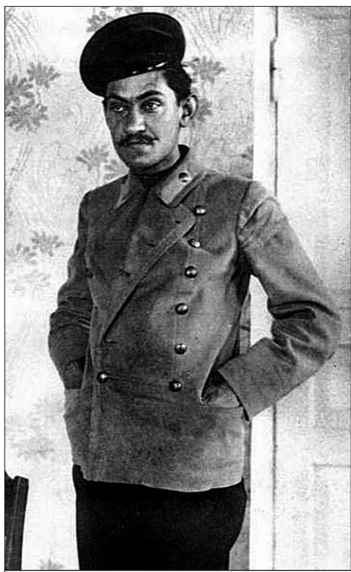
Дмитро (Дмитрий) Иванович Донцов (1883–1973) — основоположник-идеолог и духовный гур украинского национализма, ориентированного на европейскую «расовую гигиену».

Примечательно, что направленность польского нацизма очень напоминает печально знаменитую формулу рейха: «Дранг нах Osten!» Тот же министр внутренних дел Польши М. Блашак призвал вернуть Дворец культуры и науки в Варшаве, так как увидел в сталинской высотке, подаренной правительством Варшавы, «символ российского доминирования». Официальные лица из министерства обороны Польши заявили, что они легко справятся с такой задачей: «Это будут хорошие учения для солдат и прекрасный подарок для всех поляков к столетию независимости страны».