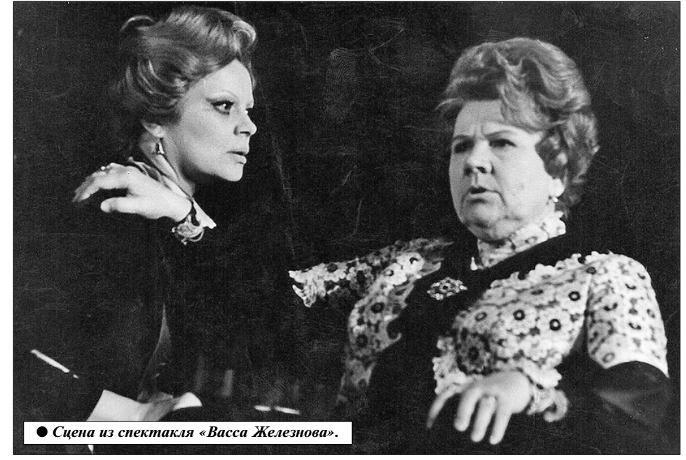
Сцена из спектакля «Васса Железнова».

Учредители — журналистская организация АНО «Редакция газеты «Правда», Коммунистическая партия Российской Федерации