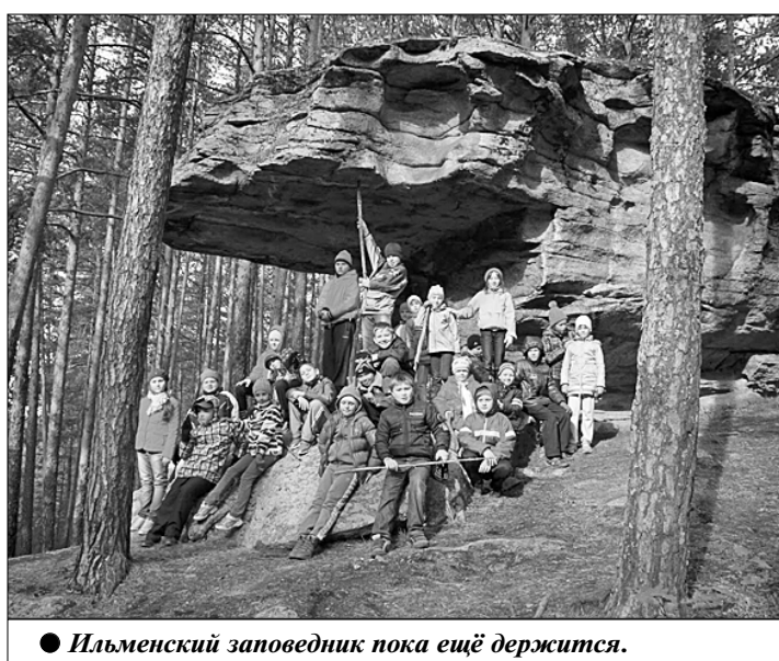
● Ильменский заповедник пока ещё держится.

В последние числа декабря на Госсовете по вопросу «Об экологическом развитии страны в интересах будущих поколений» с основными докладами выступили министр природных ресурсов и экологии страны Сергей Донской и губернатор Челябинской области Борис Дубровский. Такое сочетание весьма любопытно и, на мой взгляд, объясняется не только тем, что именно они возглавляли рабочую группу по данному вопросу.