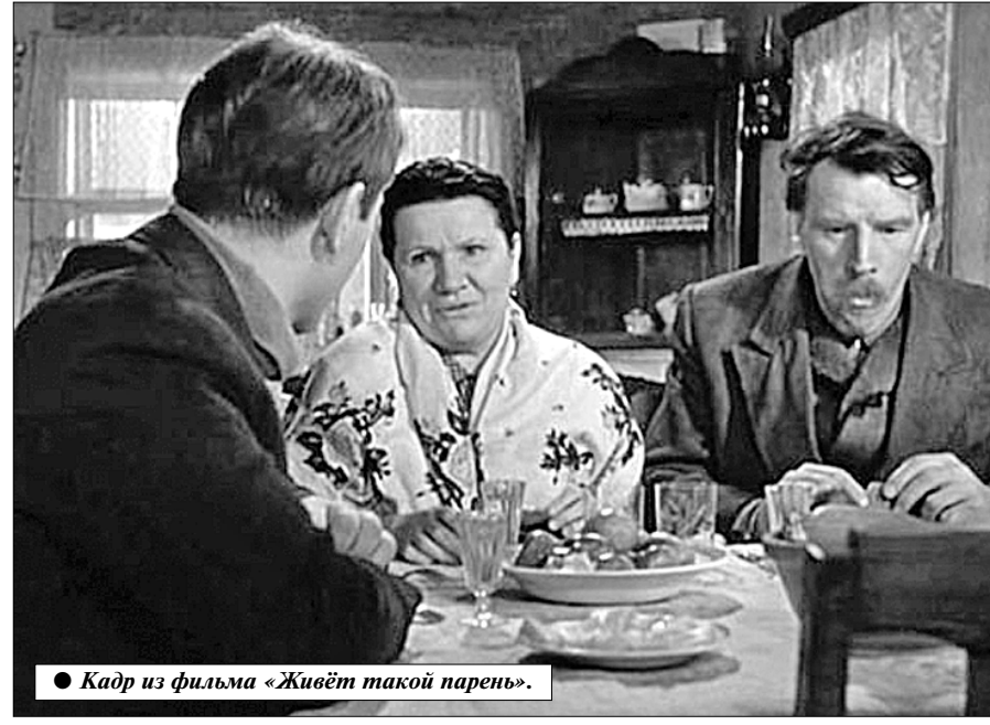
Кадр из фильма «Живёт такой парень».