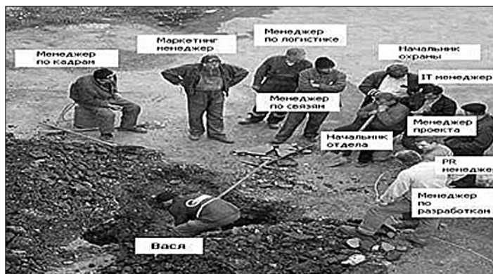
«Один с сошкой — семеро с ложкой».

Напряжённость между богатыми и бедными растёт, и серьёзно ускоряет и обостряет этот процесс объективное ухудшение экономической ситуации в стране. Люди видят разницу в зарплате и доходах. И всё это, конечно, умножает недовольство людей наёмного труда. К неприятию эксплуатации чело-