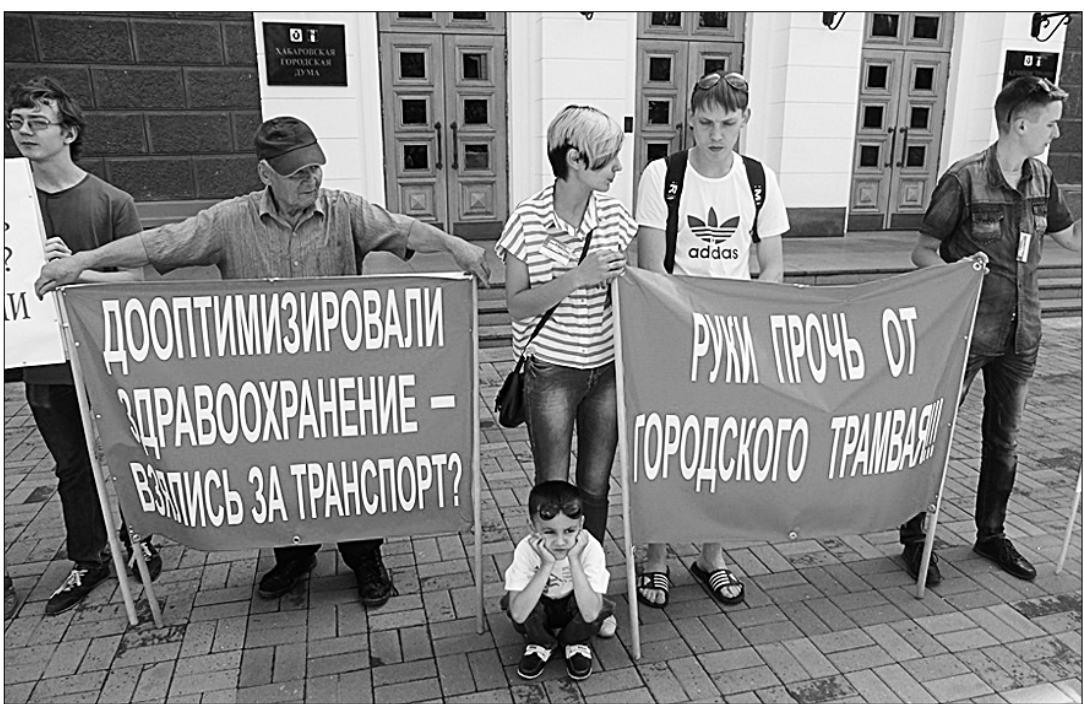
У здания администрации Хабаровска прошёл пикет против губительной реформы городского трамвайного транспорта. В акции протеста приняли участие работники трамвайного депо №2, коммунисты и комсомольцы.

НАКАНУНЕ руководство Хабаровского трамвайно-троллейбусного управления заявило о намерении упразднить депо №2, обслуживающее северную часть города, а также ликвидировать трамвайный маршрут №6. Эти «реформы» руководство муниципального предприятия предложило провести после «монетизации» (по сути дела отмены) льгот на проезд для инвалидов, пенсионеров и многодетных семей, состоявшейся в ноябре 2015 года.