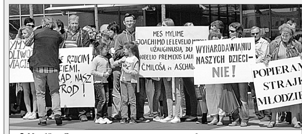
Молодёжь Литвы отстаивает не только свои трудовые права, но и право учиться на родном языке.

вход в здание кабинета министров Литвы. У двери в правительство стояли палатки, установленные на тротуаре и отказались уходить, пока «не будет репрессии власти». Вход в правительство закрыли плакатом «Ремонт уже трётся о кости».