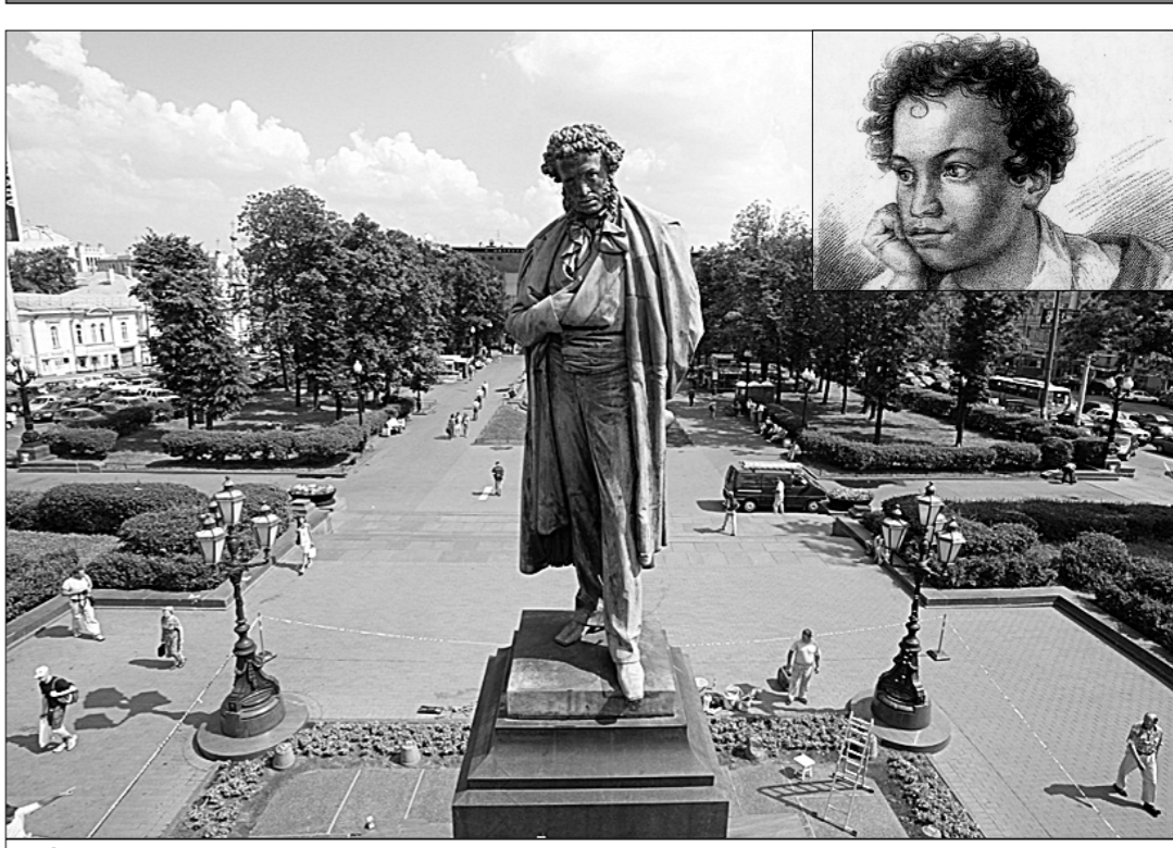
Памятник в Москве.

Слух обо мне пройдёт по всей Руси великой, И назовёт меня всяк сущий в ней язык, И гордый внук славян, и финн, и ныне дикой Тунгус, и друг степей калмык.