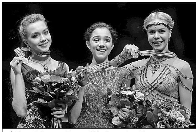
Елена Радионова, Евгения Медведева и Анна Погорялая.

В 2016 ГОДУ мы, конечно, рассчитывали если не улучшить достижения пятнадцатилетней давности, то хотя бы частично повторить их. Однако полностью это удалось только нашим девушкам: Евгения Медведева, Елена Радионова и Анна Погорялая так же, как Ирина Слуцкая, Мария Бутырская и Виктория Волочкова в Братиславе-2001, захватили весь пьедестал. А в общей сложности на минувшем чемпионате россияне завоевали семь наград: две золотых, одну серебряную и четыре бронзовых. Количественный результат вроде бы неплохой (правда, на два медали хуже прошлогоднего) и вполне укладывается в рамки статистики, согласно которой в последнее время на европейских первенствах сборная РФ выигрывает в среднем два «золота», но вот качественный уровень иных выступлений явно оставлял желать лучшего. Ясно одно: на первенстве мира в Бостоне такой прокат уж точно, извините за тавтологию, не прокатит.