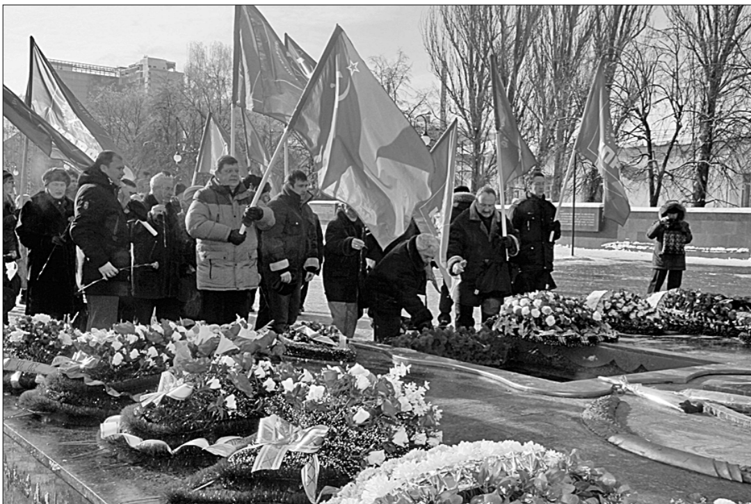
В честь 73-й годовщины освобождения Воронежа от немецко-фашистских захватчиков комсомольцы провели цикл мероприятий.

В 1942—1943 ГОДАХ Воронеж стал непреодолимой преградой на пути фашистов, рвавшихся к Волге. Его пытались уничтожить, стереть с лица земли, но ничто не смогло сломить боевого духа доблестных защитников города.