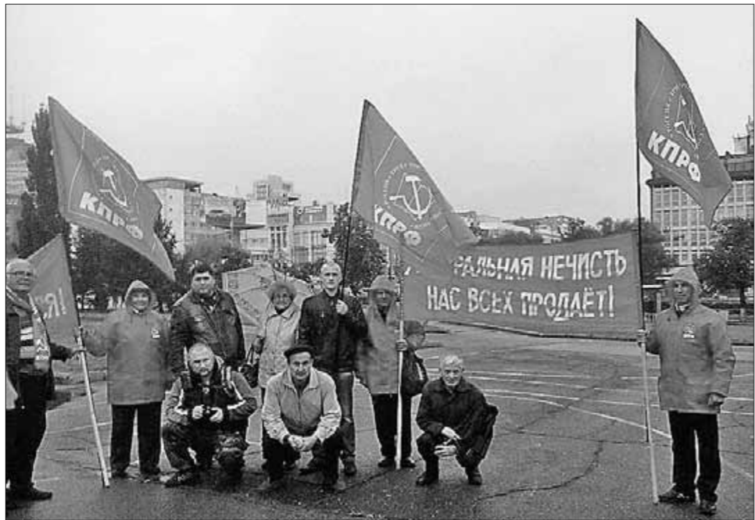
Коммунисты на очередном митинге, состоявшемся в Перми, выступили в защиту прав рабочих Чусовского металлургического завода (ЧМЗ). Поводом для проведения акции явился отказ Объединённой металлургической компании (ОМК) от своего обещания построить современное металлургическое производство на месте снесённых доменного, мартеновского и прокатных цехов.

НЕСМОТЯ на государственный кредит, данный под развёртывание современного электросталеплавленного производства, хозяева ОМК посчитали, что довольно будет и того, что осталось от завода после сноса трёх цехов. При этом их не волнует то, что более пяти тысяч металлургов выкинуты за ворота. На этот раз в рядах митинговавших рядом с пермскими коммунистами стояли коммунисты и рабочие г. Чусового. Секретарь крайкома КПРФ Г. Сторожев назвал три причины сноса ЧМЗ. Это ультралиберальная экономическая политика, проводимая правительством Д. Медведева, за которую его необходимо отправить в отставку. Это неумная алчность «эффективного собственника» — ОМК, ради прибыли в грош не ставящего интересы рабочих предприятия. Выход здесь один — национализация завода. Это, наконец, апатия, пассивность и уход от классовой борьбы за собственные интересы рабочих завода, занывающих выжидательную позицию, провоцирующих своим бездействием нахрапистость обнаглев-