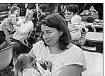
(По сообщениям информгентств подготовила Елена МОРОЗОВА.)

● БУДАПЕШТ. В столице Венгрии кормящие матери устроили акцию протеста в нескольких ресторанах сети «Макдональдс» (на снимке). Их гнев вызвала история молодой венгерки, которой пытались запретить кормление грудью охранник заведения. Он указал устроившейся в «Макдональдс» женщине на то, что точка общепита — не надлежащее место для подобного занятия. Молодая мама поделилась своей историей в «Фейсбуке», спровоцировав тем самым волну протеста. Как тут же заявила сеть «Макдональдс», она не имеет ничего против кормящих матерей.