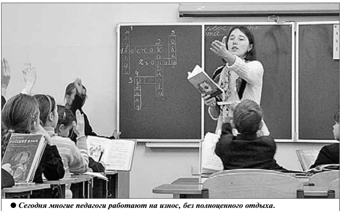
● Сегодня многие педагоги работают на износ, без полноценного отдыха.

Участвовать в акции на данный момент намерены представители около 20 регионов. Активисты профсоюза считают: только солидарный протест всех заинтересованных в качественном образовании сможет заставить власть учитывать интересы педагогического сообщества.