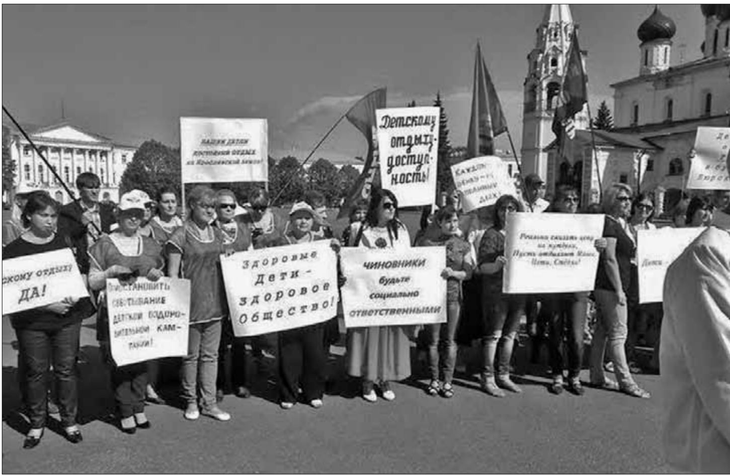
26 мая, перед началом заседания областной Думы, актив профсоюзов Ярославской области вышел на Советскую площадь Ярославля, чтобы заявить о своей позиции по организации летнего оздоровительного отдыха детей.