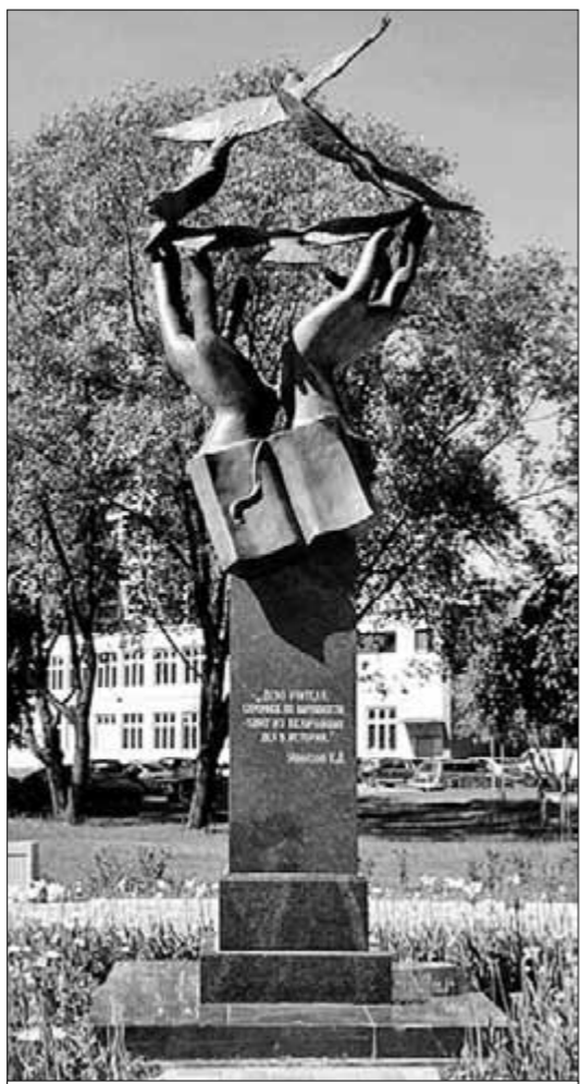
● Памятник Учителю установлен в Санкт-Петербурге на пересечении улиц Учительской и Ушинского. Открыт 5 октября 2010 года, в День учителя. На гранитном постаменте можно увидеть слова выдающегося русского педагога К.Д. Ушинского: «Дело учителя — скромное по наружности — одно из величайших дел в истории».

— Есть ли примеры успешной борьбы родительской общественности, педагогов против закрытия и слияния школ?