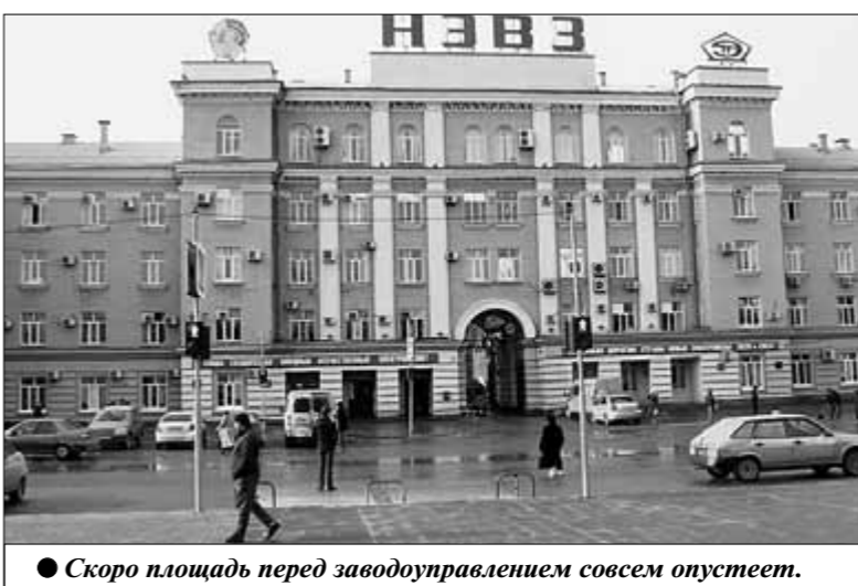
● Скоро площадь перед заводоуправлением совсем опустеет.