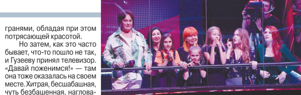
Лариса Гузеева как никогда была близка к провалу. Ее прокляли еще до первой пробы...

Несмотря на долгую, тягучую болезнь, на возраст «суперстар», отлично понимал, что будет сразу после того, как скажет нам последнее прощание.