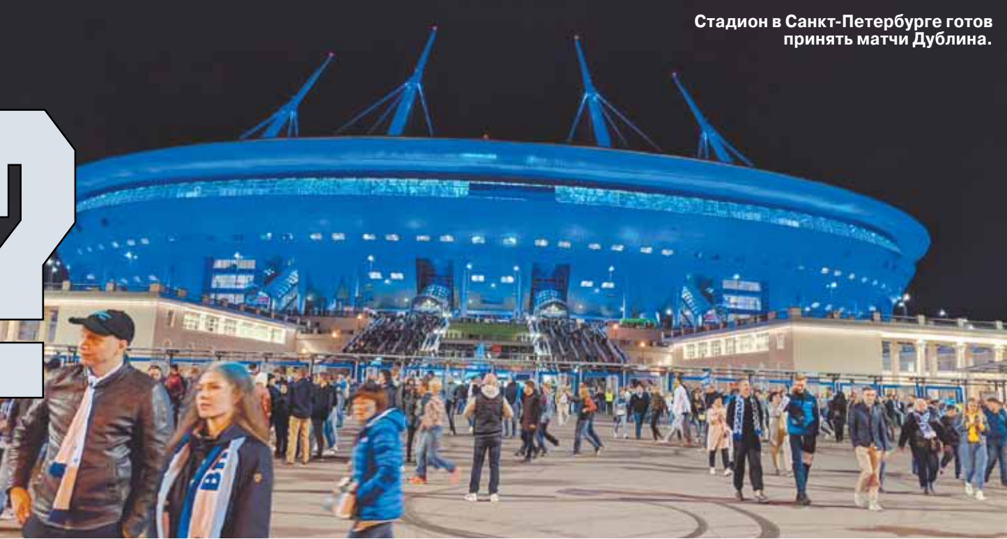
Стадион в Санкт-Петербурге готов принять матчи Дублина.

Половину арены готовы «забить» в Санкт-Петербурге, а также в Баку на «Олимпийском стадионе». Но особенно парадовали УЕФА в Будапеште. «Мы стремимся к тому, чтобы заполнить «Пушкаш Арена» полностью», — заявили в федерации. Стремиться — не значит гарантировать, но уверенность в том, что футбол в Венгрии пройдет со зрителями, есть.