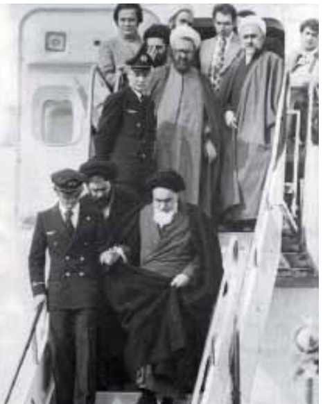
Триумфальное возвращение Имама Хомейни в Тегеран в 1979 году. А вот в России реализовать «иранский сценарий» не удалось.

Настроенный прозападно условный «демократический лагерь» — это в российском обществе самая громкая, но далеко не самая влиятельная политическая сила. Поддержка со стороны Запада и этого «лагеря» обычно компенсируется неприятием со стороны той основной части населения нашей страны, для которой любое вмешательство иностранцев в наши внутренние дела является категорически неприемлемым. Заигрывая «зарубежными партнерами», российский оппозиция лишает себя источника жизненной силы, добровольно превращает себя в легкую добычу для власти.