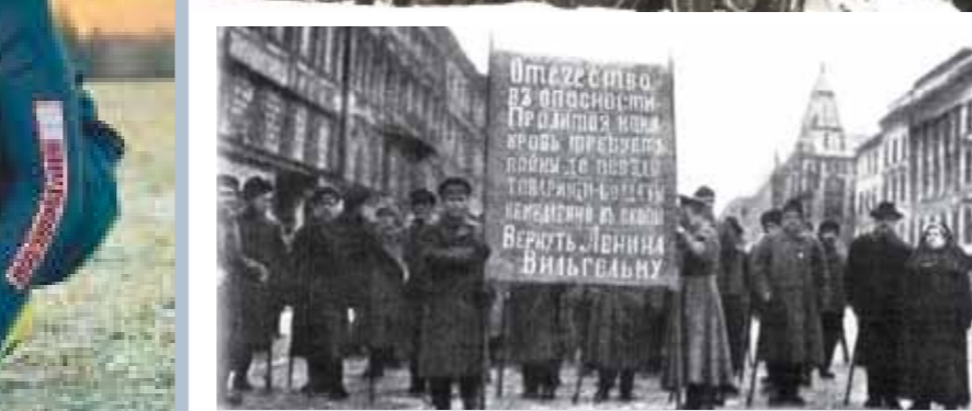
Требование «вернуть Ленина Вильгельму» так и осталось лозунгом, но для Германии вмешательство во внутреннюю политику России обернулось огромными дивидендами.

После оккупации Франции немецкими войсками «нормальная жизнь» в стране продолжалась как ни в чем не бывало.