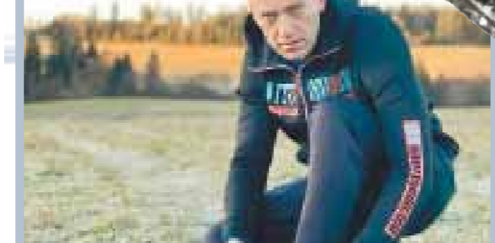
Следующая остановка — Кремль? Пока политический забор с подобным маршрутом у Алексея Навального явно не задался.

сто с небольшим лет, население страны продолжает как минимум терпимо относиться к флирту наших самых разнообразных слуг народа с заграничными интересами? Не свидетельствует ли это, например, о том, что на самом деле патриотизм не является одной из ключевых черт нашего национального самосознания? Нет, самым решительным образом не свидетельствует.