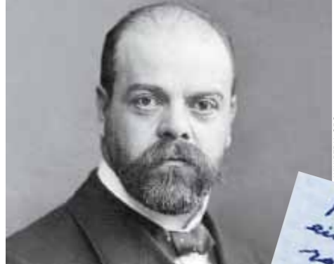
Александр Парвус и выданный им в 1915 году германскому послу в Копенгагене расписка в получении миллиона рублей на потребности революционного движения в России.

Но не надо думать, что использование «помощи» из-за рубежа — это удел только политиков из того лагеря, которого принято называть «демократическим». Вот, например, несколько отрывков из книги известного австрийского историка Элизабет Херш об Александре Парвусе — известном социал-демократе, который в ходе Первой мировой войны предложил германскому правительству использовать в своих интересах российских революционеров. Речь об обстоятельствах возвращения Ленина в Петроград после падения царского режима в 1917 году: «Сначала Парвус направился к германскому послу и объяснил ему, как важен срочный приезд Ленина в Россию, чтобы форсировать ситуацию. Все-таки его девизом, в конце концов, стало заключение мира. Вместе с Лениным Парвус хочет вытащить из Цюриха и Зиновьева...»