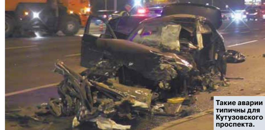
Такие аварии типичны для Кутузовского проспекта.