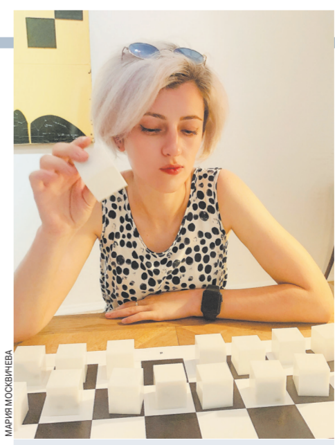
Корреспондент «МК» стал участником арт-партии и превратился из пешки в ферзя.