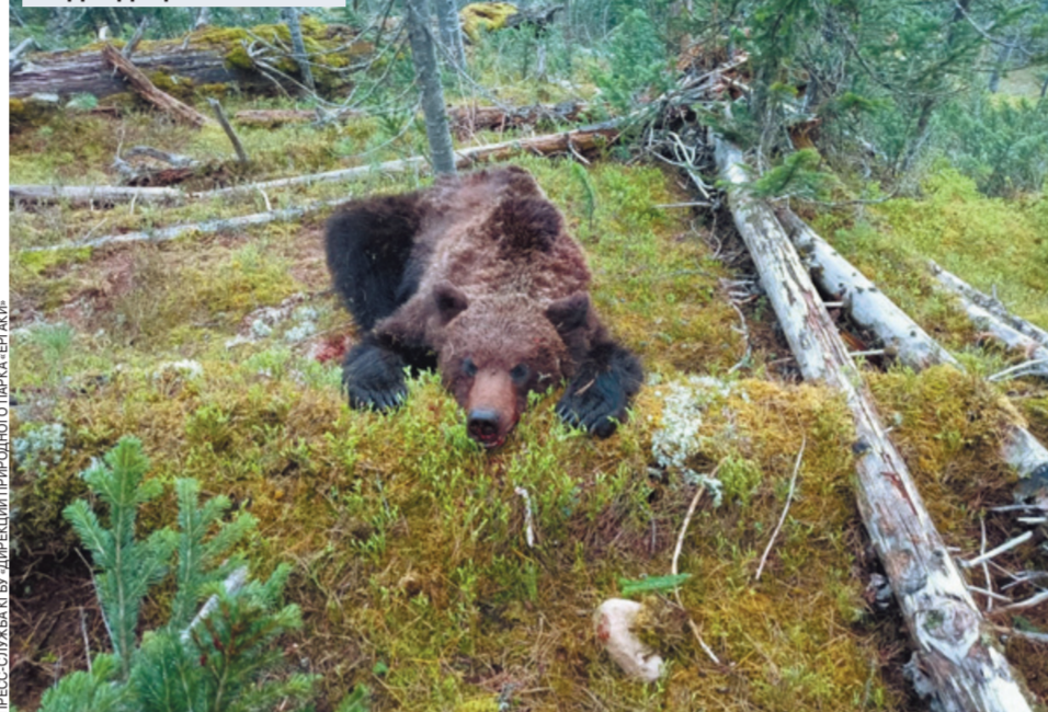
Озеро Светлое. Медведь атаковал туристов в непосредственной близости от него.