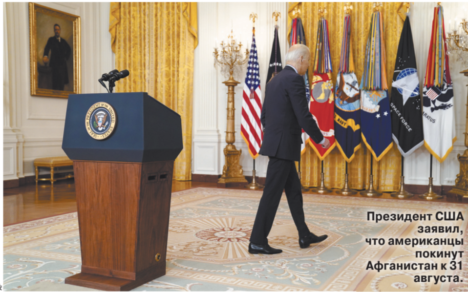
Президент США заявил, что американцы покинут Афганистан к 31 августа.

России, Пакистана и Ирана есть кто-то, кто оказывает материальную и техническую помощь правительству.