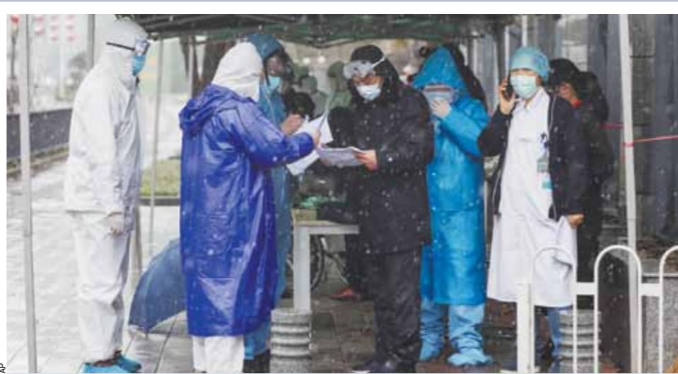
Суд Китая предупредил, что людям, умышленно скрывающим симптомы эпидемии нового типа, может быть вынесен смертный приговор, сообщает издание Beijing Daily. Граждане, заразившиеся заболеванием и утаившие это, будут приговорены не только к тюремному сроку от 10 лет до пожизненного заключения, но и даже к смертной казни. Кроме того, человека могут привлечь к ответственности за искажение информации о состоянии здоровья и сокрытие истории путешествий. Количество заразившихся коронавирусом почти достигло 70 тысяч. Всего от заболевания умерло 1665 человек. На этом снимке: в больнице ожидают прибытия новых пациентов.

Опять сделали КТ. Функция легких почти восстановилась, температура спала. 17 января меня перевели в общее отделение — правда, в одноместную палату.