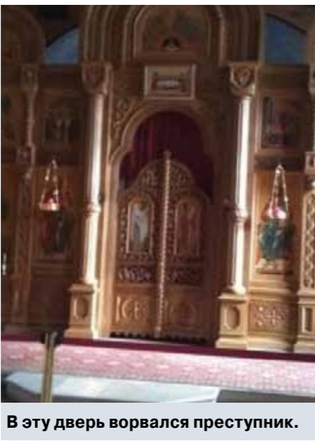
В эту дверь ворвался преступник.