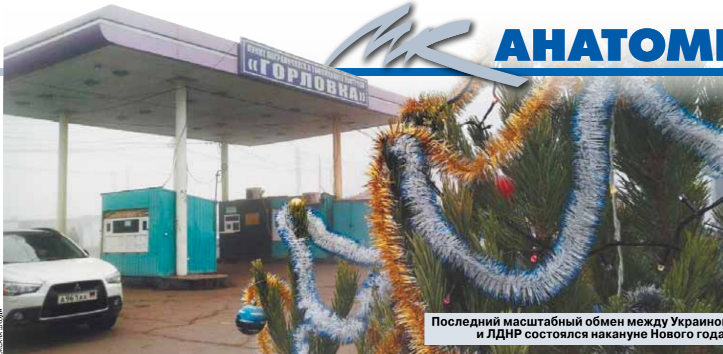
Последний масштабный обмен между Украиной и ЛДНР состоялся накануне Нового года.