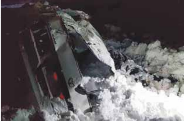
СЛУЖБЕ ПО УПРАВЛЕНИЮ ЧРЕЗВЫЧАЙНЫМИ СИТУАЦИЯМИ В ГРУЗИИ

Сотрудники спасательной службы Грузии обнаружили тело 25-летней россиянки, которая накануне попала под снежную лавину на горнолыжном курорте Гудаури. Ранее сообщалось, что 15 февраля четверо российских туристов спустились с запрещенного участка горы, что привело к образованию лавины. Трех лыжников спасателям удалось вывести в безопасное место, а девушка пропала под снежным завалом. Ее поисками занимались 50 спасателей. Девушку искали всю суббо-