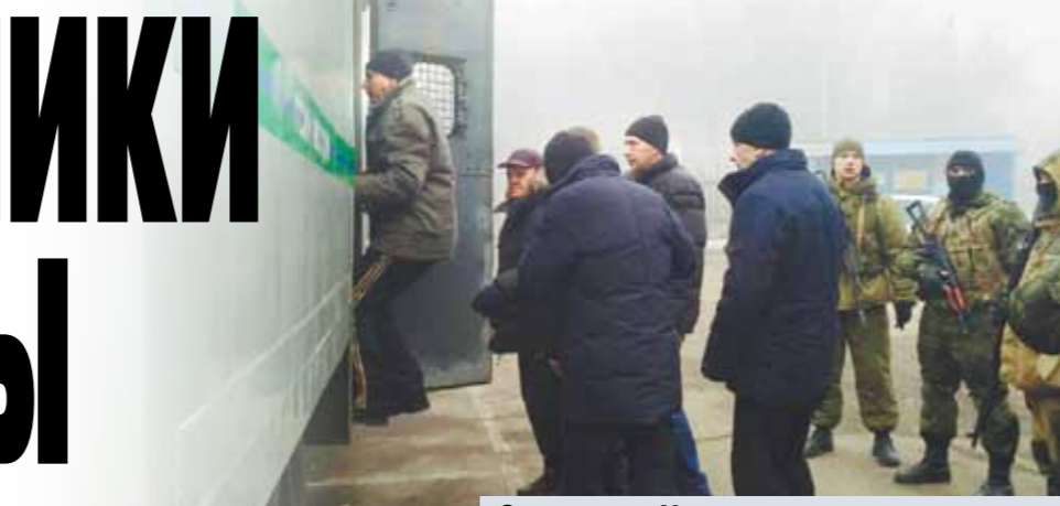
Со стороны Украины на родину вернулись 76 человек, в ЛДНР — 125.

В Донецк после обмена Дарья вернулась вместе со всеми. Никогда прежде здесь не