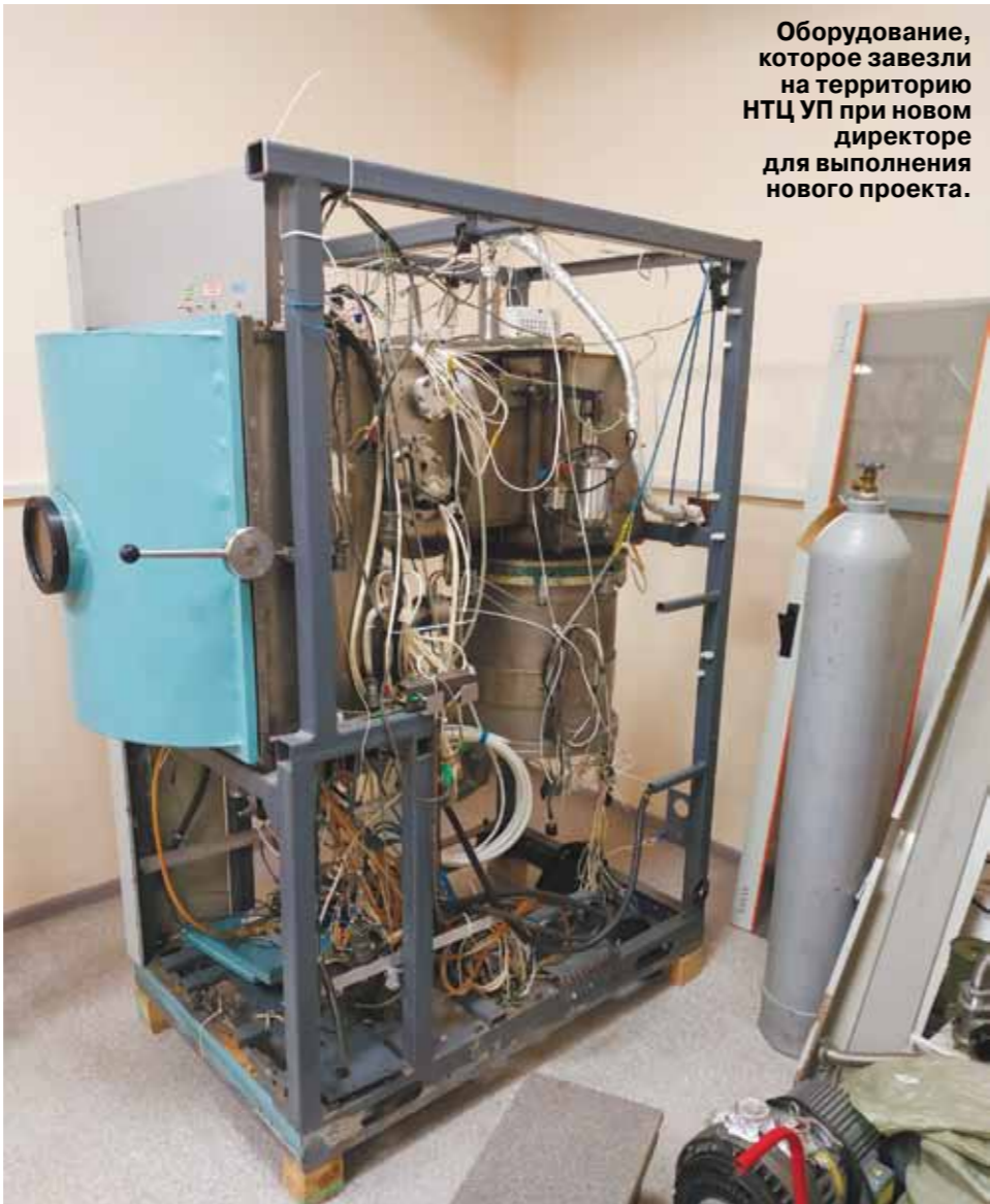
Оборудование, которое завезли на территорию НТЦ УП при новом директоре для выполнения нового проекта.