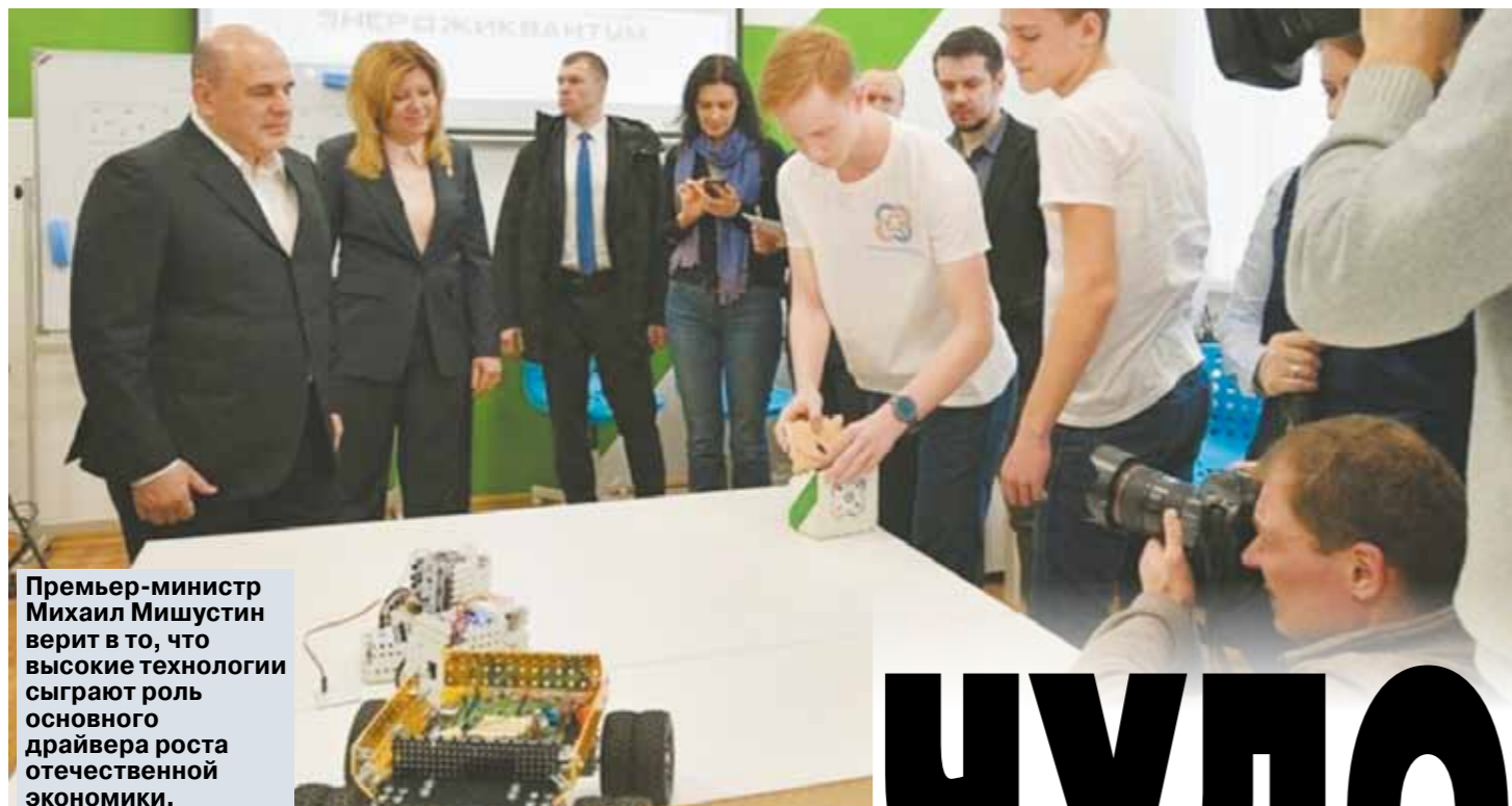
Премьер-министр Михаил Мишустин верит в то, что высокие технологии сыграют роль основного драйвера роста отечественной экономики.

Минэкономразвития уже под руководством нового министра — Максима Решетникова обновило прогноз роста российской экономики. После замедления 2019 года, когда ВВП приподнялся лишь на 1,3% (в 2018-м было 2,5%), должно, наконец, наступить ускорение. В этом году рост прогнозируется на уровне 1,9% (вместо прежних 1,7%), цифра 2021 года оставлена прежней — 3,1%, но она, по мысли прогнозистов, достаточна, чтобы выполнить указание президента и обогнать мировую экономику. Получится ли?