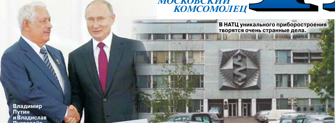
В НАТЦ уникального приборостроения творятся очень странные дела.