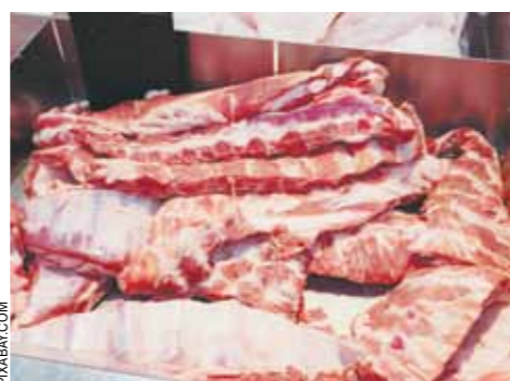
Российским дипломатам надо постараться, чтобы на китайских прилавках появилось отечественное мясо.