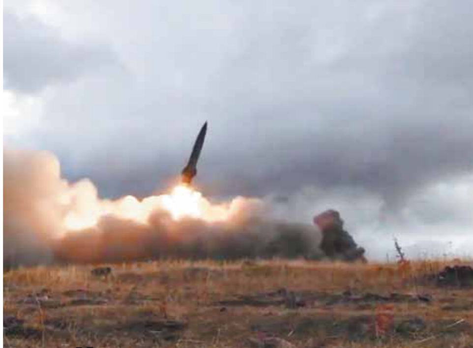
Допустим, что была задействована ракета 48Н6Е2, если у них есть такие боеприпасы. Ею можно ударить, но в этом нет смысла.