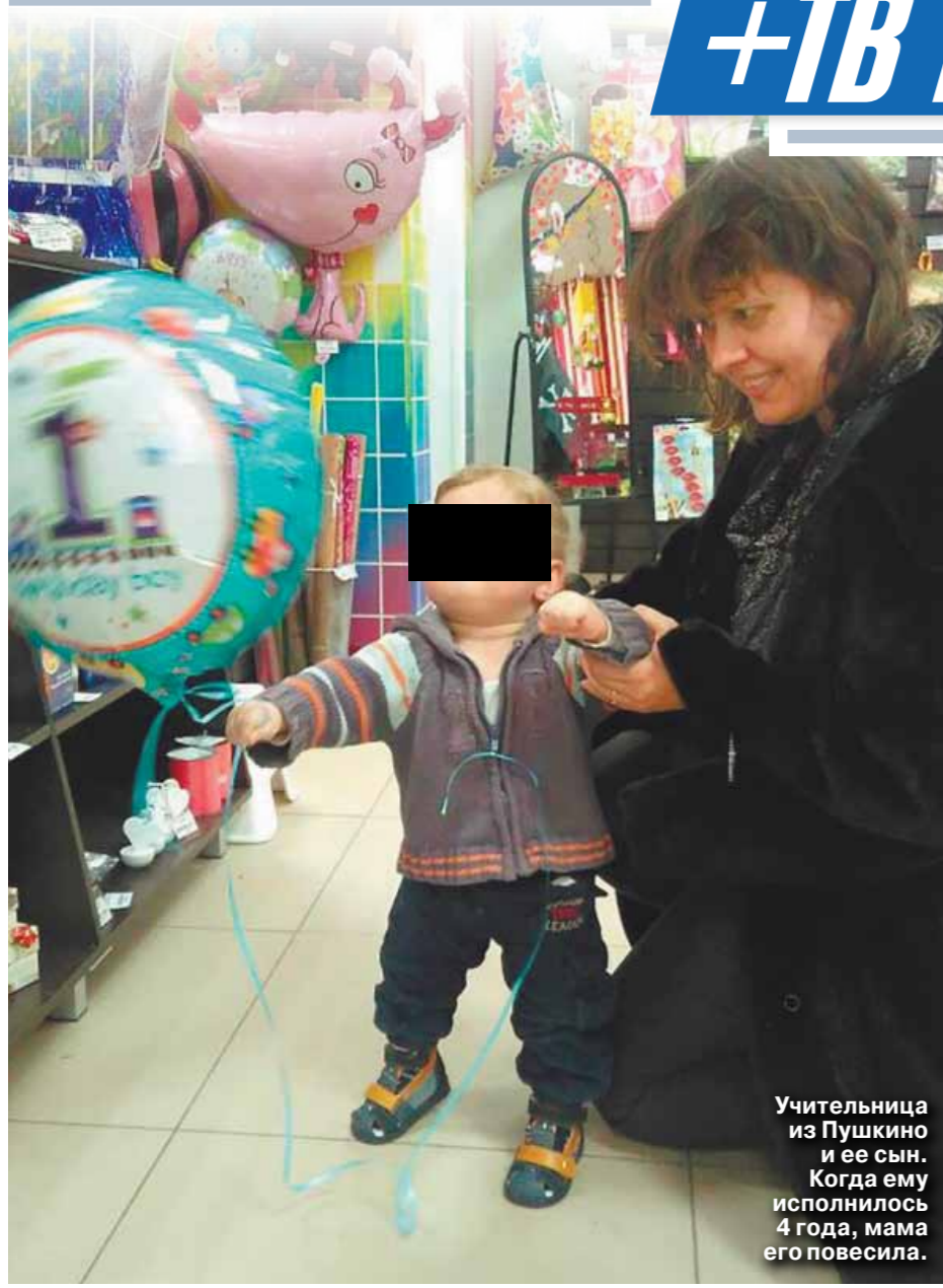
Учительница из Пушкино и ее сын. Когда ему исполнилось 4 года, мама его повесила.