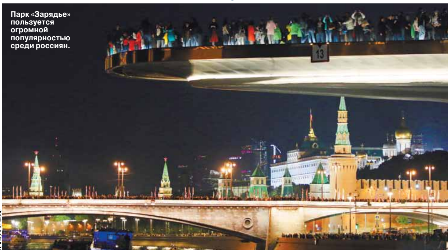
Парк «Зарядье» пользуется огромной популярностью среди россиян.

Десять лет назад москвичи ездили в Европу не только для того, чтобы посмотреть на великие полотна в Лувре и Прадо или побродить по тысячелетним мостовым Рима. Очень для многих желанной целью путешествия было очутиться в европейской городской среде: аккуратные улицы с пешеходными зонами, бесшумный и чистый городской транспорт, раздельный сбор мусора и еще тысячи тех малозаметных на первый взгляд мелочей, которые создают общее впечатление от города, делают его уютным. Однако к концу 2010-х годов оказалось, что практически все, что так влюбляло в себя москвичей там, уже внедрено или внедряется здесь. Современная комфортная городская среда как одна из главных целей развития Москвы — это политика, которая в истории города уже накрепко связана с именем Сергея Собянина, который был утвержден Мосгордумой на должность мэра 21 октября 2010 года. И скачок, который в этом направлении произошел, такого масштаба, что, пожалуй, аналогов ему в истории города попросту нет.