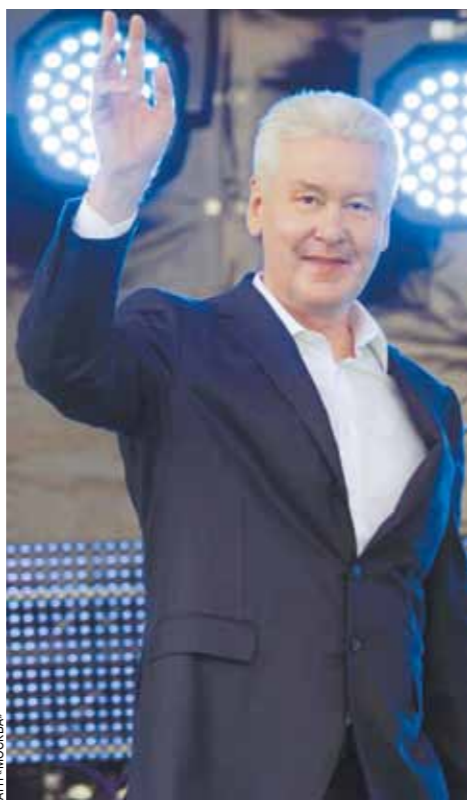
Мэр Москвы Сергей Собянин.

Новая столичная реальность тесно связана с именем Сергея Собянина