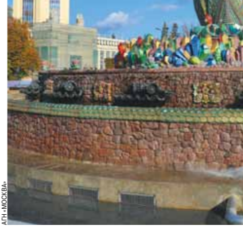
Фонтан «Каменный цветок» на ВДНХ.

Два года назад такой же радостью стало открытие парка на Ходынском поле — бывший аэродром долго оставался пустырем с неясными перспективами. А в 2017 году к своему дню рождения столица получила «Зарядье» — к настоящему моменту в этом парке побывало уже 30 миллионов человек.