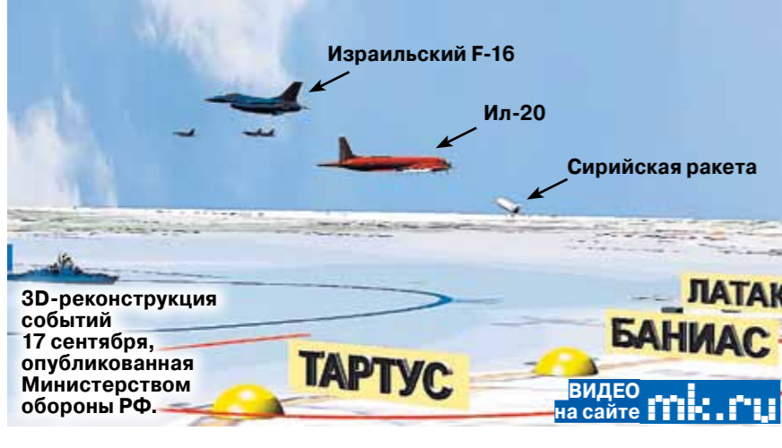
3D-реконструкция событий 17 сентября, опубликованная Министерством обороны РФ.

Минобороны России представило поминутную хронику трагедии