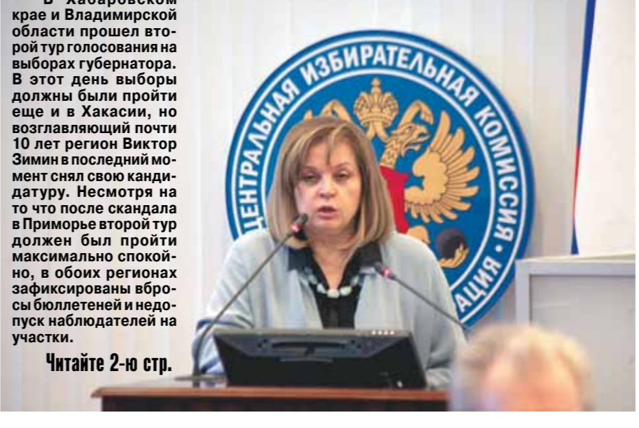
Читайте 2-ю стр.

Эксперт считает, что люди голосуют не за оппозицию, а против действующей власти