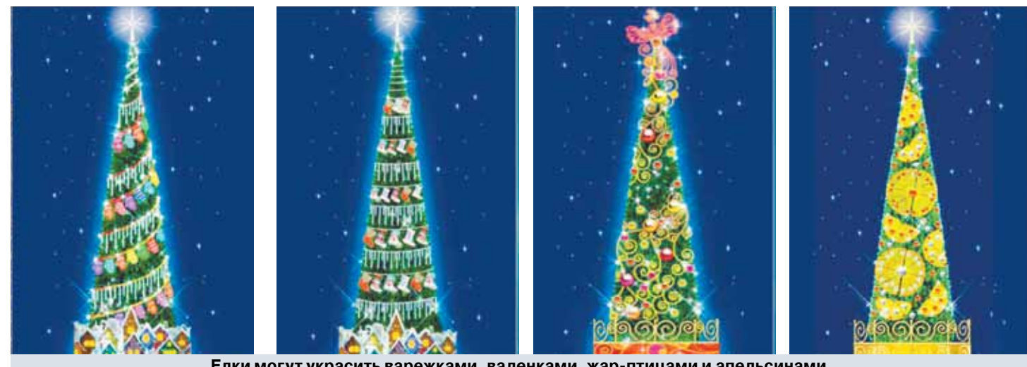
Елки могут украсить варежками, валенками, жар-птицами и апельсинами.