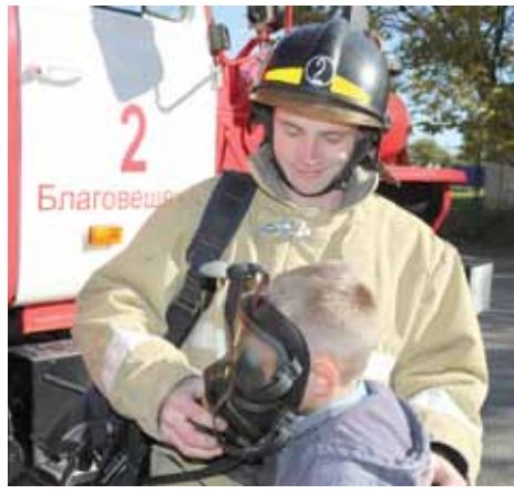
перемещением в районы ликвидации чрезвычайных ситуаций.

Управление силами гражданской обороны осуществлялось более чем с 4,5 тысячи пунктов, развернутых в местах постоянной дислокации, а также с запасных и мобильных подвижных пунктов с их последующим