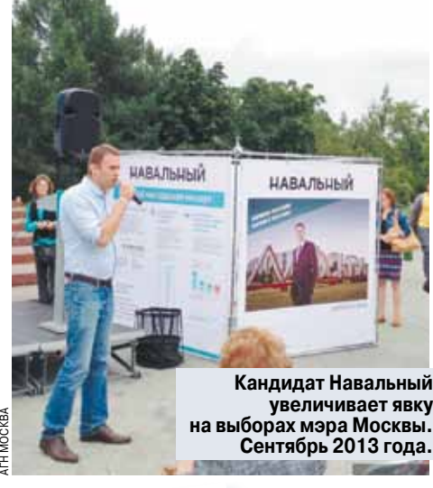
Кандидат Навальный увеличивает явку на выборах мэра Москвы. Сентябрь 2013 года.

Президиум Верховного суда отменил приговор, вынесенный Алексею Навальному по «делу «Кировлеса», согласно которому политик и блогер отбывал условный срок. Сделано это на основании вердикта Европейского суда по правам человека (ЕСПЧ).