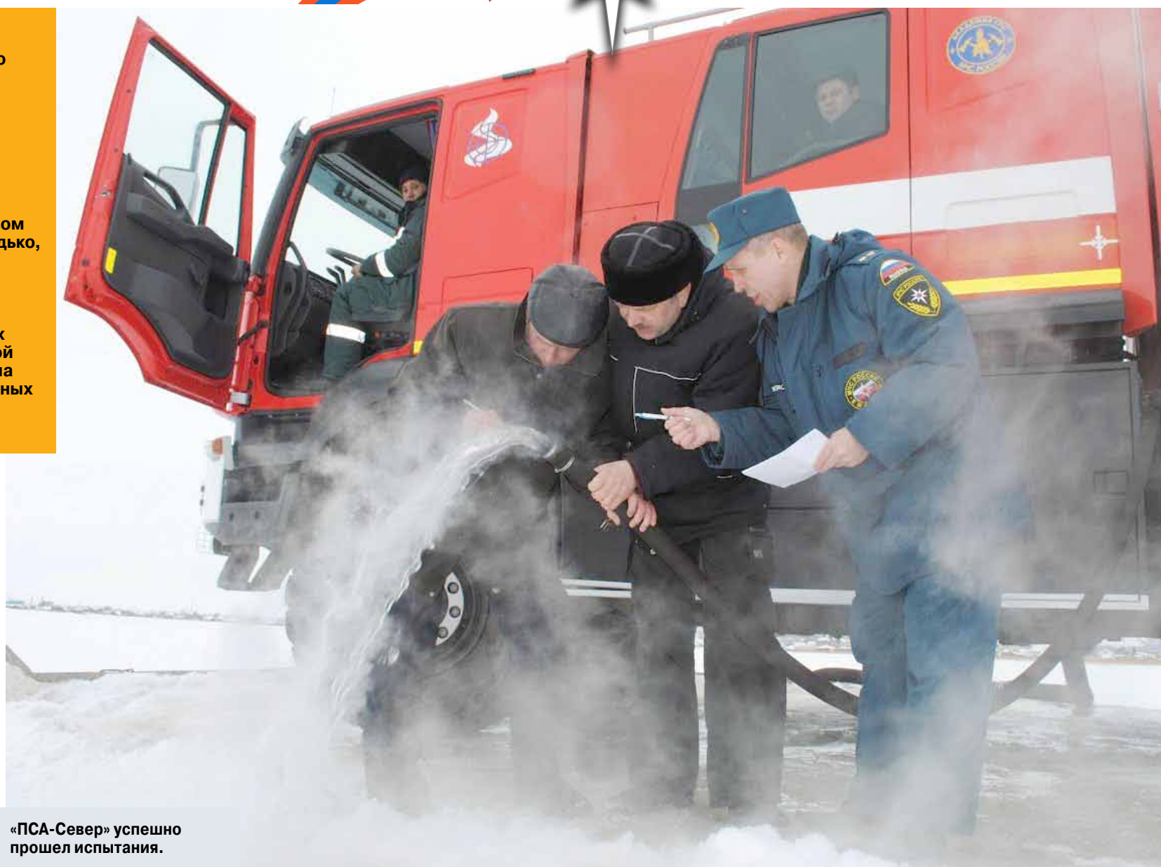
«ПСА-Север» успешно прошел испытания.

Для того чтобы понять, как можно исправить эту ситуацию, ученые АГПС МЧС России провели серьезный анализ всех крупных пожаров, происшедших