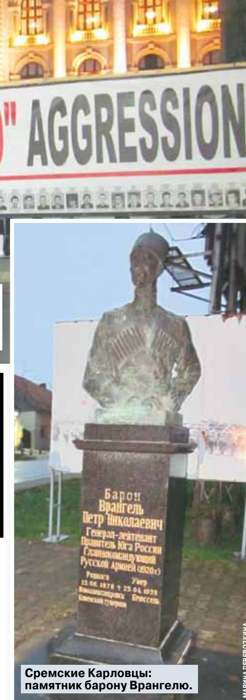
Сремские Карловачи: памятник барону Врангелю.

Фотографии убитых сербов перед зданием Народной Скупщины (парламента) в Белграде.