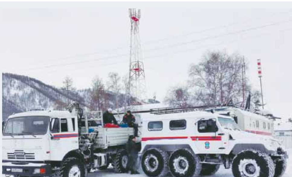
В ту же пятницу спасатели помогли вывезти скот со стоянок, заваленных снегом.

была оказана автобусу с детьми, который не только был заблокирован, но и сам из-за наледи не мог двигаться дальше. Специалисты МЧС России вывели детей на перевал и с помощью специальной техники вывезли автобус, тем самым обеспечив проезд для других автомобилей.