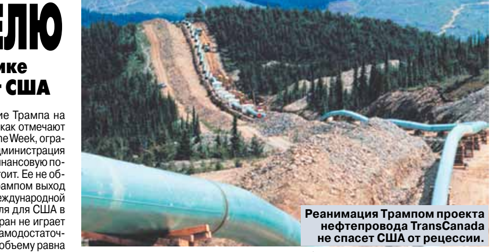
Реанимация Трампом проекта нефтепровода TransCanada не спасет США от рецессии.

Международному уголовному суду (МУС) еще предстоит принять окончательное решение о том, считать ли крымский конфликт международным. И такое решение будет влиять на вердикты по делам о преступлениях, которые происходили на фоне конфликта. Формально Россия и так не являлась государством — участником Международного уголовного суда, однако сотрудничала