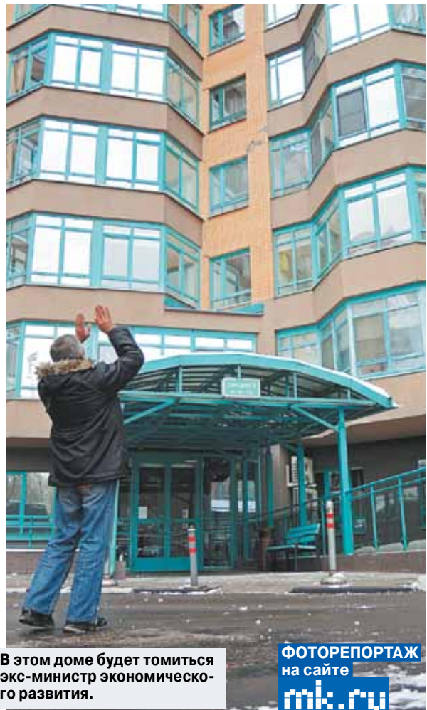
В этом доме будет томиться экс-министр экономического развития. ФОТОРЕПОРТАЖ на сайте mk.ru

«МК» выяснил, как обустраивают квартиру Улюкаева, где он начал отбывать домашний арест