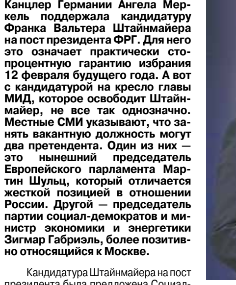
Франк Вальтер Штайнмайер.