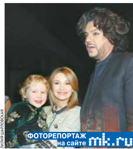
ФОТОРЕПОРТАЖ на сайте mk.ru

— Увидев ленту, могу сказать, что я нашел себе двойника. Нам нужно снять совместный фильм, где мы будем братьями-близнецами. Я чувствовал себя очень странно, ведь с детства на меня смотрели мои большие глаза. Сажая звезды очень похожи! Кстати, песня, которую я исполнил в фильме, написана в стиле рэп. Все думаю, что стиль для меня новый. Ну как же? Я первый на эстраде, кто исполнил рэп в песне «Зайка моя», — подытожил Киркоров.