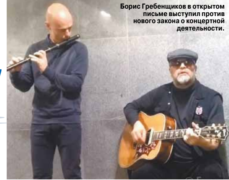
Борис Гребенчиков в открытом письме выступил против нового закона о концертной деятельности.