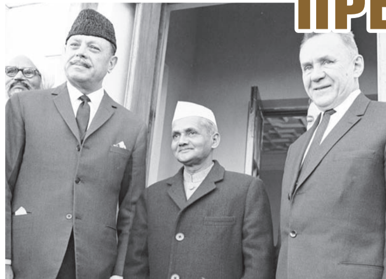
Слева направо: президент Пакистана Айюб Хан, премьер-министр Индии Лал Бахадур Шастри, председатель Совета Министров СССР А.Н. Косыгин