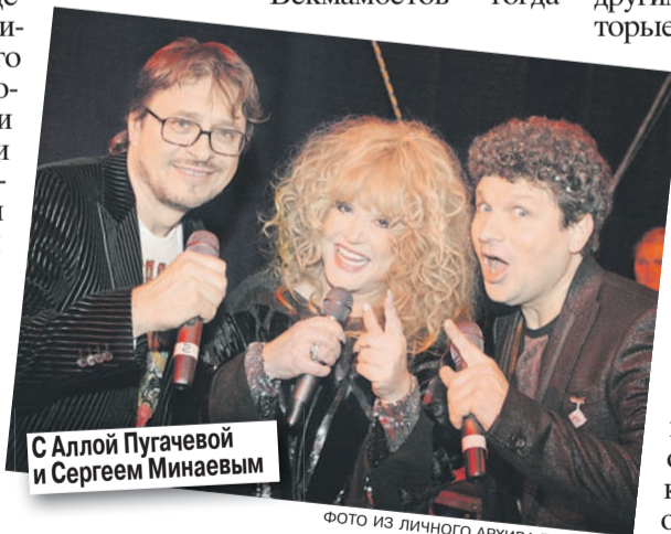
С Аллой Пугачевой и Сергеем Минаевым

Сразу захотелось сделать и видео, чтобы клип полностью был из документальных кадров. Мы скрупулезно выбирали материал из Гусфильмофонда, ювелирно монтировали. На монтаже Тимур Бекмамбетов - тогда