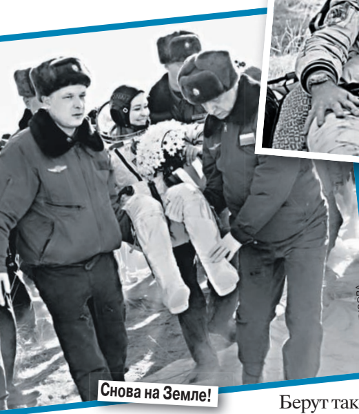
Снова на Земле!

идеально выглядишь. Ты прекрасно там засыпаешь. У нас в фильме есть такая фраза: «Час в космосе - как два на земле». Это абсолютная правда! Я там за четыре часа прекрасно выспалась. Мне очень понравилось.