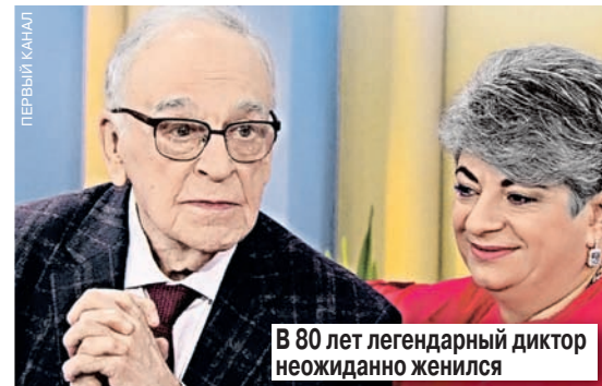
В 80 лет легендарный диктор неожиданно женился