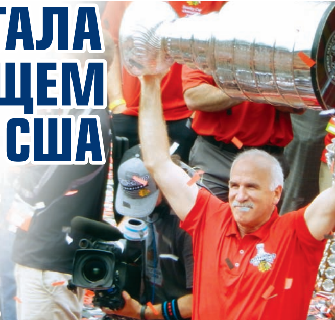
Джоэля Кенневилля вынудили покинуть НХЛ

А вы не задавались вопросом, почему киберспорт называется спортом? И не заметили ли он традиционные виды спорта?