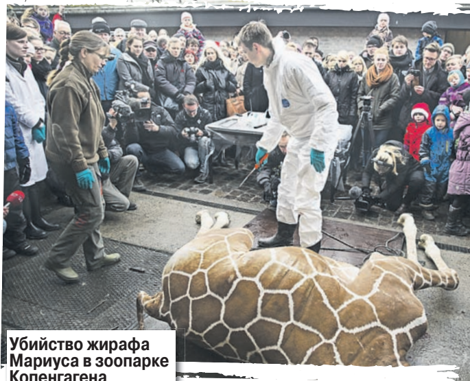
Убийство жирафа Мариуса в зоопарке Копенгагена

ных в так называемых образовательных целях. Через месяц после резонансного зверского убийства Мариуса в Копенгагенском зоопарке подвергли эвтаназии двух старых львов и двух 10-месячных львят. У них, как сказал директор зоопарка, не было шансов выжить - новый сильный самец, которого должны были привезти, все равно уничтожил бы их. Решено было расчистить гостю поле для создания нового прайда.