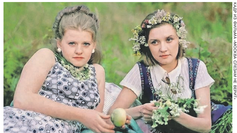
КАДР ИЗ ФИЛЬМА «МОСКВА СЛЕЗАМ НЕ ВЕРИТ»

Большая семья - это большое счастье! Я сейчас задумалась, потому что даже не представляю, сколько у меня будет внуков... Самое главное, чтобы все наши дети выросли достойными людьми. А мы с мужем попытаемся им в этом помочь, сделаем все, что от нас зависит.