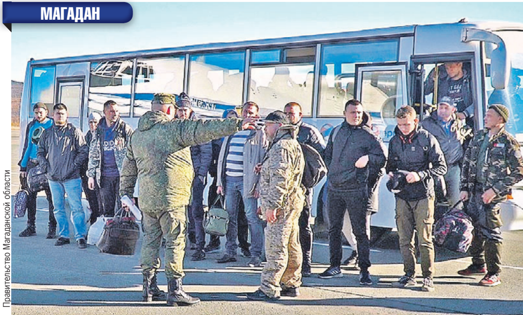
Правительство Магаданской области

Пока мобилизованные выполняют задачи спецоперации, их семьи освободят от трат за ЖКХ.