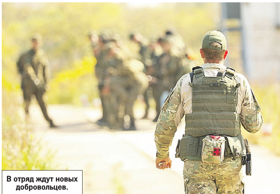
В отряд ждут новых добровольцев.