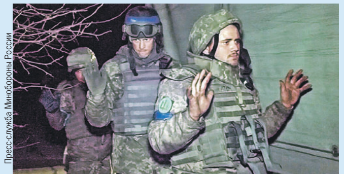
Солдаты ВСУ не очень хотят воевать и при случае сдаются. Эту ситуацию просто надо дожимать.

- Единственная возможная мера установления мира - освободить Украину от националистов. Западенцев придется приучить к мысли, что для них все потеряно, они ничего не понимают, кроме силы.