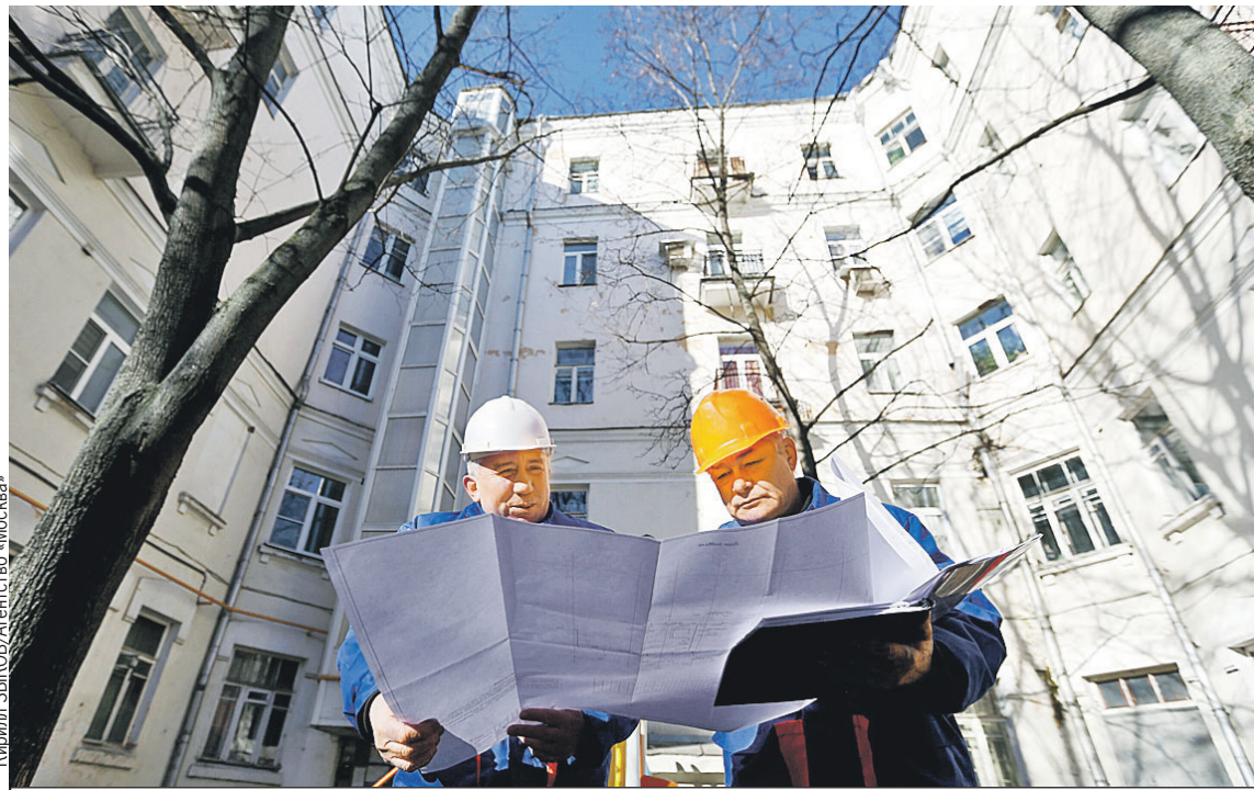
Специалисты жилищной инспекции будут тщательнее следить за качеством ремонта домов. Будем надеяться, что крыши и трубы станут протекать реже.

2022 года, формула расчетов привязана к ключевой ставке Центробанка. Но 28 февраля ставка взлетела аж до 20% годовых. И получалось, что пени за здорово живешь вдруг в одночасье выросли почти вдвое (до этого ставка была 9,5%). Граждан решили все же пожалеть, и ставку для расчетов пени зафиксировали на уровне 9,5% (как было на 27 февраля). Но в итоге опять получилось плохо. Ставка в течение года постепенно понижалась, сейчас она уже 7,5%, а пени рассчитываются исходя из 9,5%. И теперь утверждена новая схема, которая будет действовать до конца этого года: в расчетах применяется та ставка, которая меньше, - либо 9,5%, либо действующая сегодня (см. «Напоминалку» «КП»).