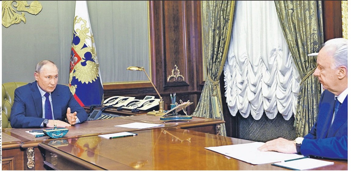
Перед тем как на Украину обрушился удар возмездия, Владимир Путин заслушал доклад главы СК Александра Бастрыкина о расследовании теракта на Крымском мосту.

- Сегодня утром нанесен массированный удар высокоточным оружием большой дальности воздушного, морского и наземного базирования по объектам энергетики, военного управления и связи Украины... В случае продолжения попыток проведения на нашей территории терактов ответы со стороны России будут жесткими и по своим масштабам будут соответствовать уровню угроз, создаваемых Россией. Ни у кого не должно быть никаких в этом сомнений, - пообещал Путин.