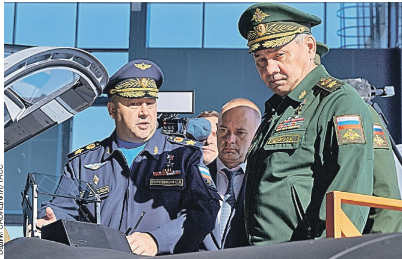
5 лет назад Сергей Суровикин (слева) возглавил Воздушно-космические силы, и ему было что показать главе Минобороны Сергею Шойгу.

После прямого, решительного и успешного участия в кампании в Сирийской Арабской Республике генерал Суровикин был назначен главкомандующим ВКС - Воздушно-космическими силами России. С этой должности Сергея Владимировича откомандировали на Украину, где он