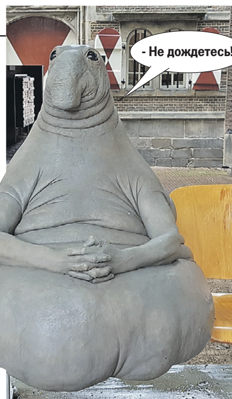
Оригинальный Ждун так и сидит в холле медицинского центра Лейденского университета в Нидерландах.