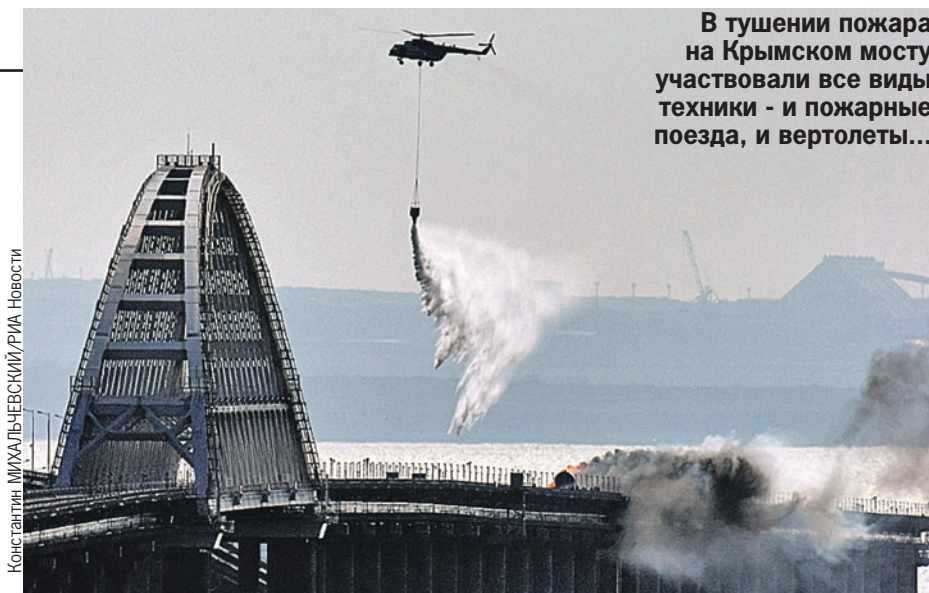
В тушении пожара на Крымском мосту участвовали все виды техники - и пожарные поезда, и вертолеты...

Два пролета автодорожного полотна повреждены, по оставшимся около 16.00 в субботу начато организованное реверсивное движение личного автотранспорта и грузовых