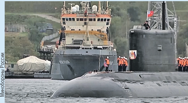
Во Владивосток подлодка прибыла из Санкт-Петербурга.

Для флота это третья дизель-электрическая подводная лодка, которая может нести высокоточные крылатые ракеты «Калибр».