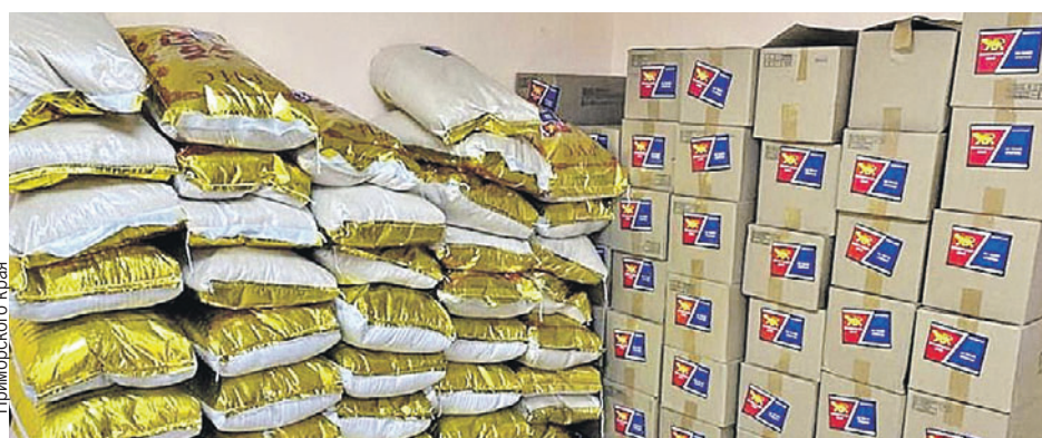
Гуманитарную помощь собирали приморские коммерческие компании.