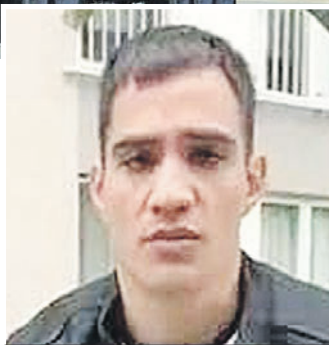
А это владелец красной фуры.

- Раньше он работал на бензовозе в Казани. Попал