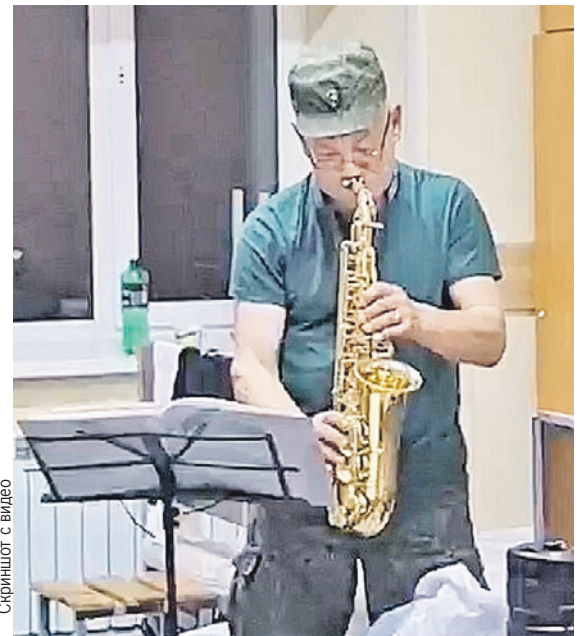
Скриншот с видео

...А в 2009 году ушел в отставку. К этому мо-