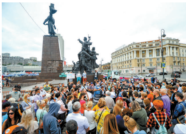
Один из митингов во Владивостоке, собравший около 200 участников.

Тем не менее после акции в отделы полиции в разные дни доставляли по несколько человек, которых подозревали в организации мероприятия. В основном тех, кто демонстрировал какие-то плакаты, сканди-