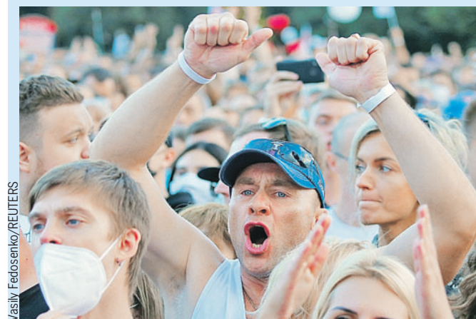
В Минске тысячи людей пришли поддержать кандидатов, оппозиционных действующему президенту страны.

В Минске арестованы россияне, которых обвинили в намерении побуждать перед выборами президента, - и это на фоне митингов оппозиции (читайте свежие подробности на стр. 10 - 11). И мы спросили: