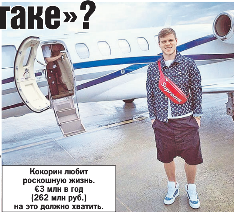
Кокорин любит роскошную жизнь. €3 млн в год (262 млн руб.) на это должно хватить.

Окончание. Начало на < стр. 1. За Кокориным выстроилась целая очередь с предложениями контрактов. Но аукцион выиграл владелец «Спартака» Леонид Федун.