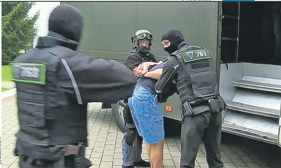
Три десятка российских граждан в санатории под Минском задерживали жестко - как потенциальных «боевиков», хотя они должны были охранять объекты за океаном.

37-летняя домохозяйка, родившаяся под Брестом, жена арестованного блогера Сергея Тихановского, желавшего участвовать в выборах президента Белоруссии, сегодня Светлана Тихановская - сама претендент на главный пост в стране и собирает многотысячные митинги. Она окончила школу с золотой медалью, в совершенстве владеет английским и немецким, занимается благотворительностью (помощь чернобыльцам).