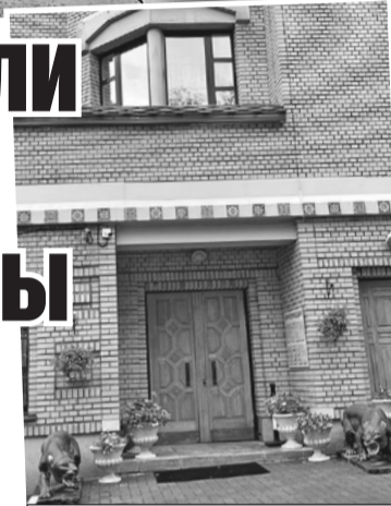
Квартира звезды находится в самом центре столицы, в элитном ЖК.

«Комсомолка» будет следить за ситуацией.