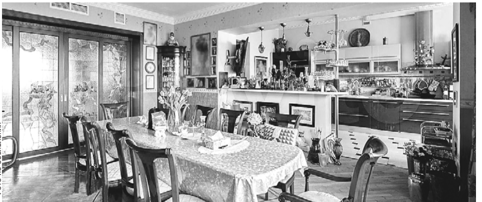
Недвижимость была выставлена на продажу в мае за 130 млн руб.