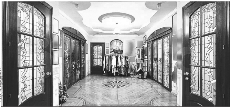
Общая площадь - 236 квадратных метров.