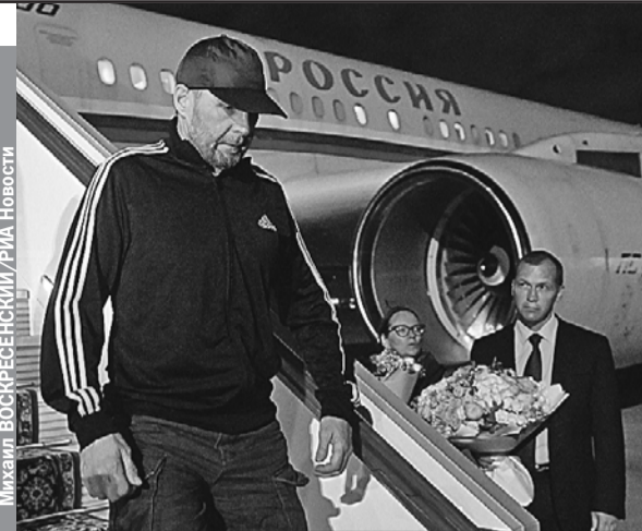
Вадима Красикова, вызволенного из ФРГ, называют ключевой фигурой обмена.

А еще известно, что Красиков молчал. Он не признал вину, не сотрудничал с немецким следствием, не просил о помиловании или снисхождении. А ведь его наверняка «кололи». Даже ломали, добиваясь признания в связях с российскими спецслуж-