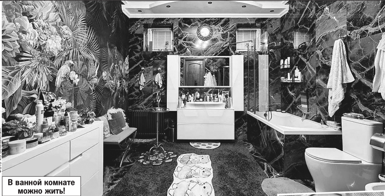
В ванной комнате можно жить!

Дельцы каким-то образом смогли достать старое видео, на котором, предположительно, Лариса Долина показывает паспорт, мол, это она. Вероятно, звезда дистанционно подтверждала свою личность для заказчика выступлений. Именно этот ролик аферисты использовали, когда брали задатки с желающих приобрести квартиру певицы. Дело в том, что по закону соб-