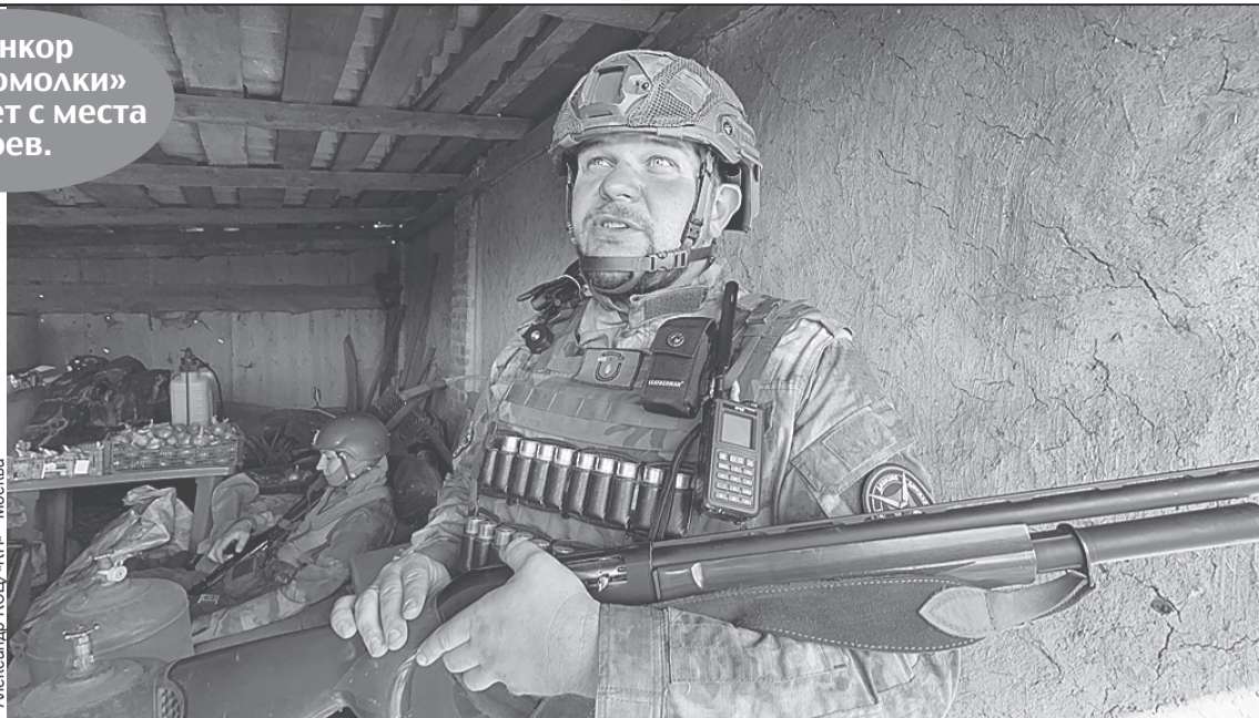
Вообще-то боец с позывным «Связист» отвечает в «Пятнашке» за связь. Но его огромное ружье - это еще и гроза всех вражеских дронов.

- Свою линию мы сейчас стабилизировали, наши парни никуда не сдвинутся, - уверяет «Близнец». - Вы же