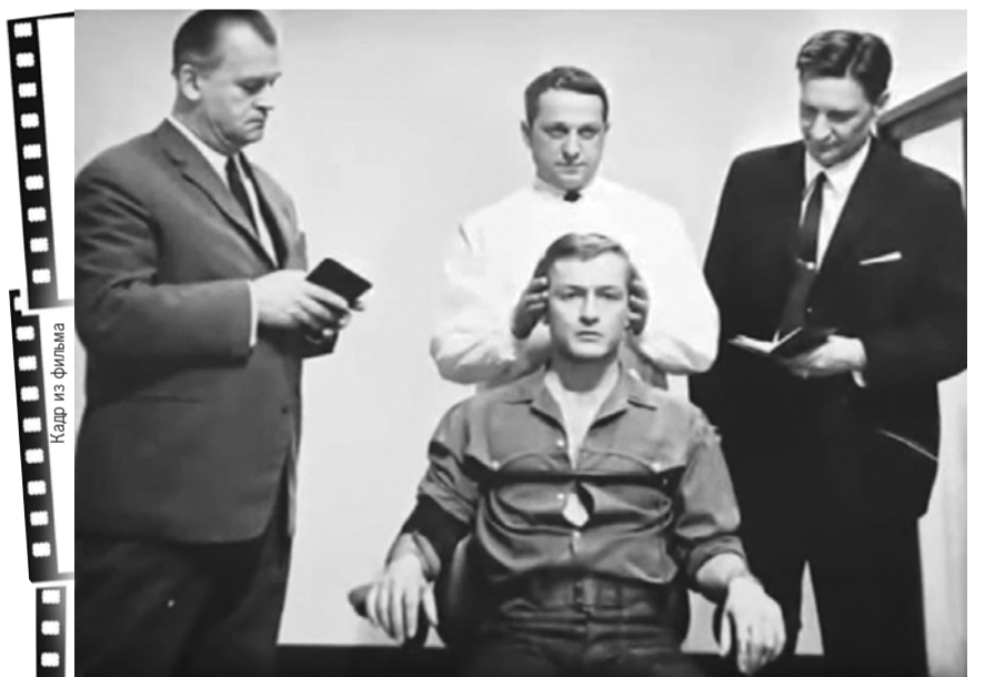
Кадр из знаменитого фильма «Ошибка резидента», где советскому разведчику (его сыграл Михаил Ножкин) на Западе устраивают психологическую проверку.