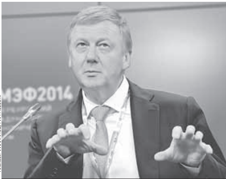
Анатолий Чубайс и его команда стали заниматься инвестициями и нанотехнологиями, не имея представления о том, как все это работает. Отсюда и такое количество провалов.