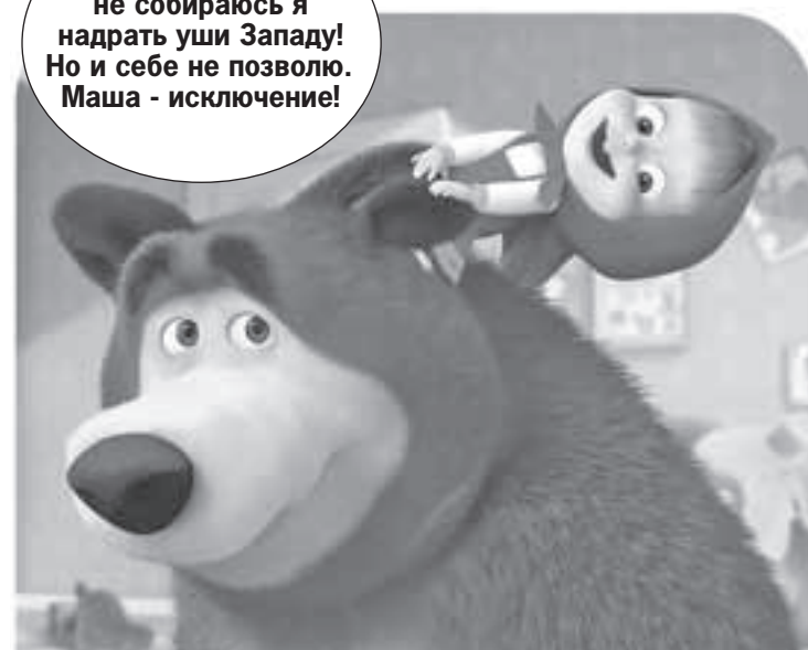
Кадр из мультфильма

- Зря испугались: не собираюсь я надрать уши Западу! Но и себе не позволю. Маша - исключение!