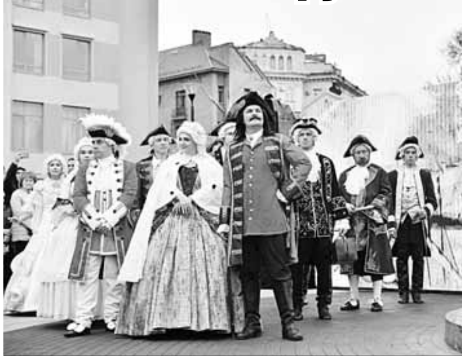
В честь открытия памятника было организовано театрализованное представление.