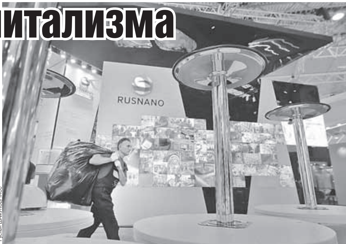
Конечно, были у «Роснано» и успехи. Но провалов - гораздо больше. В результате сотни миллиардов рублей были просто выброшены на помойку.