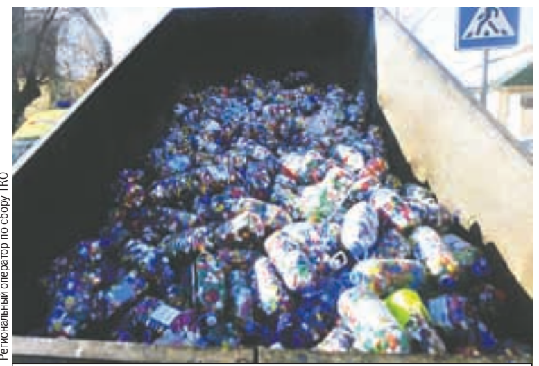
Региональный оператор по сбору ТКО

С 16 мая совместно с компанией-переработчиком начнется вывоз накопленной макулатуры, затем она будет взвешена и передана на производство. Учащиеся школы, которая соберет в рамках акции больше всех вторсырья, смогут посетить муниципальный приют и принять участие в передаче корма животным.