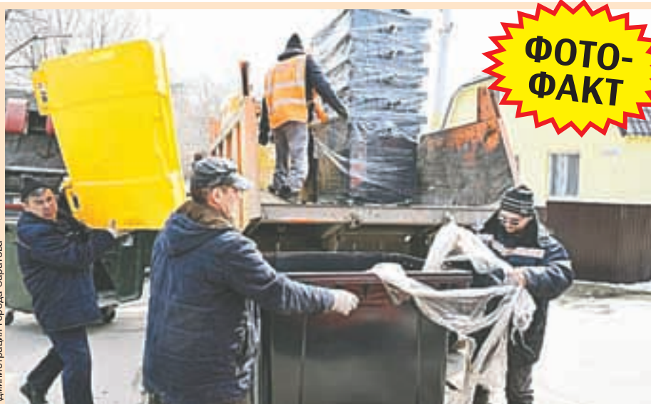
Администрация города Саратова

Действующий пункт приема вторсырья находится в городе Энгельсе, на улице Красноярской, 2. Он работает ежедневно с 8.00 до 20.00. С перечнем принимаемых видов вторсырья, правилами их приема и стоимостью можно ознакомиться в самом пункте, по ссылке https://citymatic.ru/vtormatik.html или позвонив по телефону: 8 (8452) 25-64-90, доб. 7550.