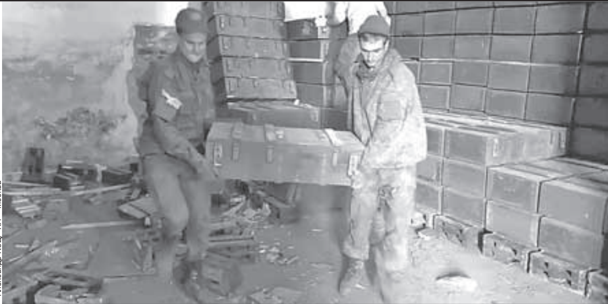
Александр КОЦ «КП» - Москва

Тысячи тонн снарядов и мин оказались очень кстати для ведения спецоперации.