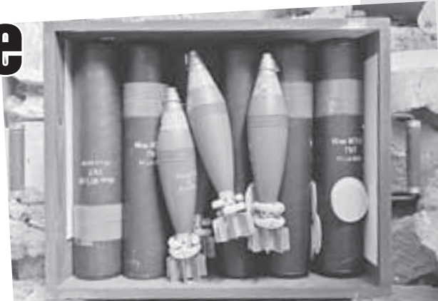
Александр КОЦ «КП» - Москва

Бросив под Харьковом эти тысячи тонн боеприпасов, Киев значительно упростил здесь жизнь Российской армии. А вот украинские войска теперь вынуждены просить снаряды у своих друзей с Запада.