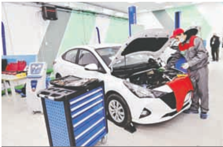
Современная материальная база образовательных учреждений - залог качественного обучения.

- Ушедший год выдался непростым, в первую оче-