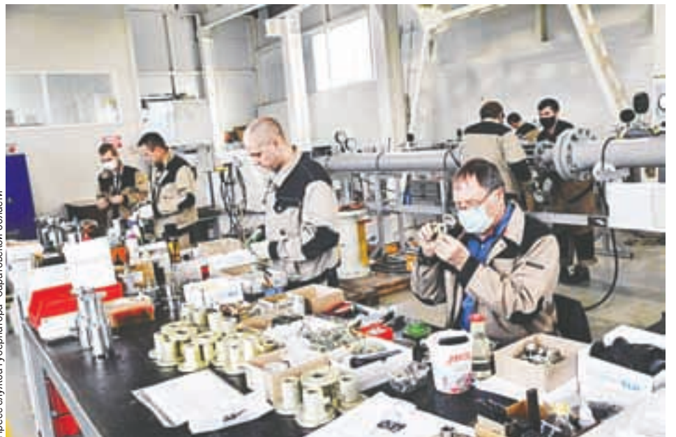
Пресс-служба губернатора Саратовской области

Рост промышленного производства - это новые рабочие места и дополнительные налоговые отчисления в бюджет.