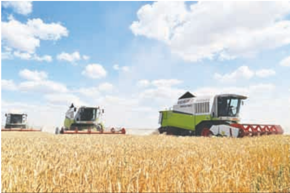
Саратовская область - лидер среди российских регионов по производству сельскохозяйственной продукции.

Ряд отраслей показал рост порядка 150% и выше - по выпуску минеральной продукции, мебели, транспортно-оборудования, автотранспортных средств, прицепов и полуприцепов. На заводах «Волжский дизель имени Маминых», «Роберт БОШ Саратов», Балаковский судостроительно-судоремонтный, Энгельсский трубопрокатный и других более чем в два раза нарастили объемы отгрузки товаров.