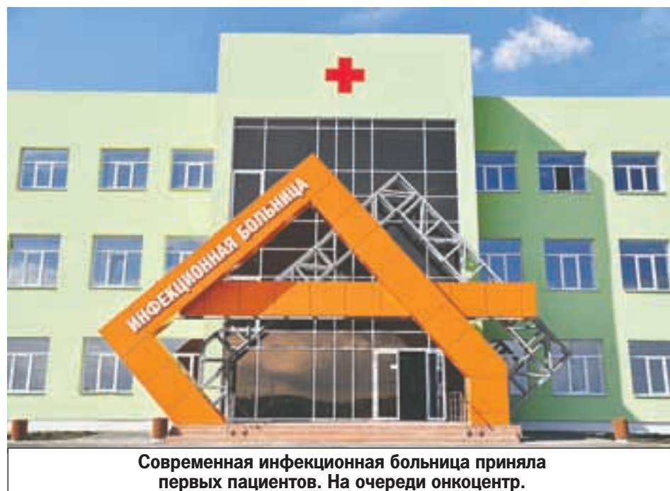
Современная инфекционная больница приняла первых пациентов. На очереди онкоцентр.

В 2021 году в здравоохранении: ✓ приобретено 849 единиц медоборудования , ✓ спецтранспорт - 259 машин . ✓ Капремонт - 56 объектов . ✓ Программа модернизации первичного звена - 40 медучреждений .