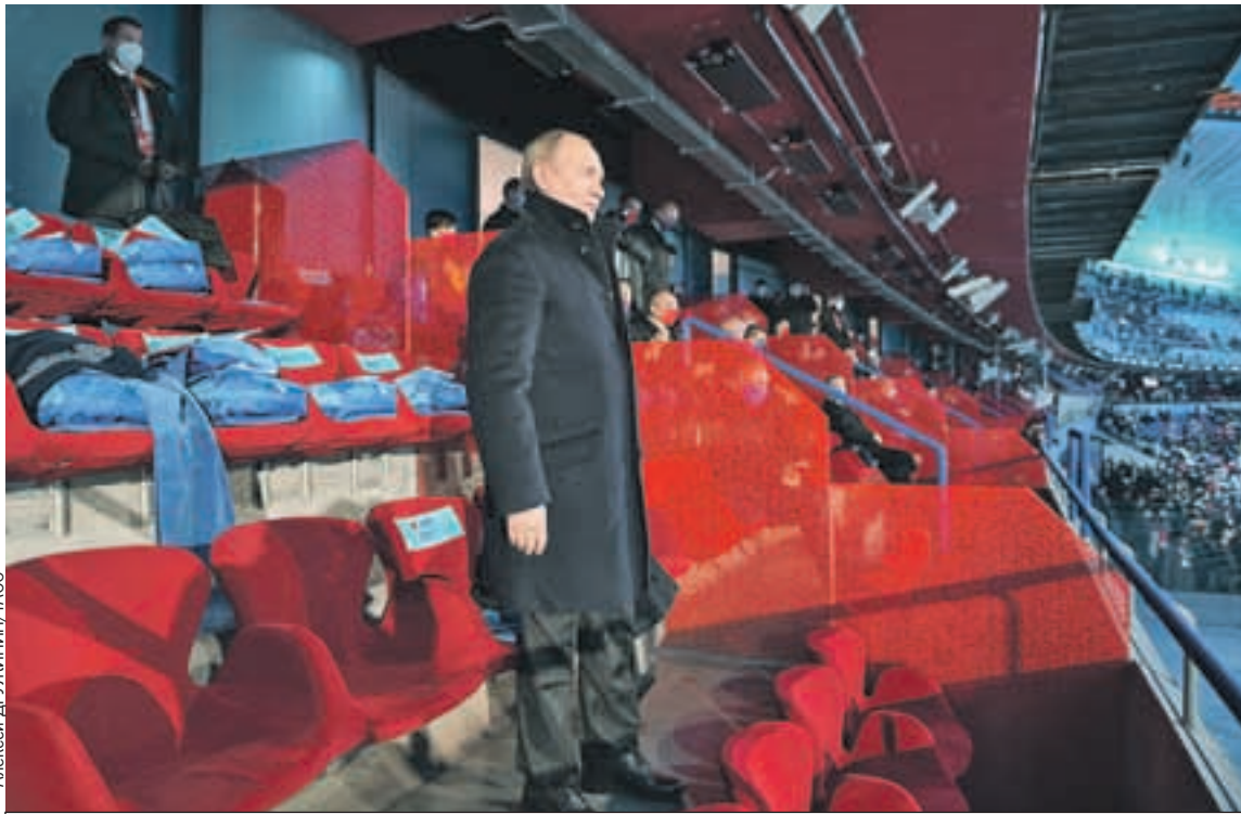
После успешных переговоров в Пекине с китайским коллегой Владимир Путин поехал на церемонию открытия XXIV зимних Олимпийских игр на Национальном стадионе «Птичье гнездо», где приветствовал колонну нашей сборной.

рились совместить планы развития Евразийского экономического союза и китайского проекта «Один пояс, один путь».