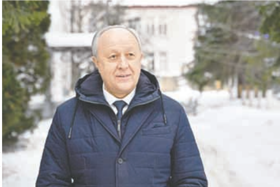
Пресс-служба губернатора Саратовской области

К примеру, в Балашовской агломерации упор сделан на переработку сельхозпродукции. В прошлом году здесь завершили реконструкцию производства на макаронной фабрике «МакПром». Ранее была проведена модернизация сахарного комбината. Сейчас строится завод по глубокой переработке пшеницы - проект на 25 миллиардов рублей инвестиций, более 400 новых рабочих мест. Компания «Агронаб» начала стро-