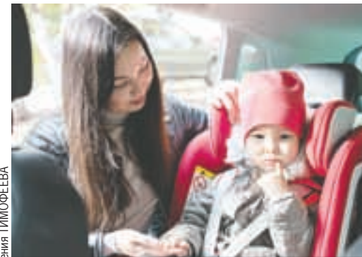
Детское кресло - забота о ребенке!

В ночь на пятницу обещают -4...-6, днем -2...0 градусов.