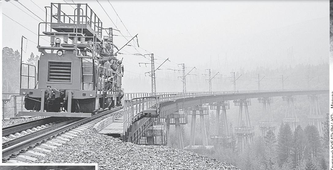
Григорий КУБАТЬЕВ/«КП» - Москва

А как живет и развивается БАМ сегодня? В год полувекового юбилея магистрали Григорий КУБАТЬЕВ отправился в путешествие, чтобы посмотреть, что происходит с грандиозным проектом сейчас.