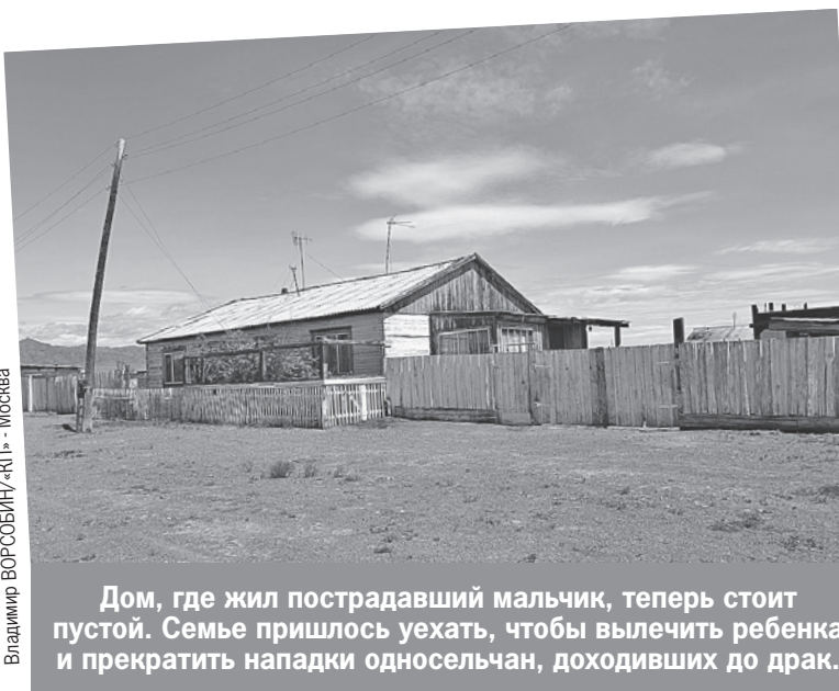
Дом, где жил пострадавший мальчик, теперь стоит пустой. Семье пришлось уехать, чтобы вылечить ребенка и прекратить нападки односельчан, доходивших до драк.

Единственное, чем семья тувинского мальчика выделялась в деревне, - кочевниче-