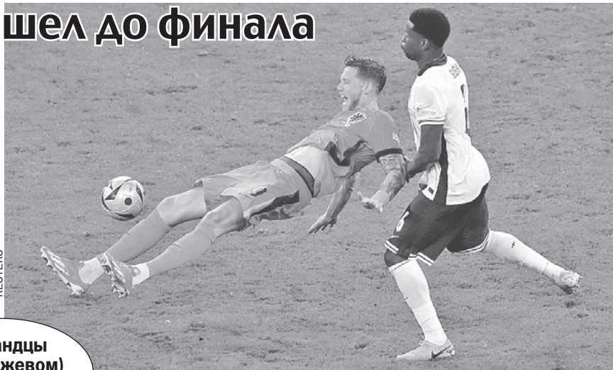
Голландцы (в оранжевом) пролетели мимо финала.

чане. Когда смотришь второй тайм в полуфинале - и видишь такую паршивую команду, - заявил Рафаэл ван дер Варт.