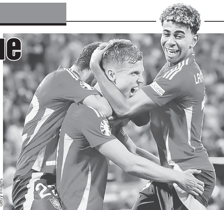
Автор первого гола Ламин Ямаль (справа) обнимает Дани Ольмо, забившего второй мяч в ворота французов.

- Нам посчастливилось открыть счет, но соперник создал нам проблемы, поскольку лучше контролировал мяч. Мы немного опаздывали и, вероятно, были не такими свежими, и это привело к техническим ошиб-