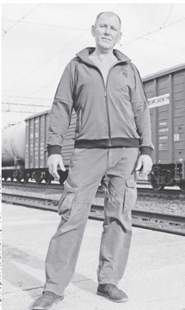
Григорий КУБАТЬЕВ/«КП» - Москва

Смущенный журналист подбрасывает брошенный окурочок, аккуратно тушит и прячет его.