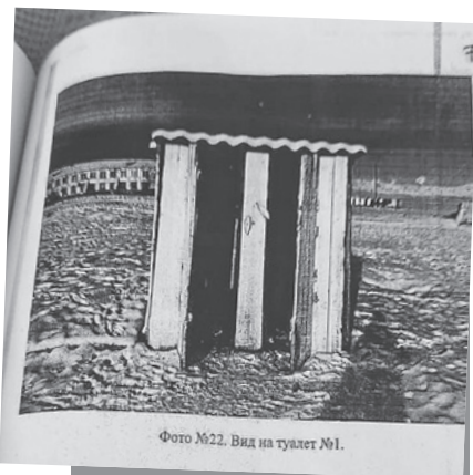
Фото №22. Вид на туалет №1.

В день моего приезда О-Шынаа, например, счастливо отмечало ежесемейный праздник - перечисление детских пособий. Давно я не видел такую пастораль - пошатывающиеся парочки с россыпью карапузов. Одно-