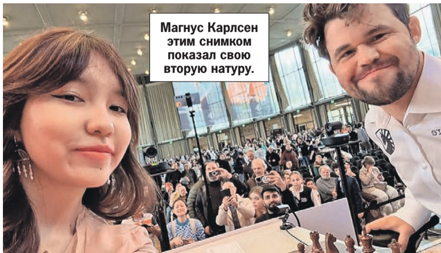
Магнус Карлсен этим снимком показал свою вторую натуру.

Личная страница аша_пугал в социальной сети