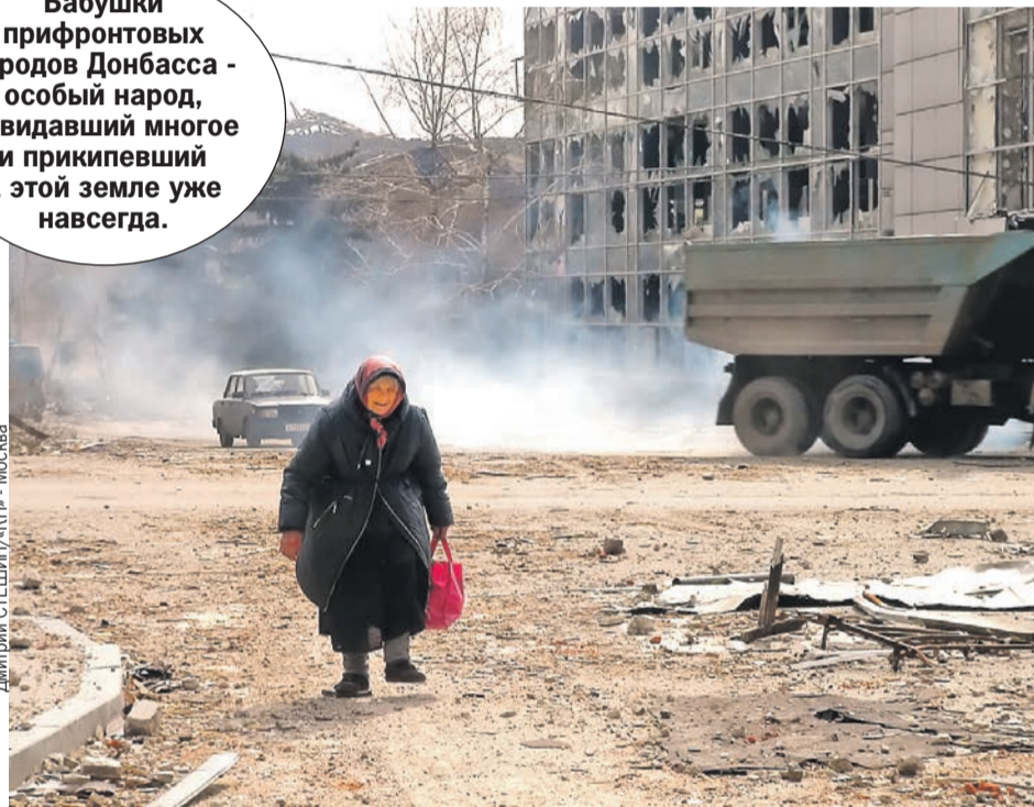
Дмитрий СТЕЩИН/«КП» - Москва

Бабушки прифронтовых городов Донбасса - особый народ, повидавший многое и прикипевший к этой земле уже навсегда.