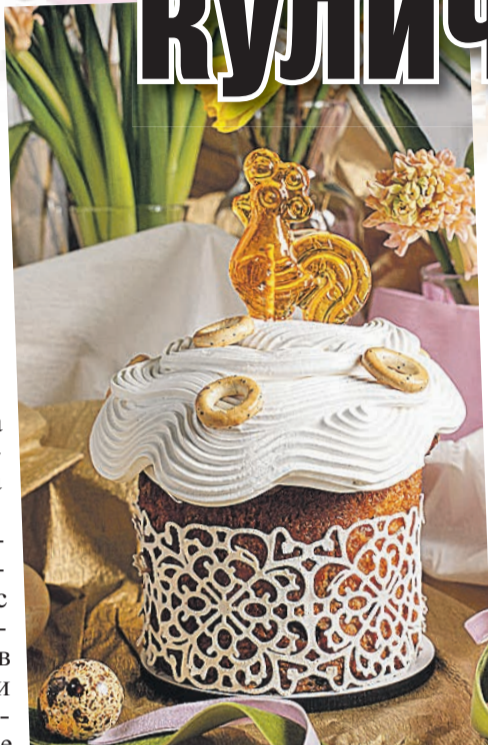
Последний писк моды пасхального декора: леденцовые петушки и сушки.

Актуальны и современные интерпретации народных мотивов: вышитые салфетки, деревянная посуда, керамика с ручной росписью. Такие детали добавят уюта и создадут ощущение тепла в праздничный день. Искусственные венки лучше заменить живыми цветами в простых вазах. Плетеные корзины и атласные ленты добавляют антуража. Но дизайнеры напоминают: важнее не количество декора, а атмосфера.