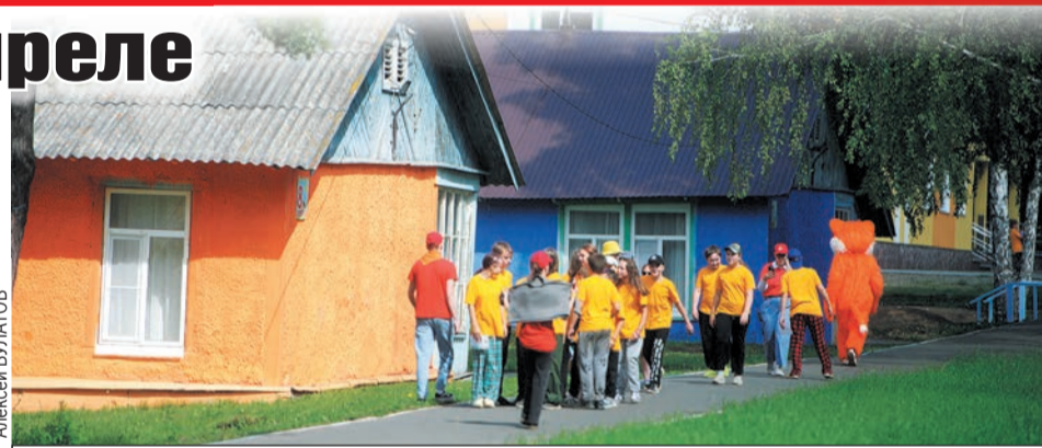
Для бронирования доступны почти 39 тысяч мест в детских оздоровительных лагерях Самарской области.

- За счет средств областного бюджета от-