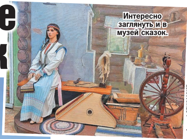
Интересно заглянуть и в музей сказок.

Следующим нашим пунктом была экскурсия в Музей истории и археологии, который находится здесь же, на набережной. Помимо того, что здесь можно узнать, как жили древние марийцы, во что одевались и чем занимались, интересное занятие здесь могли