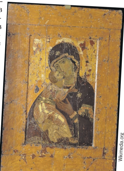
Владимирская икона Богоматери негласно считалась и считается главной - и в Древней Руси, и в современной России.

Обе иконы сейчас выставлены в храме Христа Спасителя в особых стеклянных капсулах, внутри которых поддерживается микроклимат, не дающий им разрушаться. Позже икона Божьей Ма-