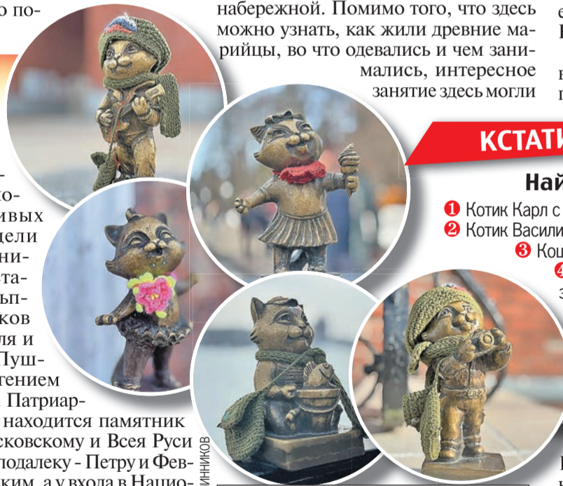
Эти милые котики могут поджидать вас в самых необычных местах.