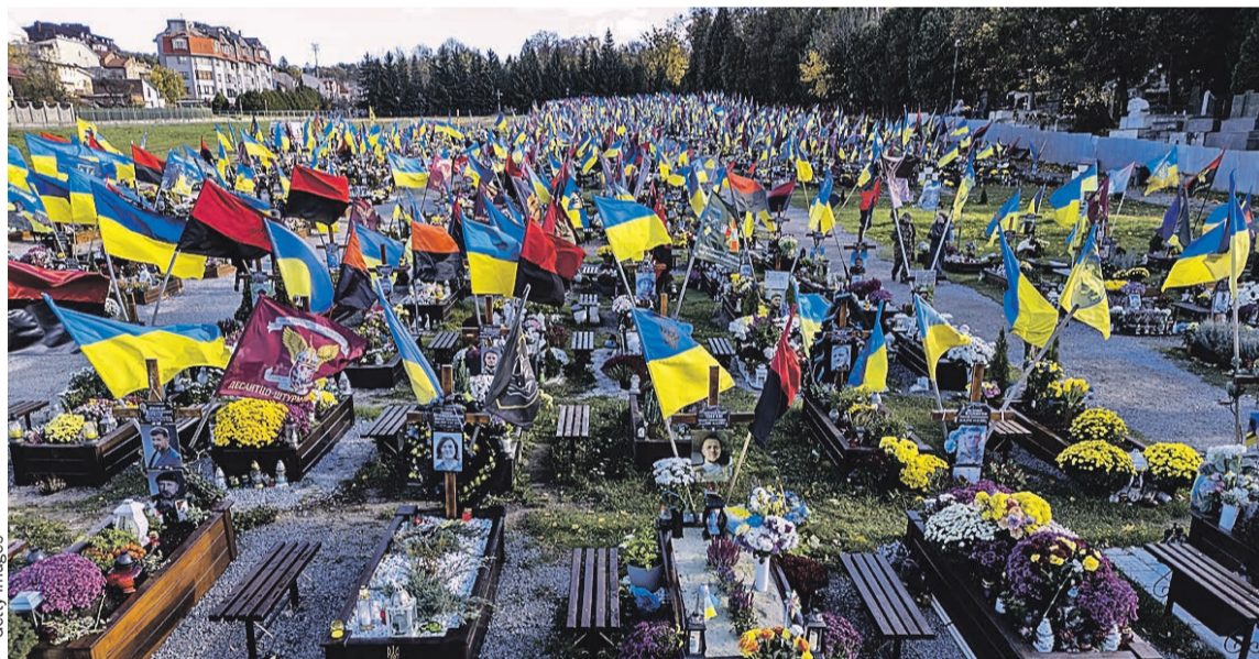
Русофобская политика киевских неонацистов обернулась смертями тысяч простых украинцев. Кладбище, подобных этому во Львове, в стране появилось множество.

Особенно беспокоит, что насильственное принуждение к неонацистской идеологии и ярая русофобия уничтожают некогда процветающие города Украины, в том числе Харьков, Одессу, Николаев, Днепропетровск.