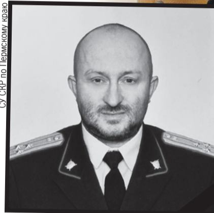
СУ СКР по Пермскому краю