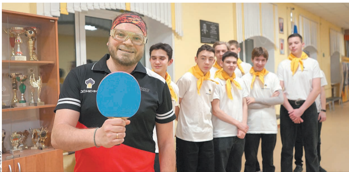
Хочешь стать первым - учись у лучших!

Настольный теннис всегда был популярен среди россиян: в советское время столы стояли в холлах организаций, промышленных предприятий и школ. Ученики «танцевали» вокруг них с ракетками все перемены напролет, и легкие шарики звонко скакали через сетку под одобрительный гул болельщиков, дожидаящихся своей очереди вступить в борьбу. В 1988 году этот вид спорта стал олимпийским, и увлечения самых азартных переросли в профессиональную деятельность. Нашим соотечественникам до сих пор ни разу не удавалось подняться на олимпийском пьедестале выше китайцев, но тем интереснее цель - наконец одержать победу. Но настольный теннис - это не столько про амбиции, сколько про физическую форму, здоровье и азарт. Тот, кто взял ракетку в руки в детстве, как правило, уже не выпускает ее из рук и играет до глубокой старости, удивляя