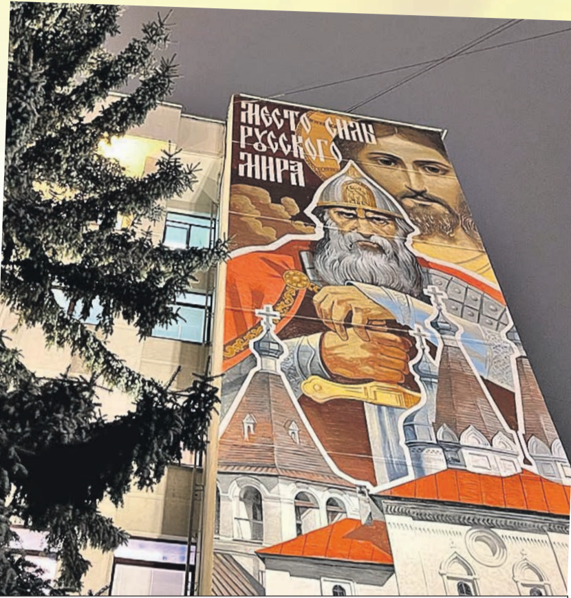
Такой плакат с былинным богатырем и надписью про то, что здесь «место силы Русского мира», висит на здании рядом с администрацией.

А вот в Вологде интересно. Тут обратный эксперимент.