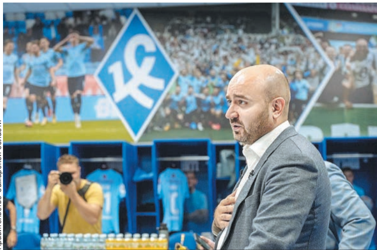
Губернатор решил разобраться с черными схемами в футболе окончательно.

После громких заявлений Федорищев отнес заявление в полицию. Там его приняли и начали проверку. Она длилась около месяца и закончилась уголовным делом.