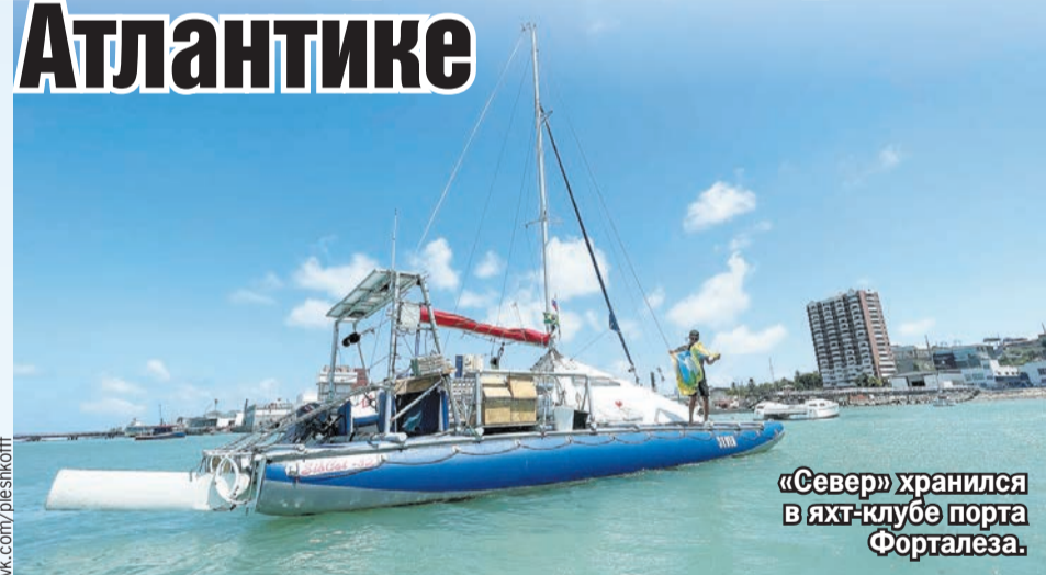
«Север» хранился в яхт-клубе порта Форталеза.

Восемь суток мы двигались нон-стоп, днем и ночью держали вахту, меняясь по очереди, спали урывками по 3-4 часа. В один из дней целой стая летучей рыбы показалась, что выбрасываться на нашу палубу весьма забавно. В итоге пришлось выковыривать рыб из всех щелей. По ночам чайки пытались прокатиться автостопом, тогда приходилось гоняться за