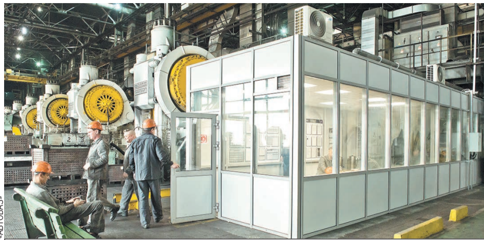
Завод стремится сделать каждый метр своей площади комфортным для работников.

Смета работ по всем этим улучшениям превысила 3,1 миллиарда рублей.