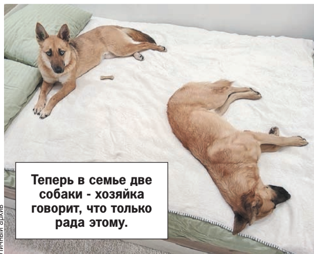
Теперь в семье две собаки - хозяйка говорит, что только рада этому.

Я очень рада, что так получилось, - призналась девушка. - Наверное, если бы Джон не потерялся, я бы еще долго думала о второй собаке. Но теперь, когда у меня их две, я понимаю, что вообще незачем было думать, надо было брать, потому что это классно!