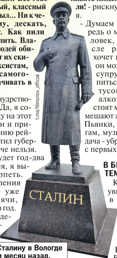
Памятник Сталину в Вологде открыли месяц назад.

- Я не буду мудрствовать лукаво. Да, я сознательно иду на этот шаг, пусть он и приведет к падению рейтинга, - ответил губернатор. - Иначе нельзя. Пусть это будет год-два продолжаться, я вынужден терпеть. Убыль населения в области - уже не 7,5 тысячи, а 8,5 тысячи в год. Пьяное вождение, поножовщина,