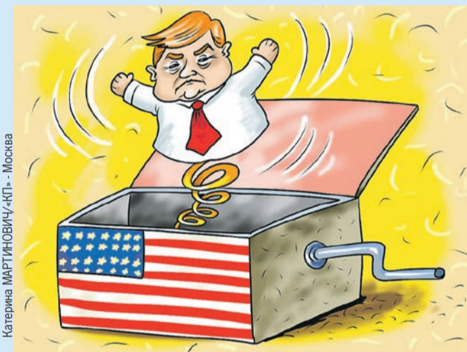
Катерина МАРТИНОВИЧУ «КП» - Москва

- Трамп будет жестко действовать в американских интересах. Но в отличие от Байдена он не маньяк, ненавидящий Россию. Мы будем где-то сотрудничать, где-то соперничать... Но мы не будем балансировать на грани ядерной войны. И, конечно, жду, что Трамп поможет прекратить войну на Украине, демонтирует созданную его политическими противниками фашистскую киевскую хунту.