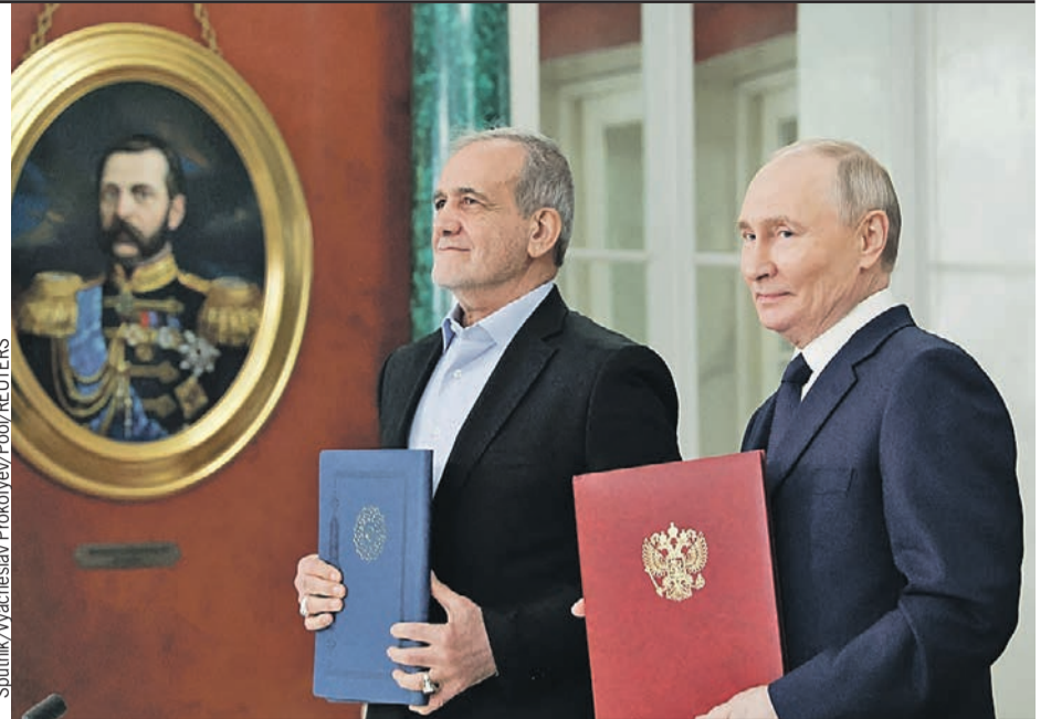
Два президента один император: Владимир Путин и его иранский коллега Масуд Пезешкиан под пристальным взглядом Александра II.

- Реализация этого проекта помогла бы наладить бесшовную логистику от России и Белоруссии до иранских портов в Персидском заливе, - сказал российский президент.