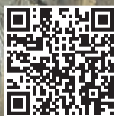
Фото присылайте в «Комсомольскую правду», e-mail: miss@kp.ru

Голосуйте за понравившуюся вам участницу на нашем сайте KP.RU в разделе «Будь стильной с «КП»!