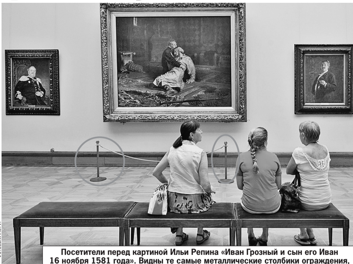
Посетители перед картиной Ильи Репина «Иван Грозный и сын его Иван 16 ноября 1581 года». Видны те самые металлические столбики ограждения, одним из которых вандал и разбил защитное стекло.

- Может быть. Но оно на порядок дороже и очень тяжелое. И это-то нелегкое. Его, кстати, в прошлом году снимали, почистили и проверили крепления - все в порядке было. Такое стекло - новая и современная защита. В Третьяковской галерее постоянно идет замена и установка таких музейных стекол. Далеко не все картины ими защищены. Нужны колоссальные средства. В галерее до сих пор кое-где остались еще довоенные стекла. Они такие как бы пузырчатые.