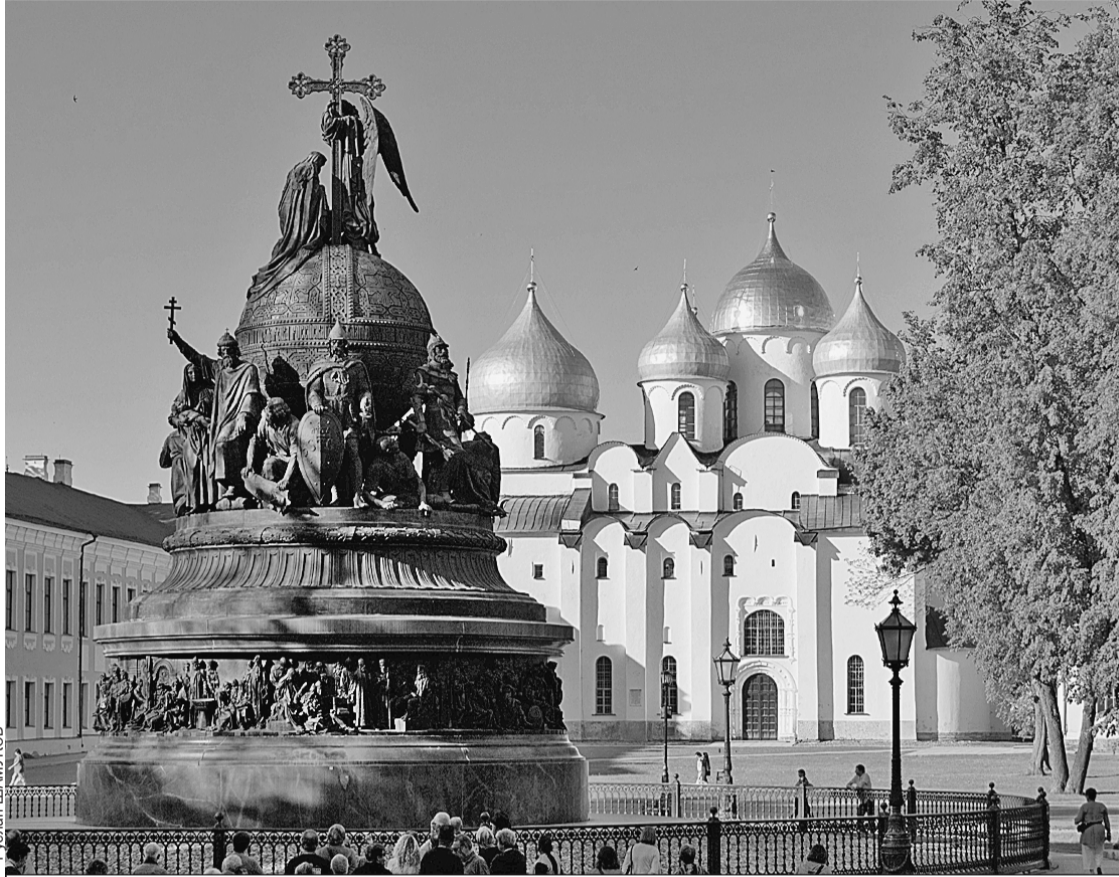
В монументе «Тысячелетие России», установленном в Новгороде в XIX веке, отражены история становления государства и ее творцы.

На повестке второго дня конференции «Диалог Форт-Росс» были вопросы кибербезопасности. Участники обсудили перспективы развития информационной