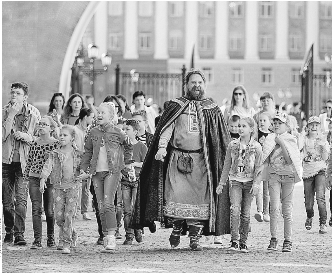
Российско-американская конференция прошла в городе, в котором гармонично сочетаются история и современность, сохраняются культурные традиции.

вательные связи, которые помогают нам в период политического противостояния, - подчеркнул Томас Лири.