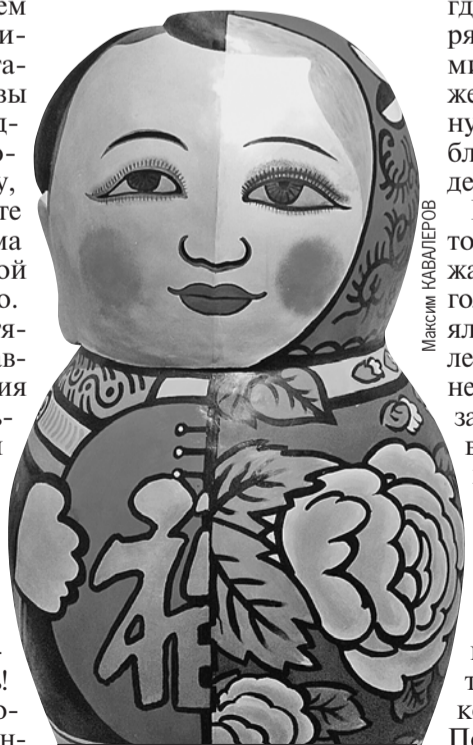
Даже матрешки на Дальнем Востоке двуликие - русско-китайские...