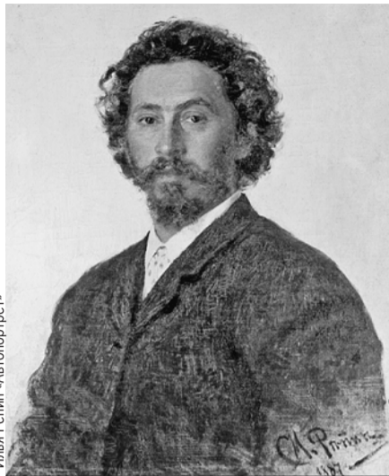
Илья Репин - Автопортрет