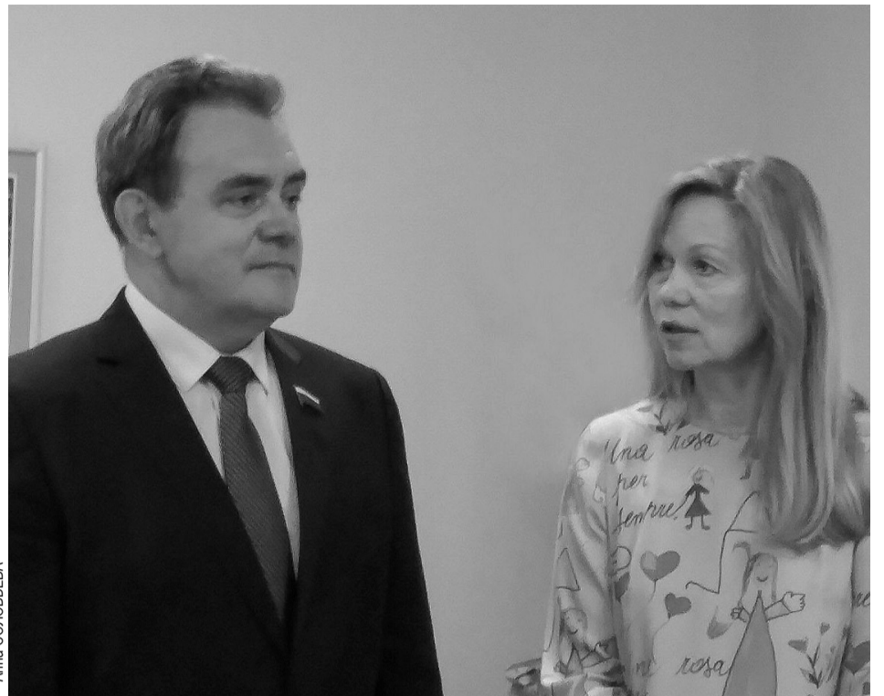
Председатель Законодательного Собрания и директор школы №56 обсудили реализацию проекта.

педагогов или родителей здесь нет. Детские книги оценивают только дети, без давления и влияния мира взрослых. Это действительно уникальный проект и я желаю, чтобы как можно больше пензенских школ присоединились к нему.