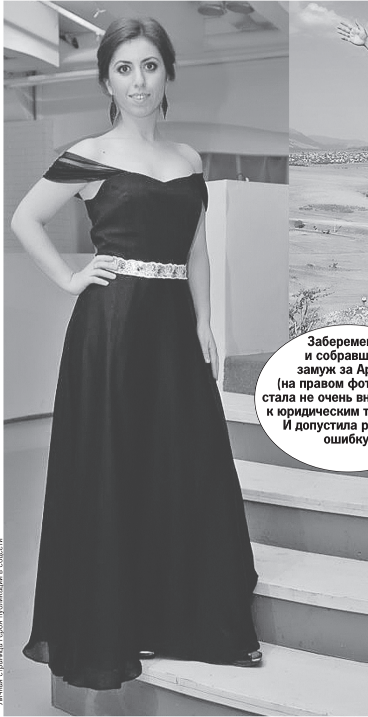
Личная страница героя публикации в соцсети