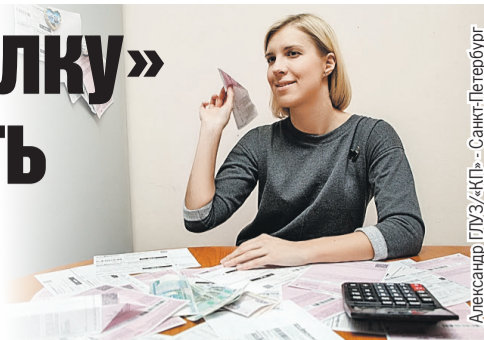
Александр ГЛУЗ/«КП» - Санкт-Петербург