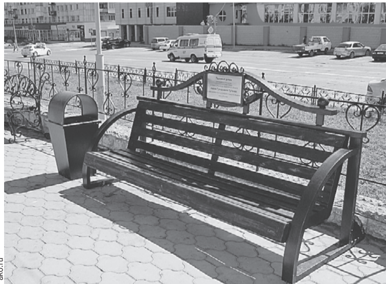
Таблички на лавочках областного центра извещают горожан, что и эти городские удобства появились благодаря неусыпной заботе о земляках со стороны Амана Гумировича.

Я не говорю, что деньги заменят людям детей, но лгать про 5724 рубля на фоне этой суммы низко: так же низко, как постить старые фотографии человека в болезни.