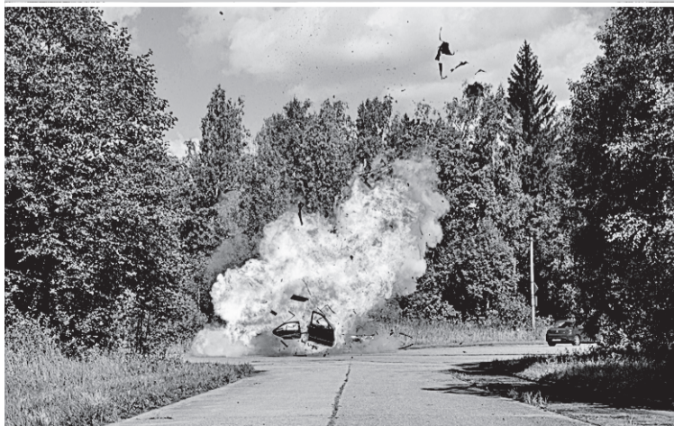
Со взрыва машины банкира Лядова и начинается масштабное расследование, которое ведет главный герой.