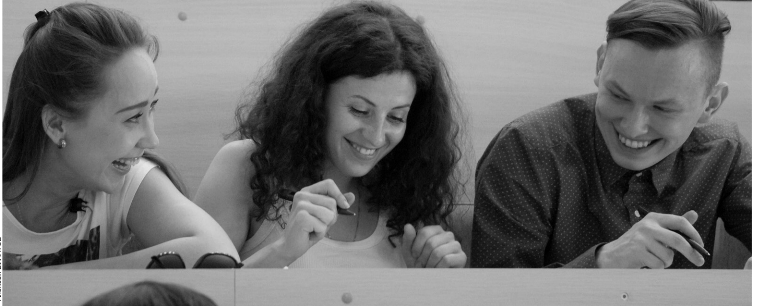
В этом году диктант в Пензе напишут на трех площадках.

Из 75 опрошенных нами в социальных сетях пензенцев только 18 человек писали Тотальный диктант (четверо на оценку «отлично»). Но желание поучаствовать