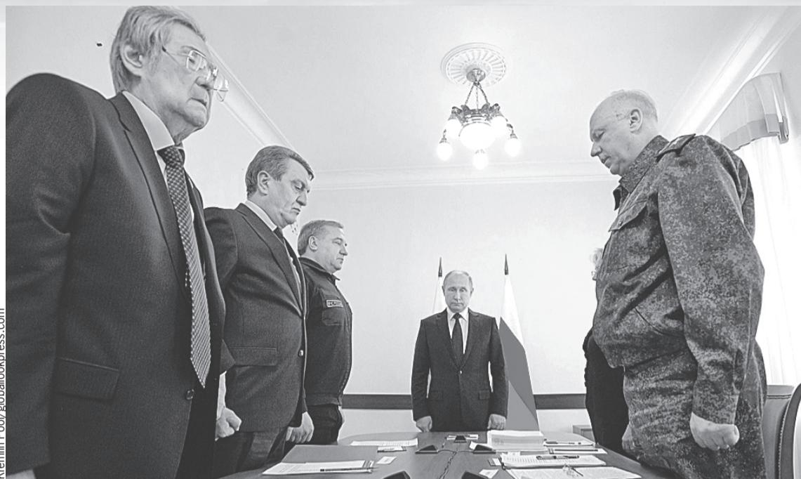
Последняя встреча губернатора Тулеева (на снимке крайний слева) с Владимиром Путиным состоялась 27 марта, когда президент прилетел в Кемерово после страшного пожара в торговом центре «Зимняя вишня». На встрече также присутствовали полпред президента в Сибирском федеральном округе Сергей Меняйло (второй слева), глава МЧС Владимир Пучков (третий слева) и председатель Следственного комитета Александр Бастрыкин (справа).

Но вот в 2016 году случился слом системы: в июле администрация Кемеровской области стала «работать» с собственником разреза «Инской», у которого две смены