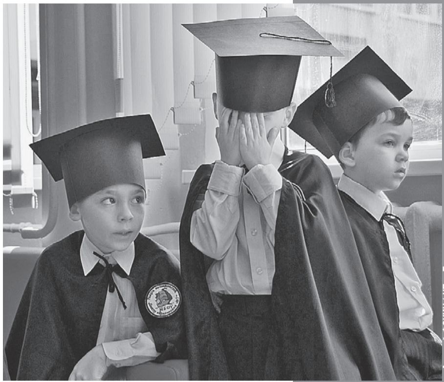
Может, это последнее фото, на котором школьники в ужасе от оценки.

А выглядит она, например, так (цитирую дословно): «Оценка: прочитала эпизод из рассказа «Лошадина фамилия». Достижения: чтение эмоциональное и выразительное. Смогла выбрать интерес-