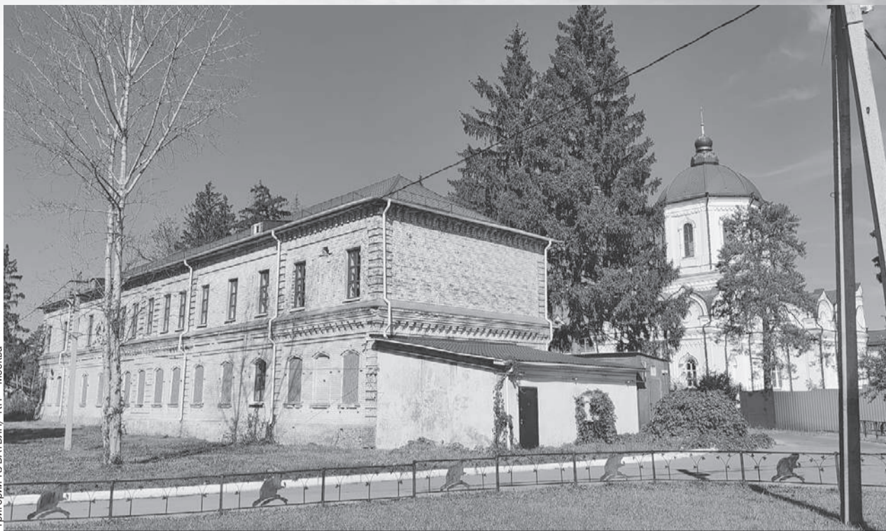
Тот самый дом в заповеднике имени Пескова, где на 2-м этаже пока еще живет музей.