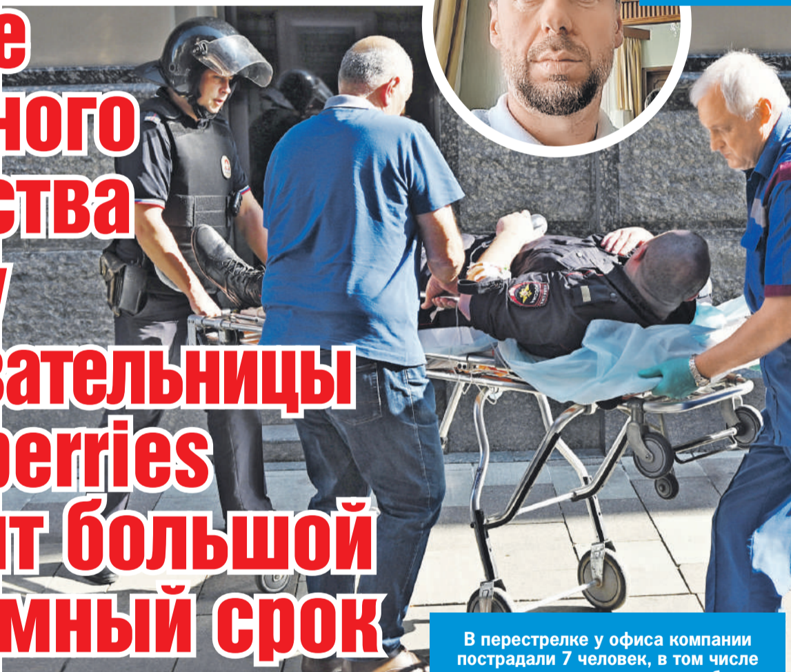
В перестрелке у офиса компании пострадали 7 человек, в том числе правоохранители, двое погибли.