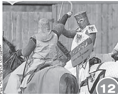
ИД «Беларусь сегодня»