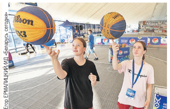
Девушки ловко крутили мяч на пальце, а потом технично закидывали его в кольцо, как настоящие баскетболистки.