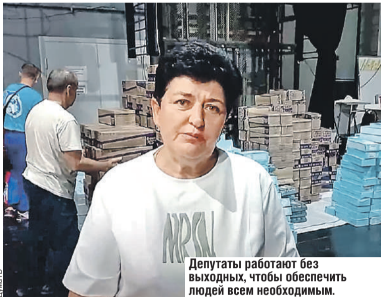
Депутаты работают без выходных, чтобы обеспечить людей всем необходимым.

- Куряне каждый день принимают очень много помощи буквально из всех уголков нашей необъятной Родины. Сегодня - от «Российского детского фонда». Это продукция, которая пойдет детям в многодетные семьи. Будем поддерживать малышей.