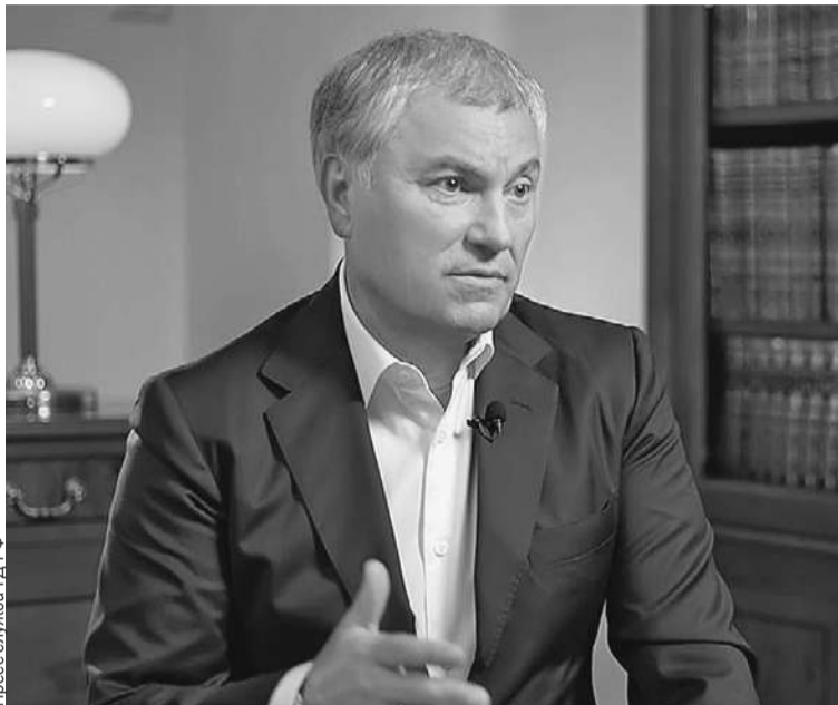
- Задачи, поставленные Владимиром Путиным и Александром Лукашенко, должны решаться оперативно.

- Раньше это были, как правило, традиционные группы дружбы: обменивались делегациями, приезжали, высказывали заверения дружбы. На этом практически вся работа завершалась, - объяснил он. - Сейчас мы, предложив