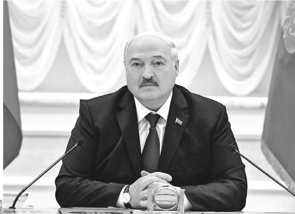
Александр Лукашенко пытался убедить и нынешнее, и прежнее руководство Украины хорошо подумать и не наломать дров. Но они полностью отключили голос разума.

ответил на претензии глава государства. - А Украина что? Она же раньше Запада ввела против нас санкции. Зачем вы по надуманным причинам закрыли небо для нашей авиации? Вы арестовали несколько тысяч наших вагонов с минеральными удобрениями. До сих пор не вернули. Арестовали 75 наших фур, трех человек убили и на куски порезали. Мы проводили операцию, чтобы тела достать.