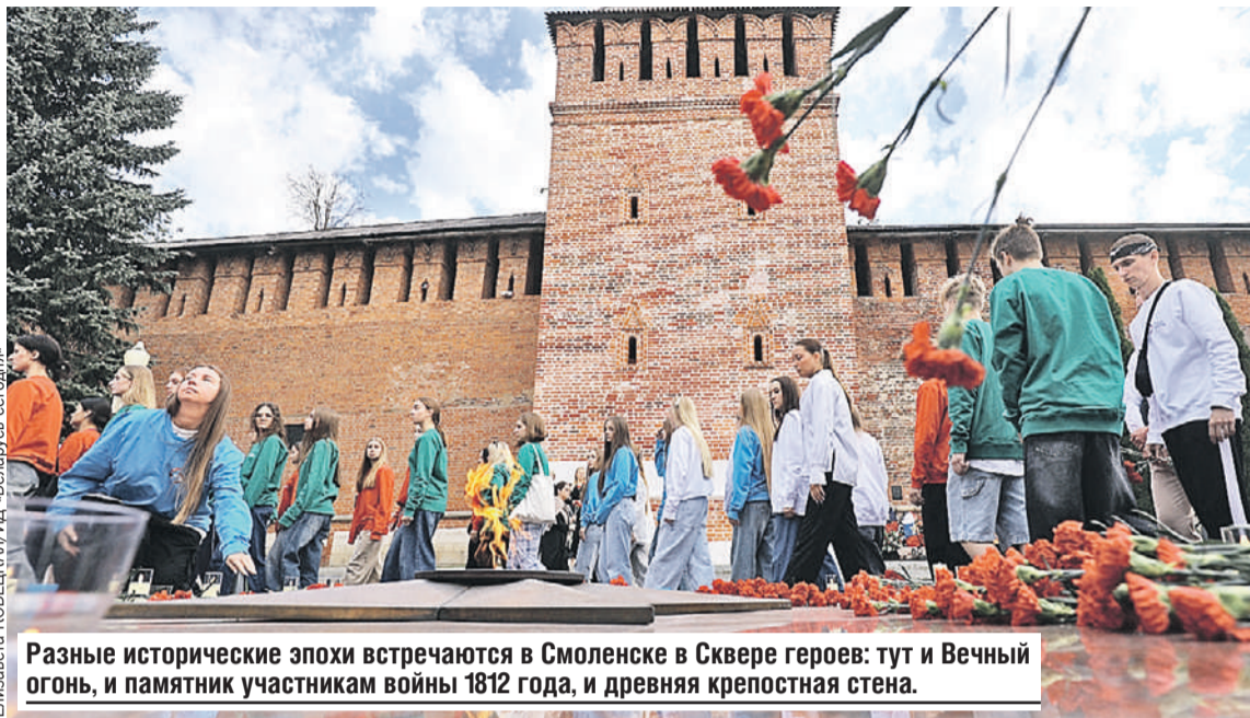
Разные исторические эпохи встречаются в Смоленске в Сквере героев: тут и Вечный огонь, и памятник участникам войны 1812 года, и древняя крепостная стена.

Госсекретарь Союзного государства Дмитрий Мезенцев напомнил, что в последнее время в два раза увеличили число патриотических мероприятий.