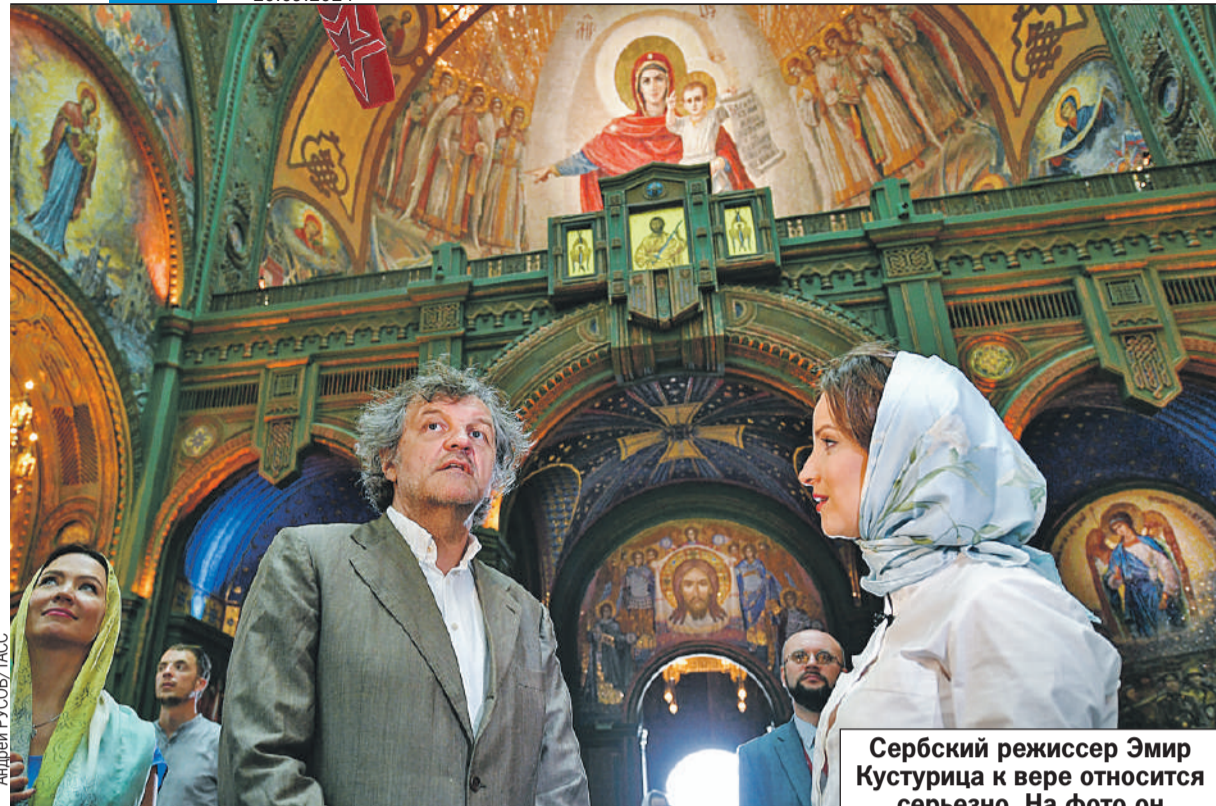
Сербский режиссер Эмир Кустурица к вере относится серьезно. На фото он в храме Вооруженных сил.