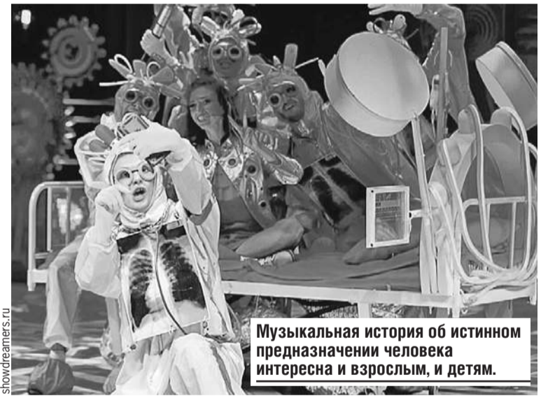
Музыкальная история об истинном предназначении человека интересна и взрослым, и детям.

- С Ларисой Долиной мы и сейчас поддерживаем отношения. А насчет того, чтобы повторить такой опыт, я только за и всегда готов рассмотреть такие предложения. Жизнь продолжается, все самое интересное впереди.