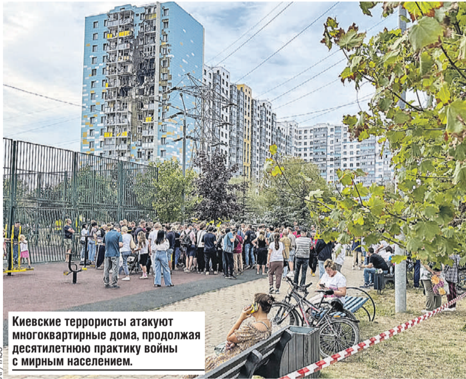
Киевские террористы атакуют многоквартирные дома, продолжая десятилетнюю практику войны с мирным населением.