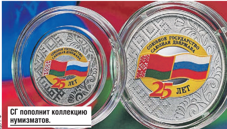
СГ пополнит коллекцию нумизматов.

си «Союзное государство» и «Саюзная дзяржава», а с лицевой - номинал, проба и герб.