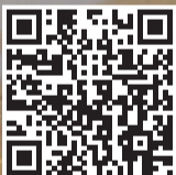
Фото присылайте в «Комсомольскую правду», e-mail: miss@kp.ru

Голосуйте за понравившуюся вам участницу на нашем сайте KP.RU в разделе «Будь стильной с «КП»!