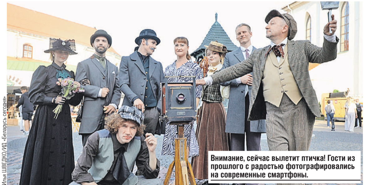
Внимание, сейчас вылетит птичка! Гости из прошлого с радостью фотографировались на современные смартфоны.