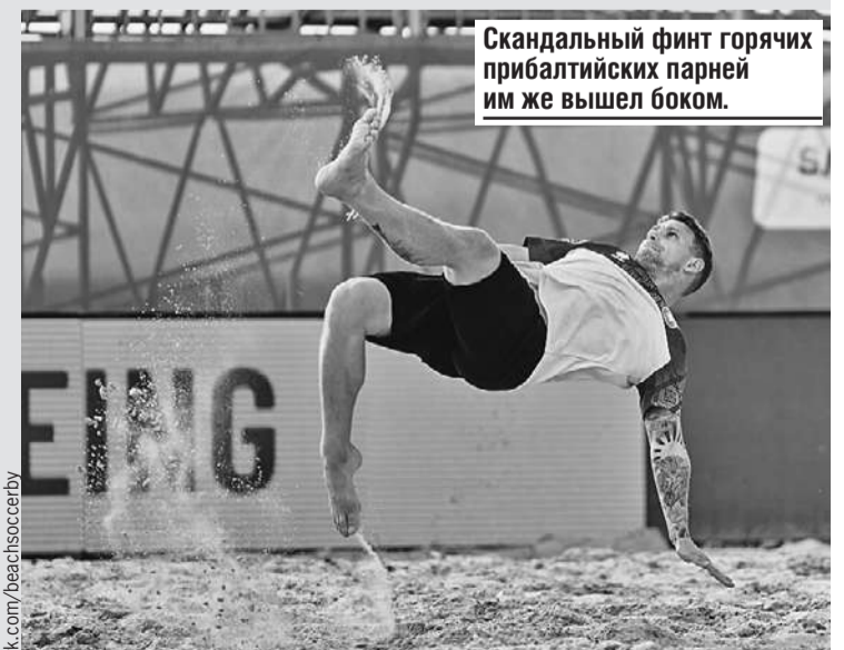
Скандальный финт горячих прибалтийских парней им же вышел боком.

повторялась. Теперь уже с белорусами. А эстонский демарш для европейских футбольных чиновников останется капризным взбрыком прибалтов - дали пинка и забыли. Пусть так и будет.