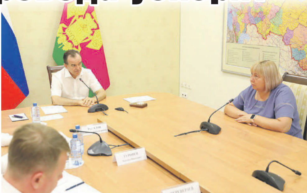
Вениамин Кондратьев отметил, что людям на селе необходимо создавать комфортные условия жизни.

Женщина также рассказала, что в населенном пункте до сих пор нет га-