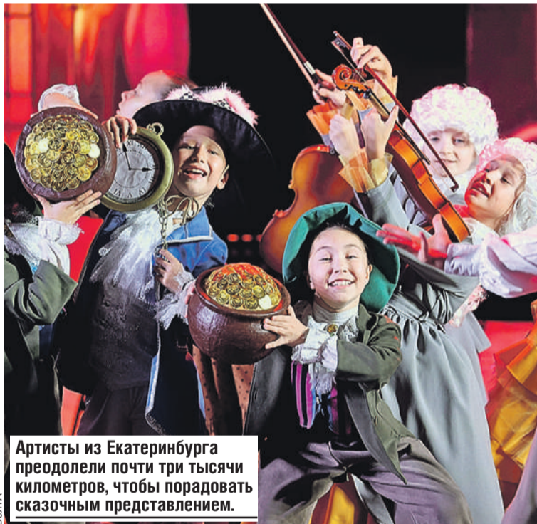
Артисты из Екатеринбурга преодолели почти три тысячи километров, чтобы порадовать сказочным представлением.

- Подготовили особый блок, посвященный Польскому походу Красной армии, который сыграл важную роль в историческом единении белорусского народа. Это событие отражает нашу общую судьбу и национальное самосознание.