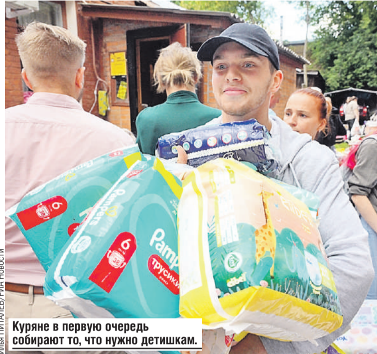
Куряне в первую очередь собирают то, что нужно детишкам.

- Конечно, это вызов. Он серьезный не только для Курского региона, но и для