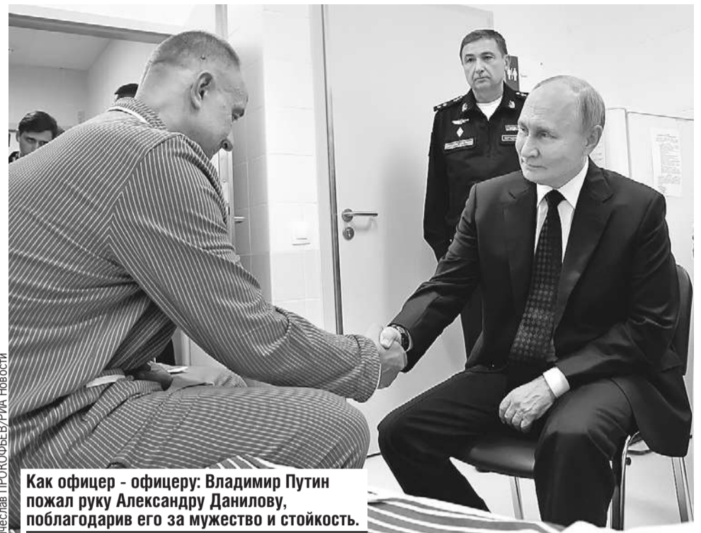
Как офицер - офицеру: Владимир Путин пожал руку Александру Данилову, поблагодарив его за мужество и стойкость.