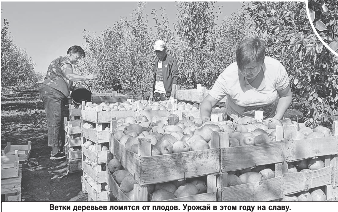
Ветки деревьев ломаются от плодов. Урожай в этом году на славу.

ки от паразитов. Главный враг - медяница. Она повреждает плод, поглощая сок из растений. Вызывает недоразвитие, листья желтеют и скручиваются, бутоны осыпаются. При Украине таких хороших препаратов для борьбы с паразитами у