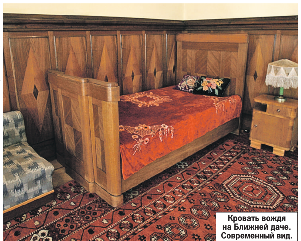
Кровать вождя на Ближней даче. Современный вид.