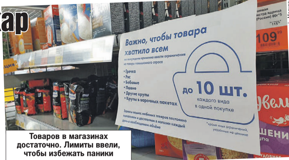
Товаров в магазинах достаточно. Лимиты ввели, чтобы избежать паники и отсеять спекулянтов.

больше, чем в обычный выходной. Продуктов хватает, однако на бакалейных полках - пробы. Та же картина с растительным маслом и туалетной бумагой. А вот гречки нет вовсе. И водку размели почти подчистую - времена сейчас сложные, а белянскую власти не внесли в список социально значимых товаров (не иначе по недосмотру).