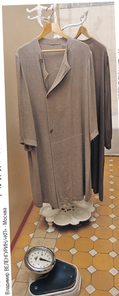
Баннские халаты Сталина и напольные весы. Современный вид.

С ними генсек не расставался, даже отправляясь отдыхать на юг. В декабре 1945-го, когда Сталин собирался вернуться из отпуска, путешествие из Сочи в Москву осложнилось: по перевалу, где проходила железная дорога, стало невозможно проехать. Спецпоезд вождя подал за перевал, отправив состав кружным путем через Грузию. Сам Сталин должен был достичь места посадки в поезд на автомобиле. В суете и спешке в багаж Хозяина забыли положить его любимые тапочки. Чтобы избежать «монаршего» гнева, решили отправить тапочки в Москву самолетом в сопровождении сотрудника охраны. Тапочки-путешественницы прибыли на Ближнюю раньше своего хозяина и заняли традиционное место у кровати в спальне.