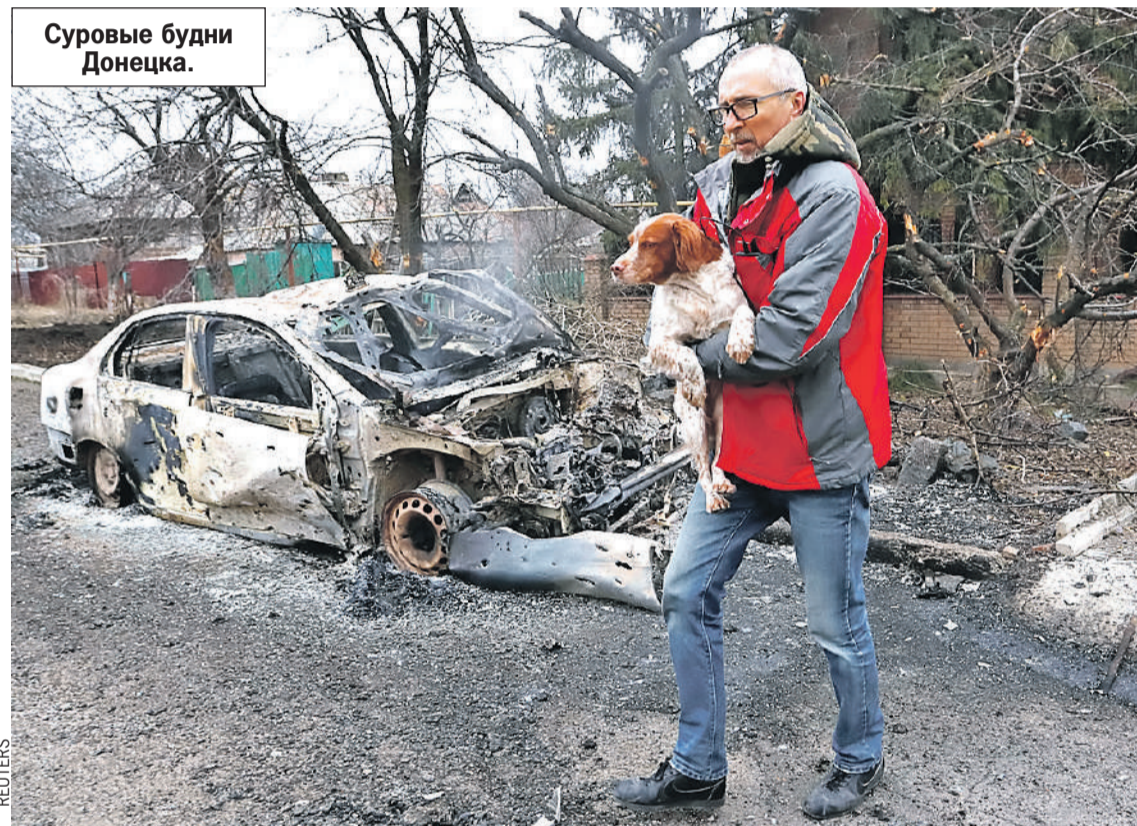
Суровые будни Донецка.

- Но вам даже не показали короткий список тех, кто из культуры понимает и принимает происходящее. Знаете,