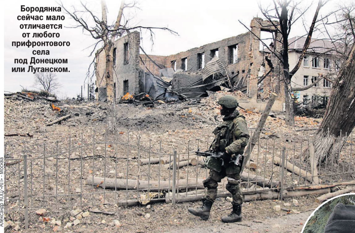
Александр КОЦ «КП» - Москва

Бородянка сейчас мало отличается от любого прифронтового села под Донецком или Луганском.