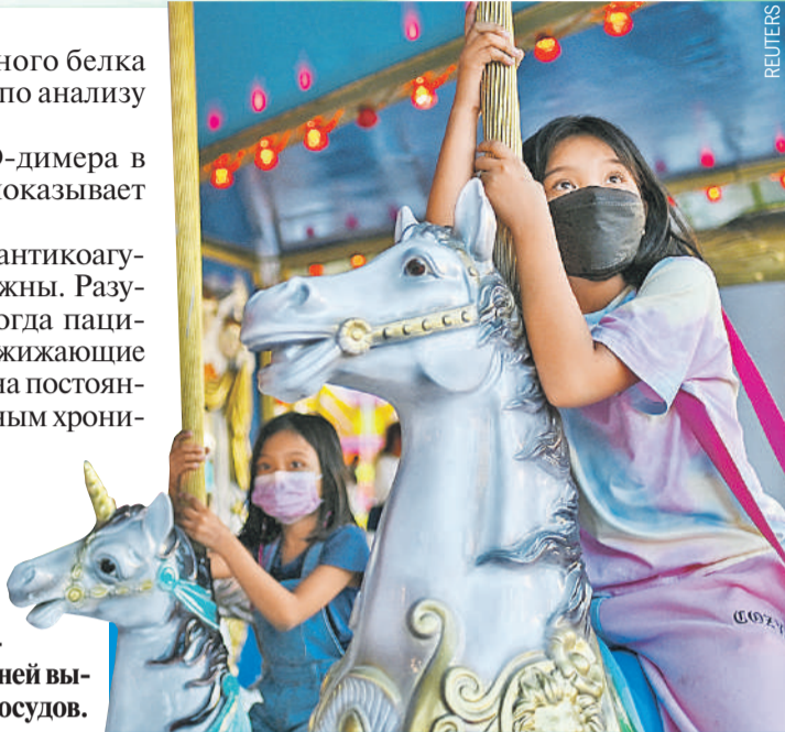
В мире постепенно отменяют ковидные ограничения. Но ношение масок остается обязательным. Например, на Филиппинах это требование касается и детей.

Пока антидепрессанты не входят в клинические рекомендации по лечению и профилактике сердечно-сосудистых осложнений COVID-19,