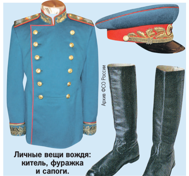
Личные вещи вождя: китель, фуражка и сапоги.