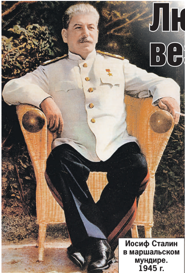
Иосиф Сталин в маршальском мундире. 1945 г.