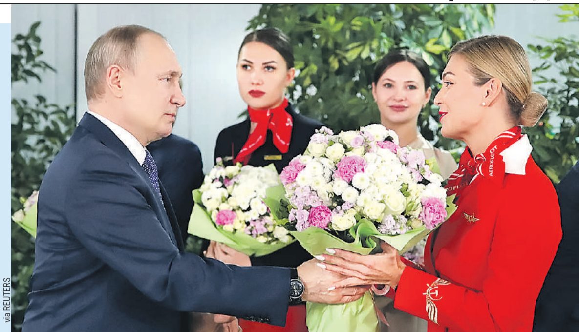
Накануне 8 Марта Владимир Путин в учебном центре «Аэрофлота» поздравил с праздником летный персонал и стажеров из разных российских авиакомпаний. И вручил букеты. Он осмотрел кабину, позволяющую отрабатывать навыки управления российским лайнером МС-21, и в сопровождении командира воздушного судна Марии Касьяник совершил имитационный полет на авиасимуляторе «Сухой Суперджет-100». А также посетил центр «Вода - суша» по подготовке экипажей к нештатным ситуациям.

(Министр труда и соцзащиты Антон КОТЯКОВ - о размере пособия на ребенка от 8 до 16 лет.)