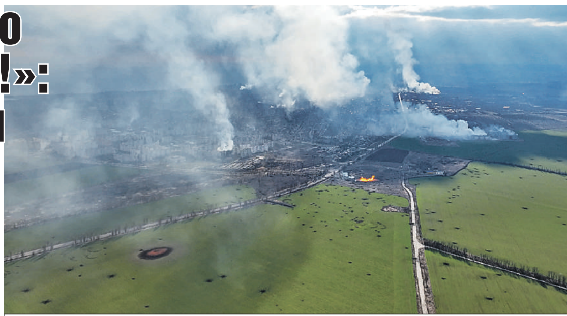
Так выглядят окрестности Мариуполя с высоты.

Он показал мне надпись на экранчике: «Ува! Бійці ЗСУ! (ВСУ, Вооруженные силы Украины. - Авт.) Терміново (срочно. - Авт.) виходьми з Маріуполя!»