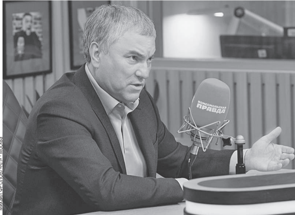
Вячеслав Володин в студии Радио «Комсомольская правда»: «Дальнейшая судьба освобожденных территорий Украины должна зависеть только от их населения».