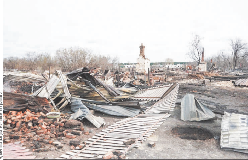
Десятки сельчан остались буквально в том, что было на них надето, все остальное сгорело подчистую.

- В каждом случае будем подходить индивидуально, к каждой семье прикреплен социальный работник, к которому пострадавшие жители могут обратиться в любую минуту, рассказать о возникшей проблеме, чтобы можно