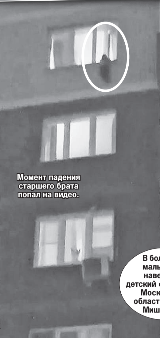
Момент падения старшего брата попал на видео.