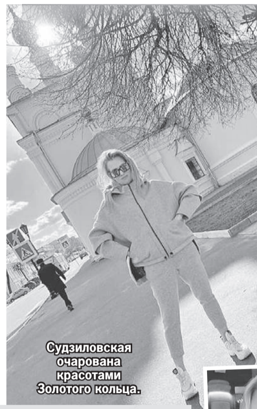
Судзиловская очарована красотами Золотого кольца.

Актриса Олеся Судзиловская с семьей отправилась в поездку по городам Золотого кольца. Актрисе запомнился Муром, где она посетила сразу несколько храмов. Потом семья отправилась в Город мастеров в Городце: «Это особое место, музей. Роскошный сруб подле Волги-реки на набережной Юрия Долгорукого. Встреча с неизменными самоваром и пряниками».