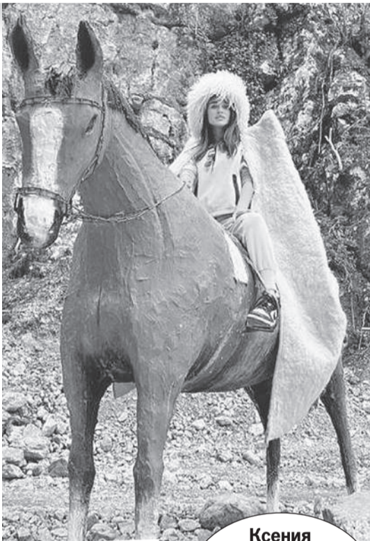
Ксения Бородина съездила на экскурсию в Абхазию.

В начале мая здесь было дождливо и не жарко - всего +15. Пришлось пляжный отдых заменить на экскурсионный. Телеведущая Ксения Бородина устроила себе и детям мини-путешествие в Абхазию: «Я в восторге - как же тут красиво... Стоит посмотреть Голубое озеро, Юпшарский каньон, озеро Рица, дачу Сталина». А потом Ксения с детьми и большой компанией друзей вернулись в Красную Поляну, где остановились в одном из самых дорогих пятизвездочных отелей, сутки в котором стоят от 20 тысяч рублей.