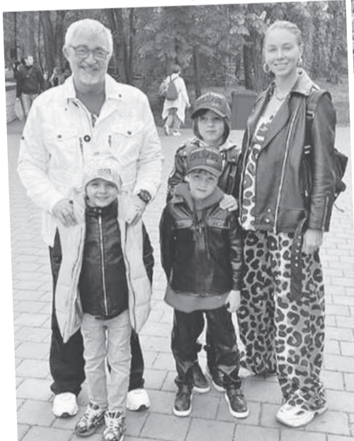
Семейство Дибровых предпочло провести выходные в Ростове.