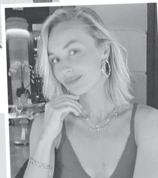
Гагарина обещает привезти из Эмиратов тепло.