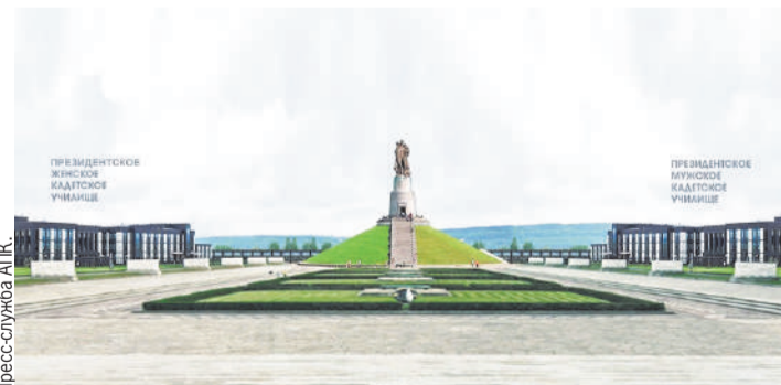
Новый памятник будет посвящен всем сибирякам, которые ковали победу на фронте и в тылу.

Позже на территории комплекса построят музей-