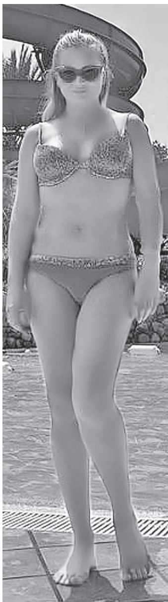
Дане Борисовой хорошо в Турции.

На турецких курортах на праздниках загорало множество звезд. Телеведущая Дана Борисова полетела в Белек с дочкой и сразу похвасталась фото в купальнике: «Кто бы мог раньше подумать, что буду радоваться поездке в Турцию как ребенок!». Певица Наталья Подольская там же, в Белеке, нежилась с коктейлем у бассейна: «Если есть возможность лететь - надо лететь!». Ну и правильно, ведь температура воздуха на любимых нашими соотечественниками курортах сейчас +26 градусов, воды - +21.