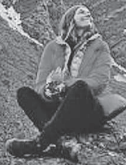
Толкалина прилетела в Катманду и отправилась покорять Эверест.

Актриса Любовь Толкалина отправилась в долгое и захватывающее путешествие. «Я в Катманду, - написала она, добравшись до столицы Непала. - Завтра мы вылетим в Луклу и поселимся в основном приюте Эвереста. Дальше наверх». Толкалина давно мечтала попасть на Эверест, и вот мечта наконец сбылась.