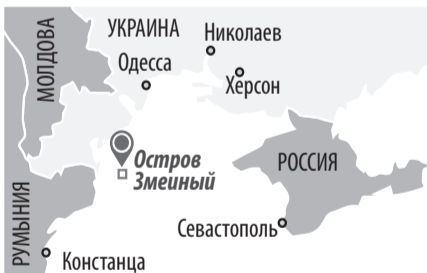
Украинский остров в Черном море. Входит в состав Измаильского района Одесской области. Площадь - 0,17 км 2 .