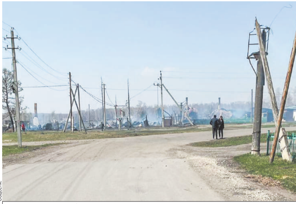
Огонь уничтожил в селах целые улицы.

Что послужило причиной пожаров, предстоит выяснить специалистам. Дознаватели в качестве предварительной причины называют неосторожное обращение с огнем. Сами жители говорят, что виной всему стало короткое замыкание: сильный шквалистый ветер, который дул 7 мая, повалил столбы с электрическими проводами, те оборвались, искры рассыпались, и сухая трава вспыхнула, как порох. А ветром пламя и раздуло... Ветер мешал и прибывшим пожарным тушить огонь: если в Листвянке с ним удалось справиться примерно за два часа, то в Итате и Изындаево пожары тушили около 20 ча-