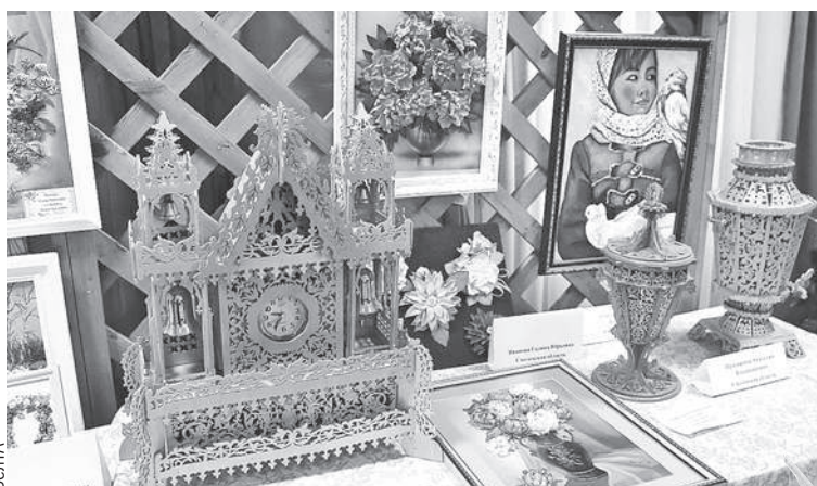
На выставке изобразительного и декоративно-прикладного искусства некоторые шедевры можно было купить.

На конкурсе исполнителей Гена представил хит этого года - «Встанем». Специально для фестиваля парень написал аранжировку. Зритель и жюри благодарили его овациями.