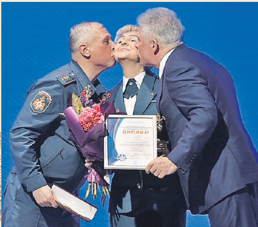
Владимир ВЕЛЕНГУРИН/«КП» - Москва

По традиции перед самым Новым годом МЧС России награждает лучших своих сотрудников. В этот раз IV фестиваль «Созвездие мужества» проходил в Казани. Премии вручали в 21 номинации - от пиротехников и водолазов до врачей и кинологов (конечно, вместе с их четвероногими помощниками!). Их выбирали из тысячи сотрудников из всех регионов, которые боролись за звание лучших в течение года. Также победителем стало одно из подразделений ведомства.