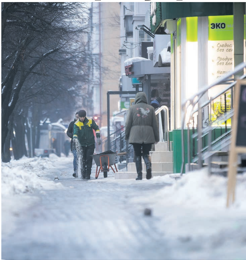
На центральных улицах дворники сражались с наледью.

- Мы вычищали дороги и образовывали снежные навалы. Заранее мы начали вывозить этот снег с территорий города, там, где он собран в больших количествах. Начали чистить ливне-