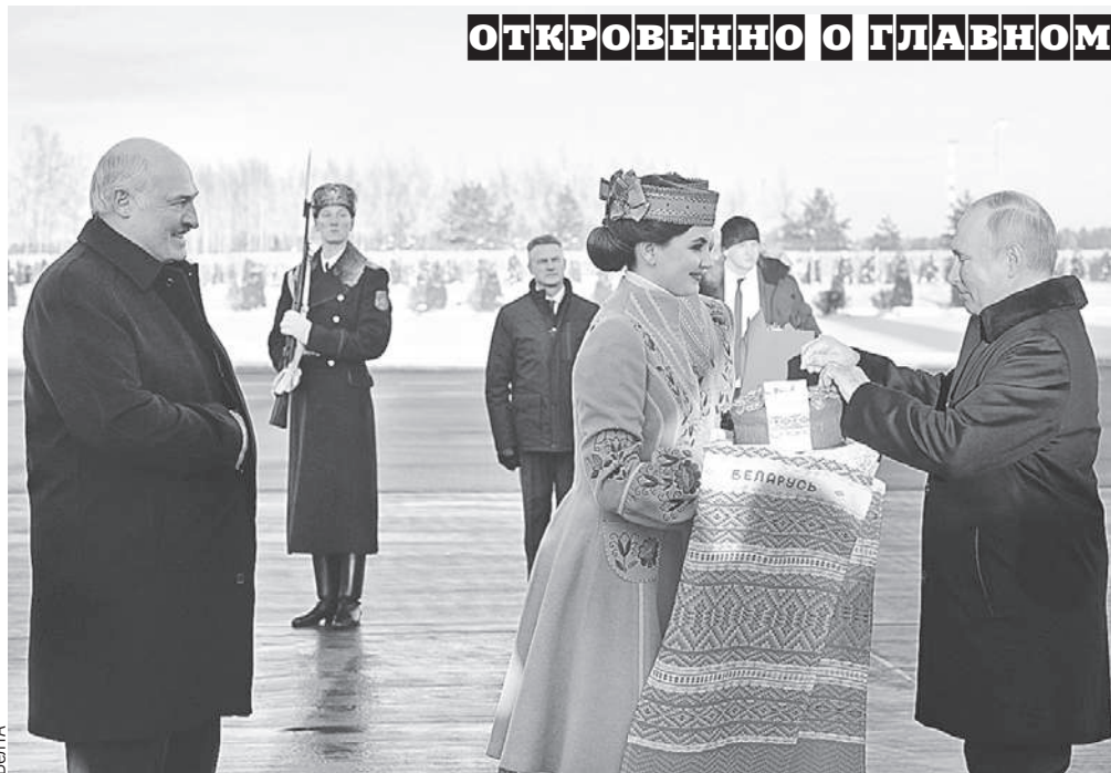
По добромому обычаю Владимира Путина встречали хлебом-солью.