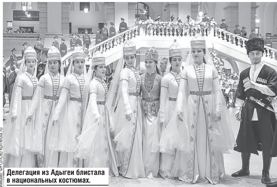
Делегация из Адыгеи блистала в национальных костюмах.