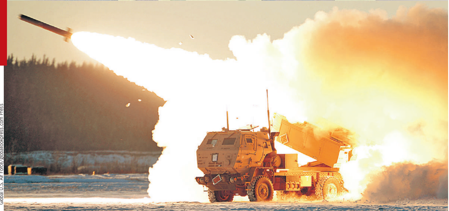
HIMARS - пожалуй, самое серьезное оружие в руках украинцев. Но и на них у нас есть управа.

Американский MIM-23 Hawk («Хок») - престарелый ветеран холодной войны. Он родом аж из 1960-х годов. Побывал на многих войнах. И в своем классе заработал репутацию оружия с самым низким коэффициентом в разряде ко-