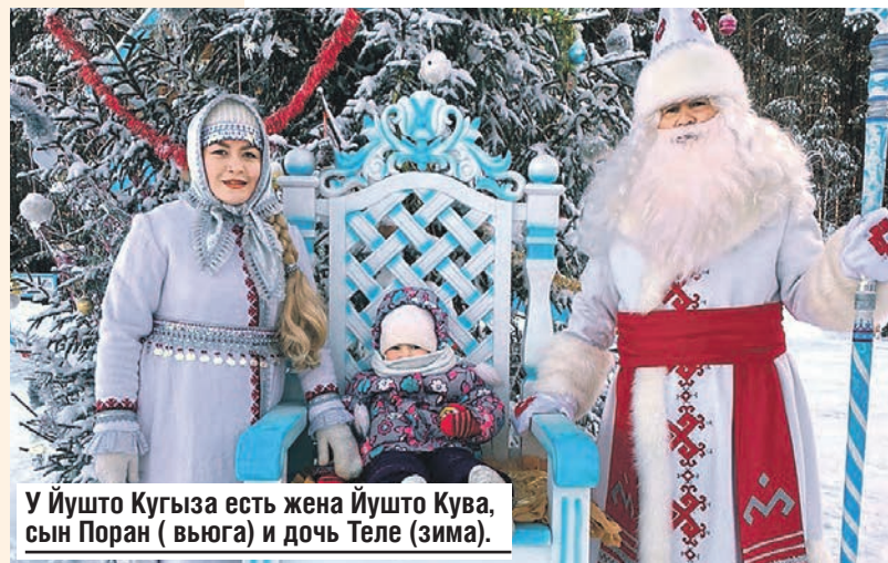
У Йушто Кугыза есть жена Йушто Кува, сын Поран (вьюга) и дочь Теле (зима).

На языке народа мари Йушто Кугыза означает «Холодный дедушка». Внешне он напоминает традиционного Деда Мороза, хотя есть и отличия. У него большая белая борода, длинный теплый белоснежный тулуп, а рукавицы украшены национальным марийским орнаментом.