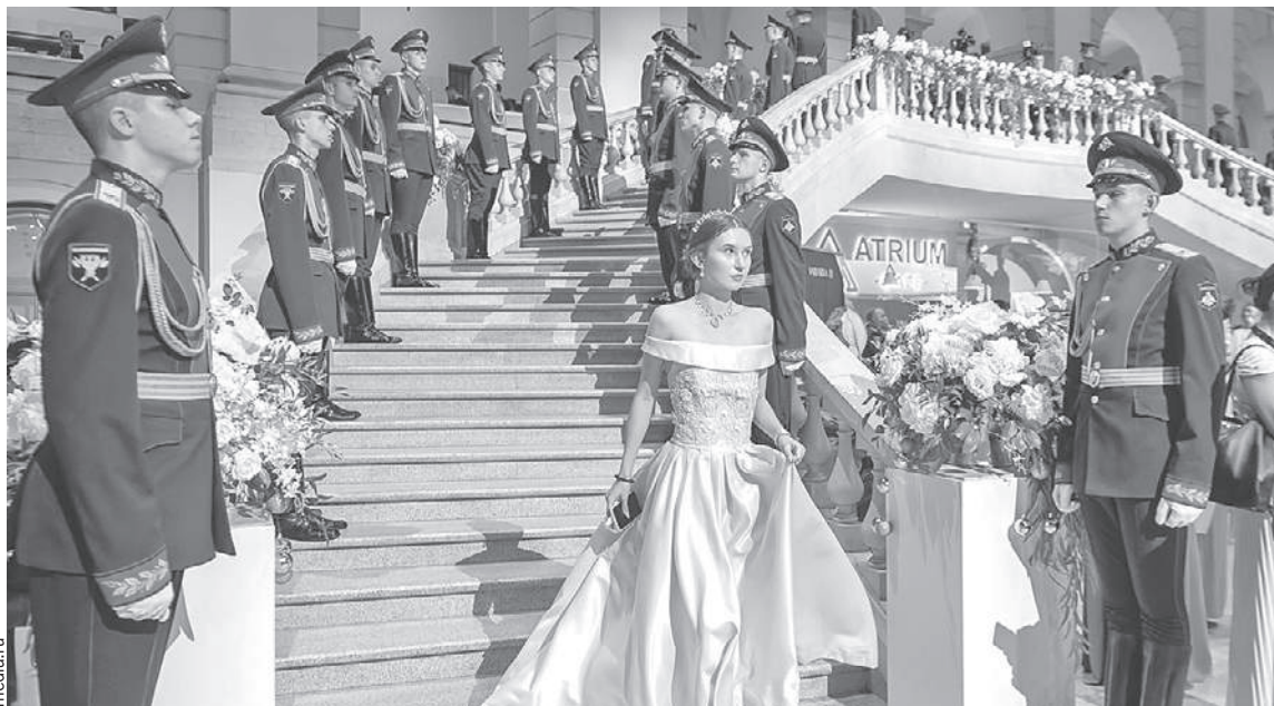
Спускаясь по парадной лестницей, можно почувствовать себя Наташей Ростовой.

Закружитесь под звуки вальса - детская мечта девочек.