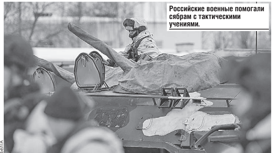
Российские военные помогли сямрам с тактическими учениями.