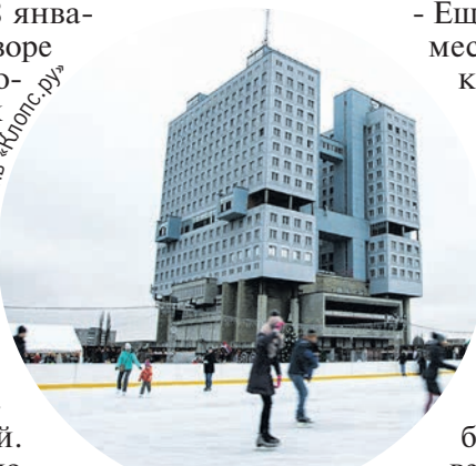
А не отправиться ли на каток...

- Начиная со 2 декабря и до завершения новогодних и рождественских праздников, 8 января, во внутреннем дворе «Понарта» и со стороны прилегающей к комплексу улицы Судостроительной работают торговые павильоны с деликатесами, кондитерскими изделиями, сувенирами, продуктами от местных сельхозпроизводителей. На ярмарке можно послушать выступления музыкантов.