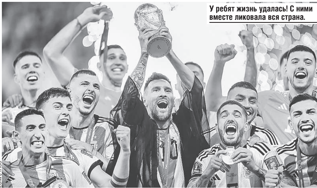
У ребят жизнь удалась! С ними вместе ликовала вся страна.

Мбаппе играл потрясающе, а его хет-трик в финале - мощнейшее достиже-