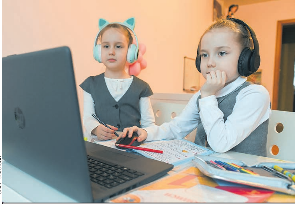
Ученики после пиков коронавирусной пандемии усвоили урок под названием «Дистант».