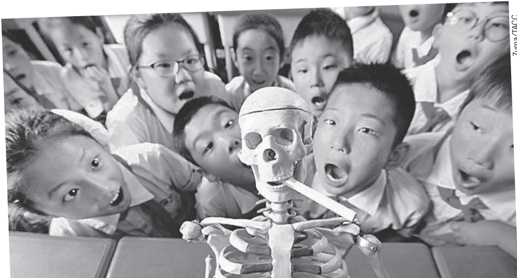
Кто знает, может быть, пионеры будущего смогут увидеть сигареты только в музеях и будут гадать, для чего они их предкам были нужны.