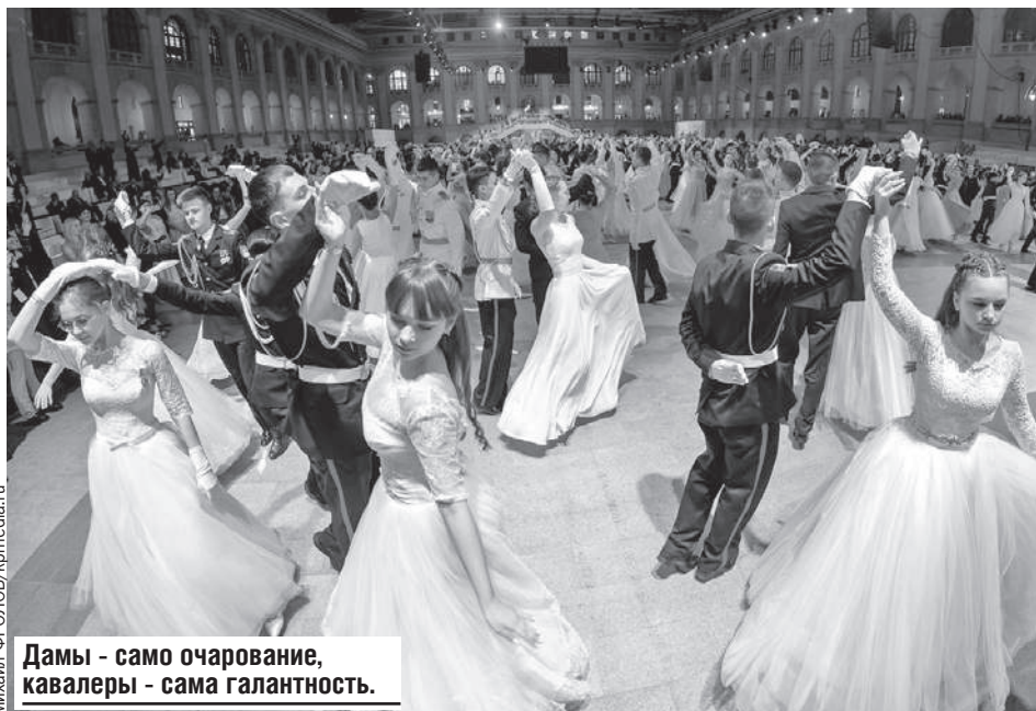
Дамы - само очарование, кавалеры - сама галантность.

А ребята из Полоцкого кадетского училища получили награду в номинации «Лучшая презентация среди зарубежных делегаций». Они уехали домой довольные собой: успели не только потанцевать, но еще и посмотреть Москву во время экскурсии.