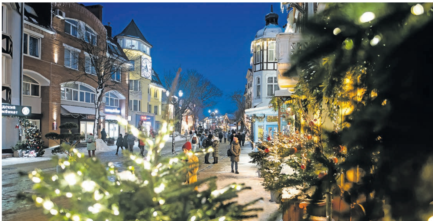
За нужной атмосферой отправляйтесь в Зеленоградск.