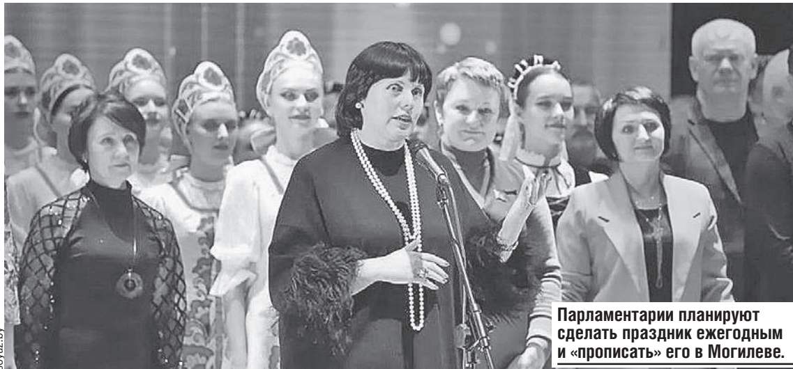
Парламентарии планируют сделать праздник ежегодным и «прописать» его в Могилеве.