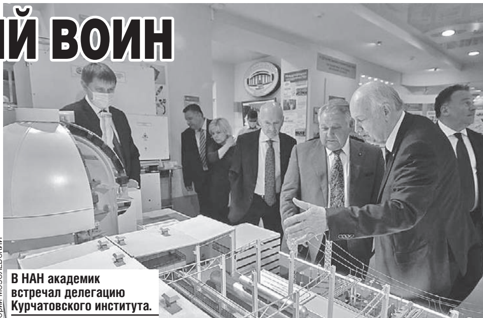
В НАН академик встречал делегацию Курчатовского института.

- Квантовый мир наполнен особой магией. Его законы, на первый взгляд, кажутся неприменимыми к нашей реальности. За взаимодействием и превращениями микрочастиц наблюдаю вот уже больше пятидесяти лет. И это удивительный, другой реальный мир, фантастическая terra incognita, - рас-