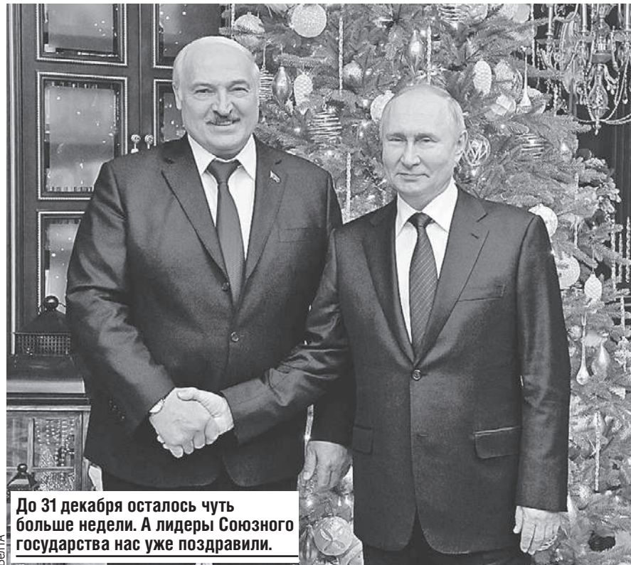
До 31 декабря осталось чуть больше недели. А лидеры Союзного государства нас уже поздравили.

- То, что мы производим, процентов на шестьдесят мы можем потребить. Все остальное производится на экспорт. Когда западные партнеры ушли, мы оказались для огромной России востребованными. Мы идем туда и замещаем тех, кто ушел. Мы вместе с россиянами - учеными, конструкторами - создадим такие образцы, которых не видел мир. Это не замашки какие-то нереальные - мы уже многое сделали.