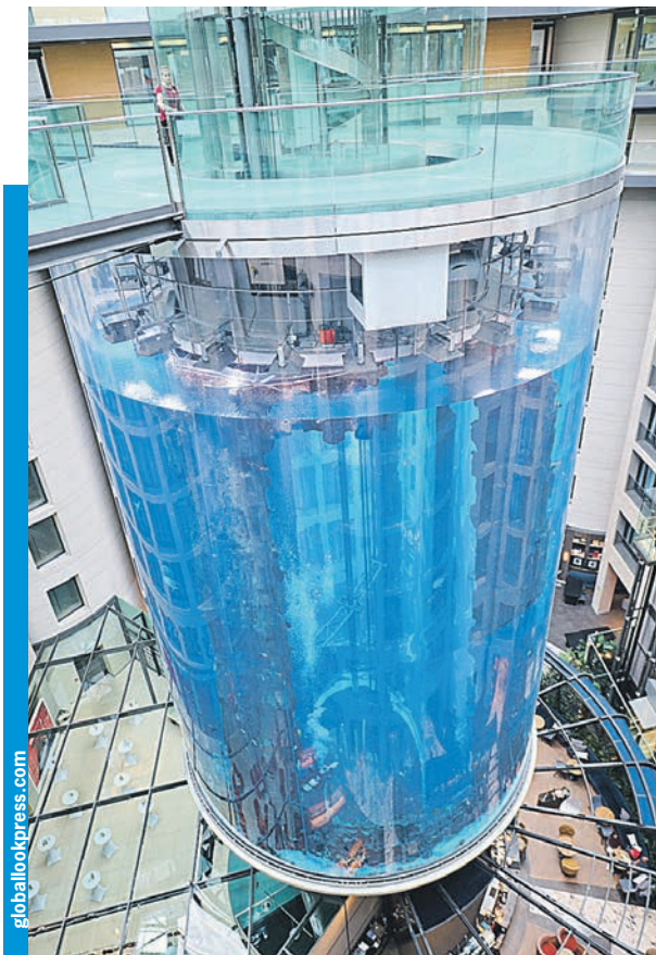
Так «АкваДом» выглядел до ЧП. Совсем недавно его отремонтировали. Аккуратные мастера привели в порядок лифт и заменили силиконовые уплотнители...

Усталостью материала называется его разрушение под воздействием механических повреждений и накоплением трещин. Классическим примером этого явления считается затопление Бостона патокой — инцидент,