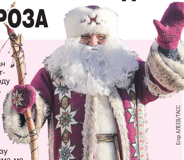
Тол Бабай бережно относится к природе и учит этому всех своих гостей.

и ушли. Но самый маленький не успел за всеми. С тех пор великан стал бродить по окрестностям, изучать природу и набираться ума-разума. Это и есть Тол Бабай - встретив однажды детей, он подружился с ними и с тех пор каждую зиму дарит им подарки. А помощницу удмуртскому Деду Морозу соткала из снежинок сама метель.