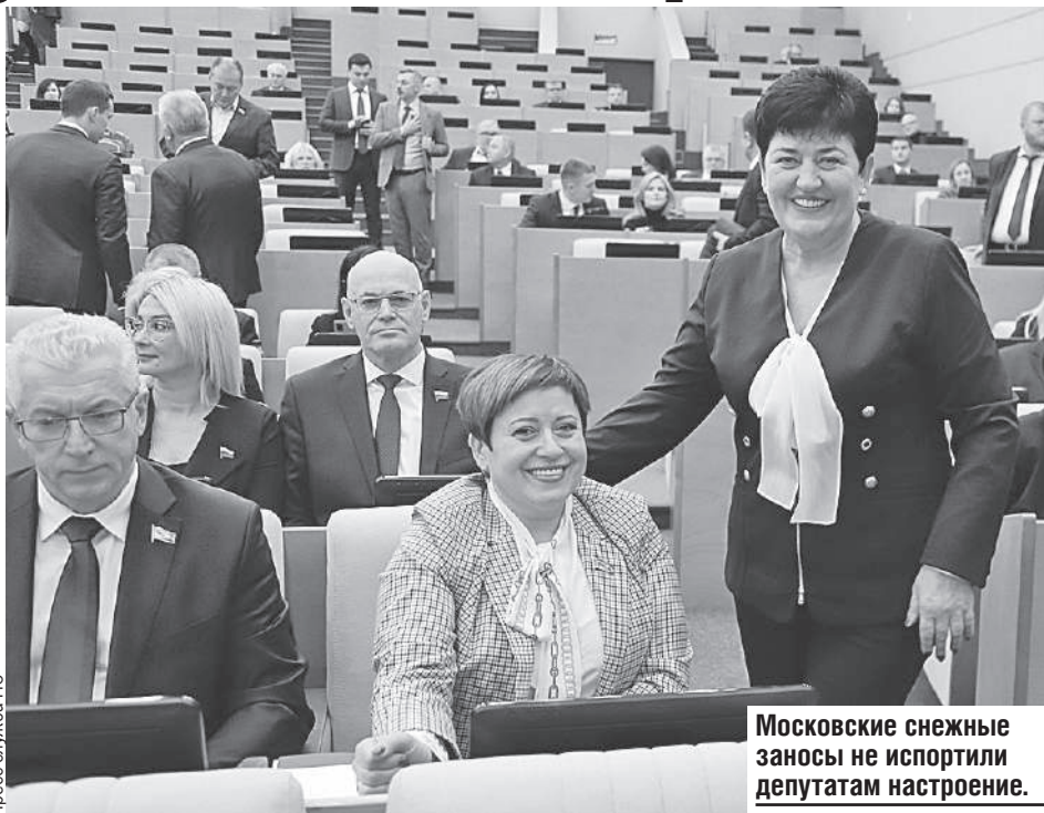
Московские снежные заносы не испортили депутатам настроение.

дая область, каждый район будет принимать, что в рамках Союзного государства эти вопросы находятся на контроле, они финансово обеспечены.