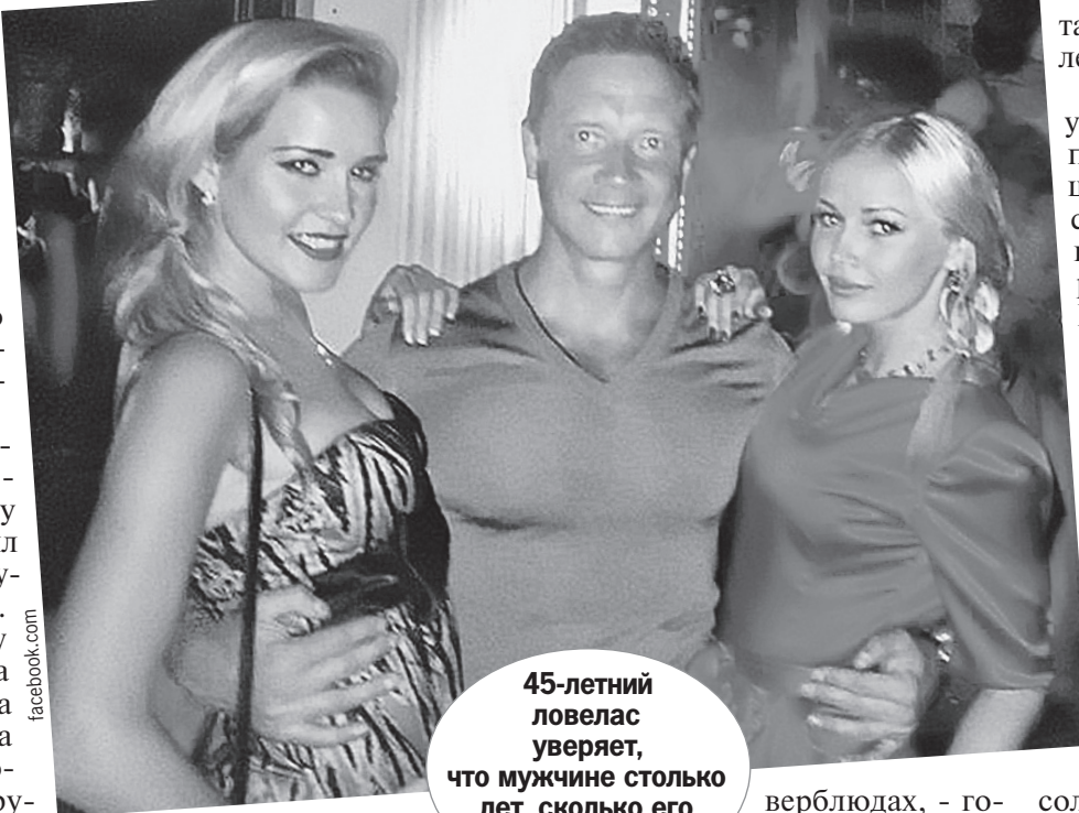
45-летний ловелас уверяет, что мужчине столько лет, сколько его девушкам.

- Никаких иллюзий по поводу того, что меня посадят, я не питал. В один прекрасный день мне повезло: забыли переподписать подписку о невыезде. Я вышел от