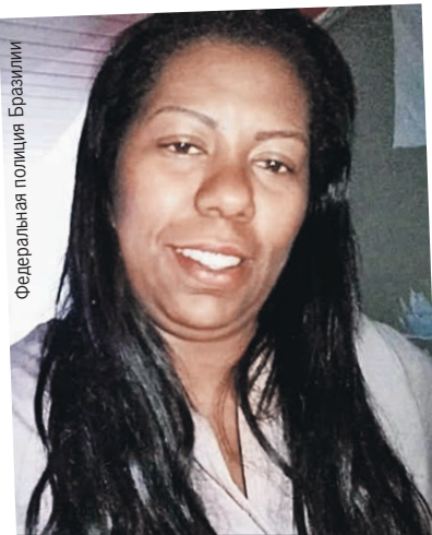
Эта дама и есть «крестная мать» преступного мира Бразилии.

Чтобы накрыть банду, бразильские полицейские даже просили помощи у военных. И все равно