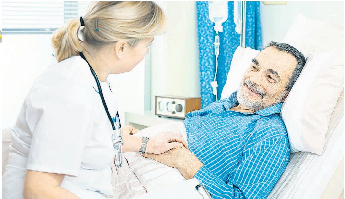
Главная задача - обеспечить, насколько это возможно, лучшее качество жизни пациента.