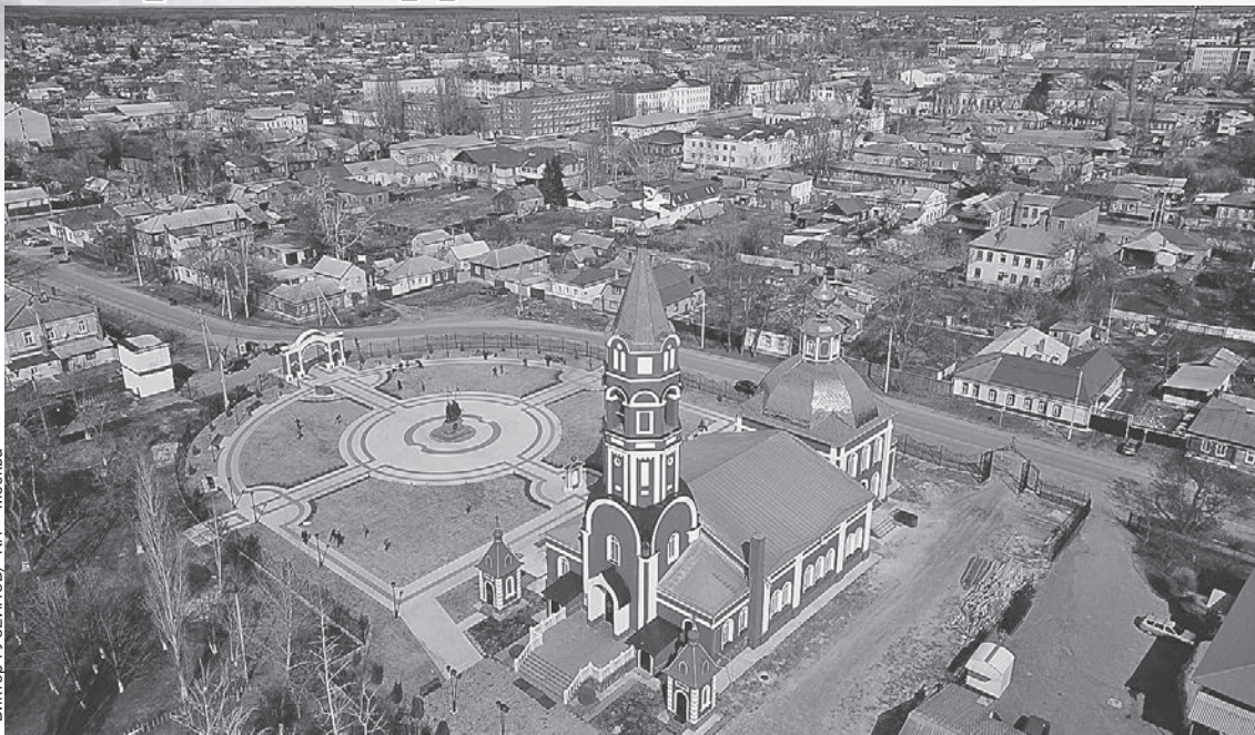
Центр Борисоглебска. Для жителей Балашова этот город в соседней Воронежской области является примером для подражания и предметом тихой зависти...