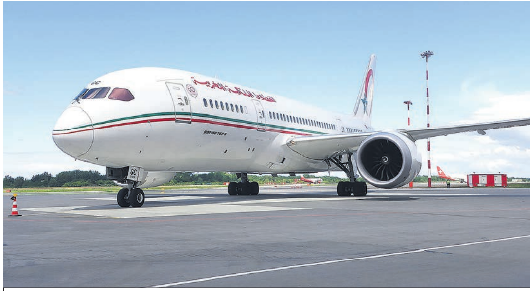
Лайнер принял на борт 274 марокканских болельщика.

В прошлую пятницу аэропорт «Храброво» получил разрешение федерального агентства воздушного транспорта (Росавиация) на ввод в эксплуатацию второй очереди аэровокзала. С середины мая аэровокзальный комплекс работал в тестовом режиме. Накануне получения ЗОС и разрешения на ввод в эксплуатацию от Росавиации были завершены работы по переводу операционной