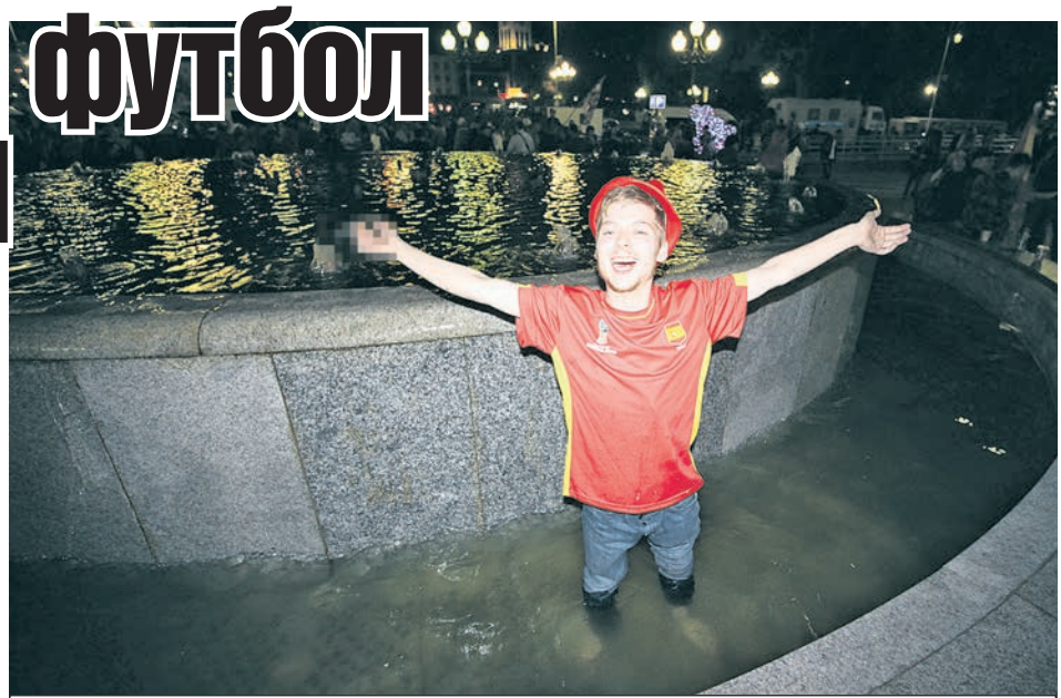
Прохладная вода желающих поплескаться не остановила.

После часа ночи группу, оккупировавшую фонтан, полиция вежливо просит выбрать новое место дисло-