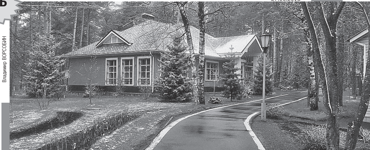
Этот аккуратный одноэтажный дом и есть загородная резиденция Тулеева. На крыльце - инвалидная коляска...

Почему из Кузбасса бегут люди (население области уменьшается на 5 - 10 тысяч человек ежегодно)? Почему у