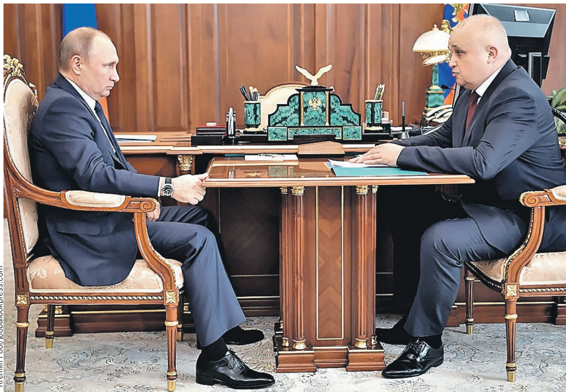
Все просьбы, с которыми пришел к Путину и. о. губернатора Кузбасса Цивилев, президент пообещал решить. «Перечень большой, но и область немаленькая», - сказал глава государства.

чень большой, но и область немаленькая. Что касается школьных автобусов, будем делать... Но нужно, чтобы они ездили по нормальным дорогам, а не разваливались через месяц.