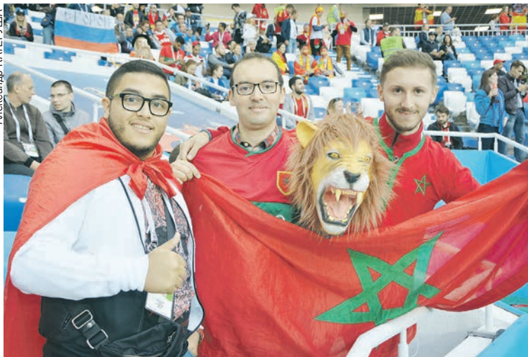
Болельщики Марокко во время игры оказались самыми шумными.

ню, высказал пожелание не встречаться в одной восьмой финала с хозяевами чемпионата, а к началу матча в Калининграде было понятно, что победитель группы В попадает как раз на хозяев - на Россию. На этот счет у Йерро, можно сказать, были личные причины. В 2002 году на чемпионате мира он в составе сборной Испании играл в одной чет-