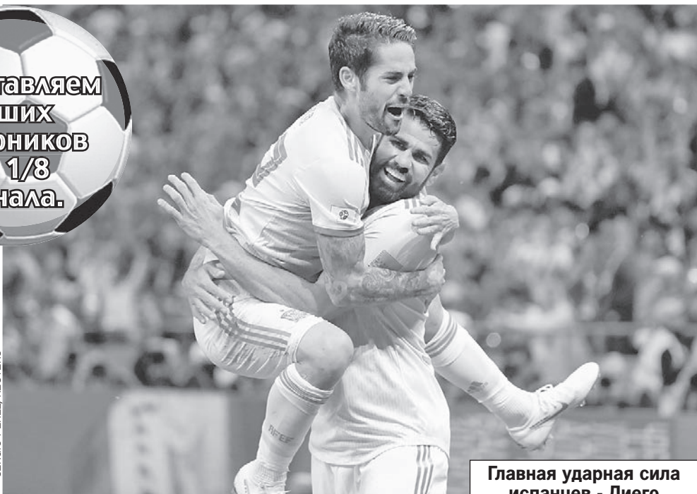
Главная ударная сила испанцев - Диего Коста (справа) и Иско празднуют гол.