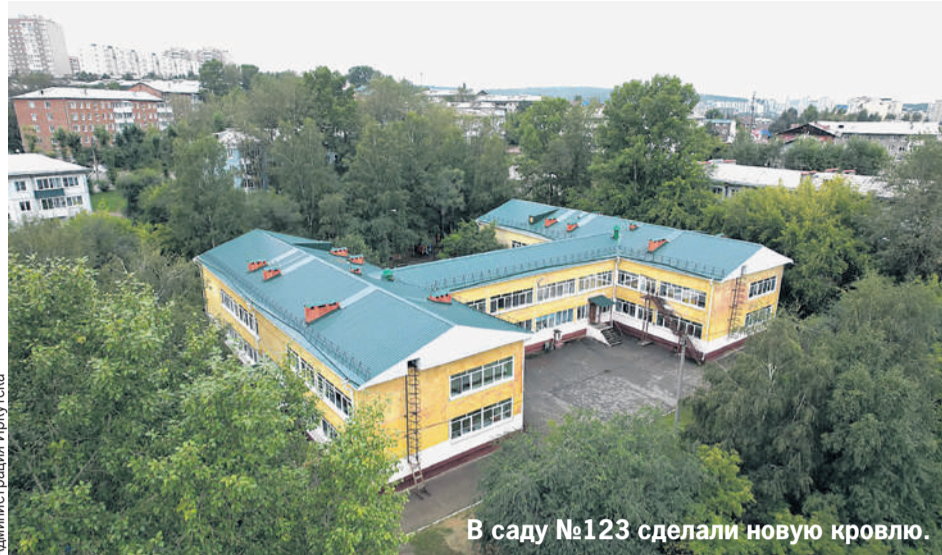
В саду №123 сделали новую кровлю.