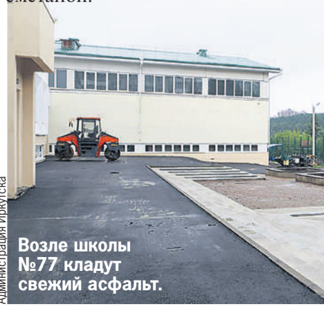
Возле школы №77 кладут свежий асфальт.

Кстати, в саду есть интересная традиция проводить «Вкусный день», когда родители приходят изучают меню, наблюдают за технологией приготовления, сами дегустируют блюда, чтобы быть уверенными - их дочерей и сыновей кормят отлично. А еще шеф-повар с удовольствием раскрывает им рецепты любимых детворой блюд, например сырников со сметаной.