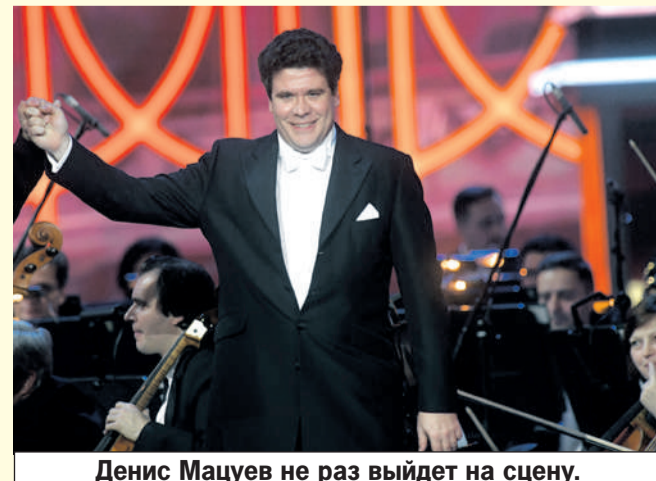
Денис Мацуев не раз выйдет на сцену.