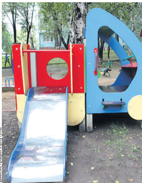
А на площадке для прогулок установили горки и не только.

Площадка для прогулок, кстати, тоже преобразилась. За счет инициативного проекта, а это два миллиона рублей, здесь установили горки, песочницы, лабиринт, столики и стулья. Есть где порезвиться!